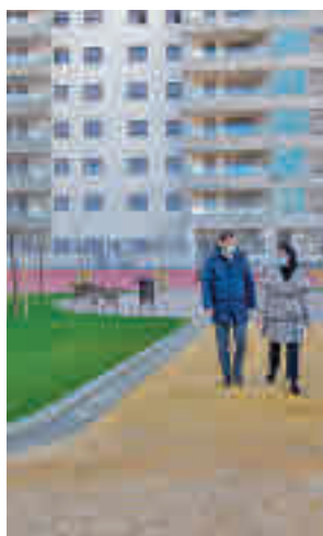
Visita al Andrés Segovia

En los últimos meses se han creado 3 parques nuevos y reformado otros 3: Pinar de Soto, Andrés Segovia, Jardines del Río, Libertad, San Fernando y Ronda de Po-