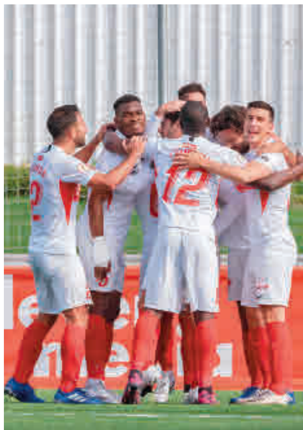
El Sanse camina con paso firme