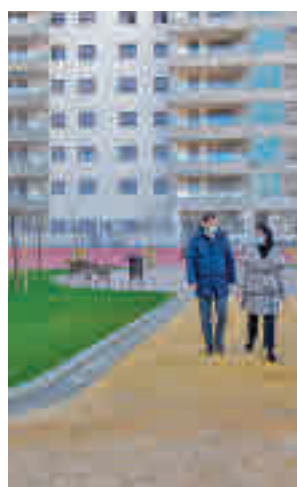
Visita al Andrés Segovia

En los últimos meses se han creado 3 parques nuevos y reformado otros 3: Pinar de Soto, Andrés Segovia, Jardines del Río, Libertad, San Fernando y Ronda de Po-