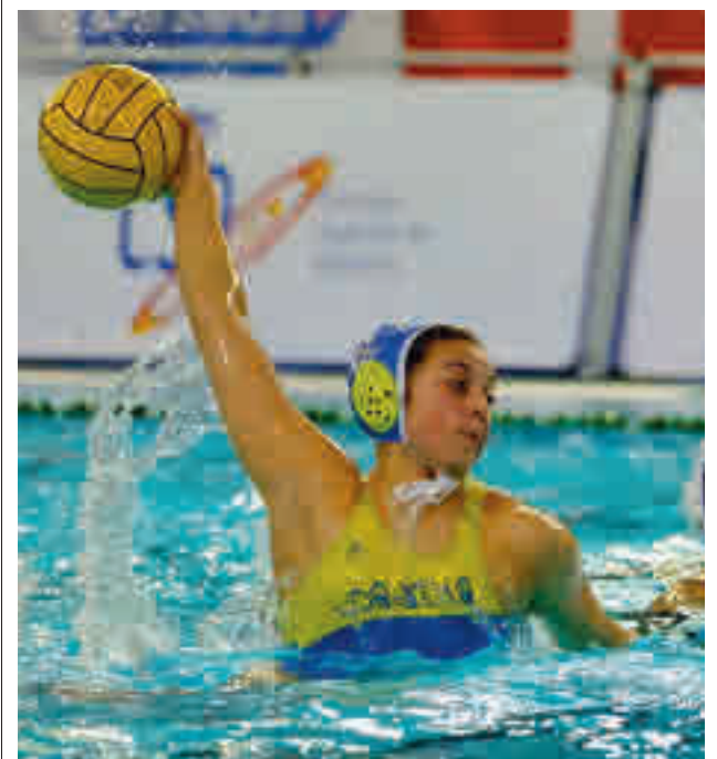
El conjunto de Boadilla es cuarto

Tras su importante victoria del pasado fin de semana en la cancha del líder, el Feel Voley Alcobendas recibirá este sábado 13 (19 horas) al tercero de la tabla, el CV CCO 7 Palmas.