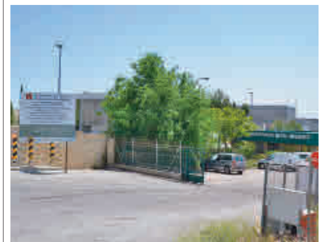
Vertedero del Sur en Pinto

La Policía Local de Valdemoro detuvo a un individuo por presuntamente agredir a su pareja. El hijo de la víctima fue el que avisó al 112.