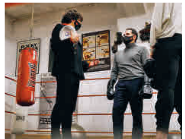
Aguado visitó un gimnasio

El vicepresidente recordó que la práctica deportiva reduce el gasto sanitario.