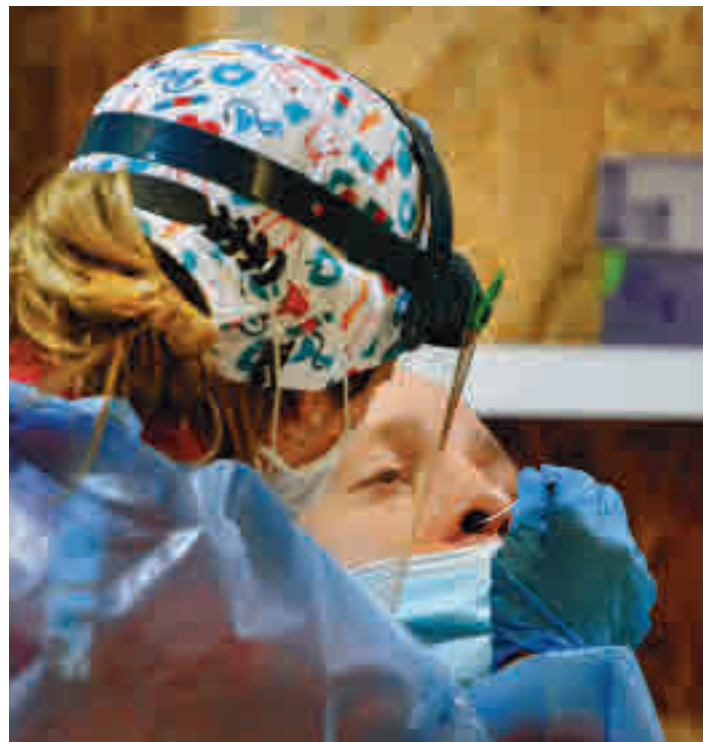
Los casos han bajado en la zona Sur

Fuenlabrada sigue siendo la ciudad con una incidencia acumulada más alta, con 779 casos por cada 100.000 habitantes en los últimos catorce