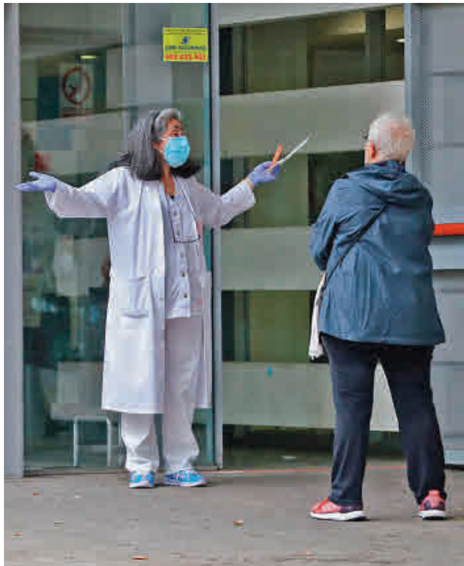
Centro de salud de Doctor Tamames

Una de las localidades donde se reflejan esos cambios es Coslada. Después de unos días con un cierre perimetral que ha afectado a todo el municipio, varias de sus Zonas Básicas de Salud (ZBS) han logrado bajar de la barrera de los 1.000 casos por cada 100.000 habitantes, uno