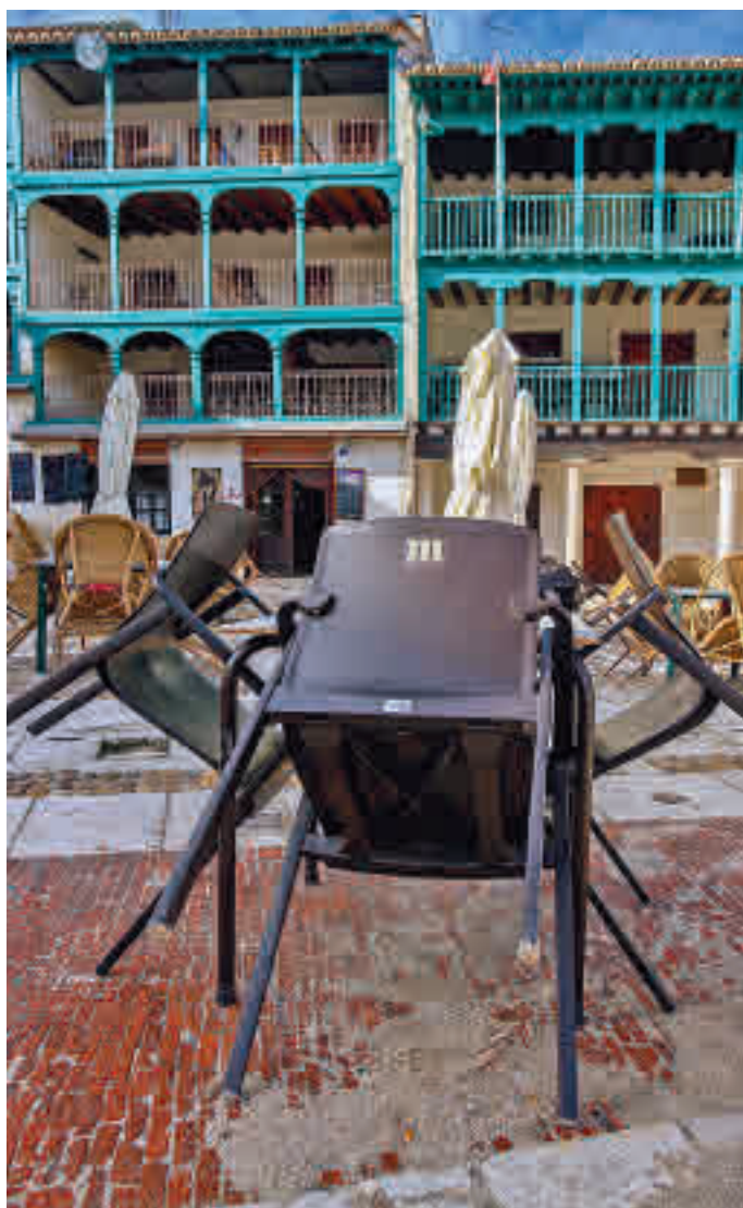
Las pequeñas empresas madrileñas son las grandes damnificadas

La mayoría de los autónomos que cesaron su actividad en este período eran hombres (con 4.368 menos) y más de 1.600 eran mujeres. Por edades, más de 6.600 autónomos de 60 años o más dejaron de serlo en este período, mientras que se redujeron