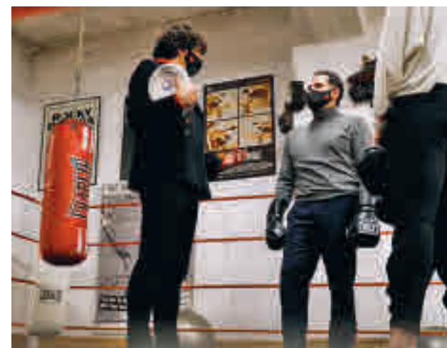
Aguado visitó un gimnasio

El vicepresidente recordó que la práctica deportiva reduce el gasto sanitario.