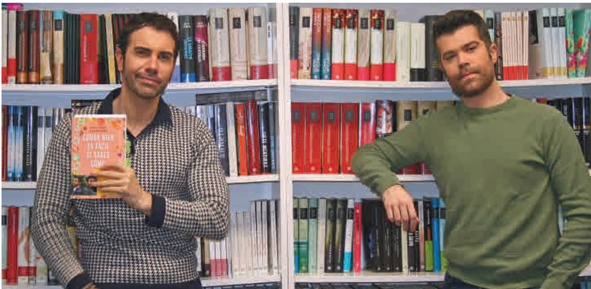
Los dos autores posan con un ejemplar del libro en la sede de la editorial Planeta