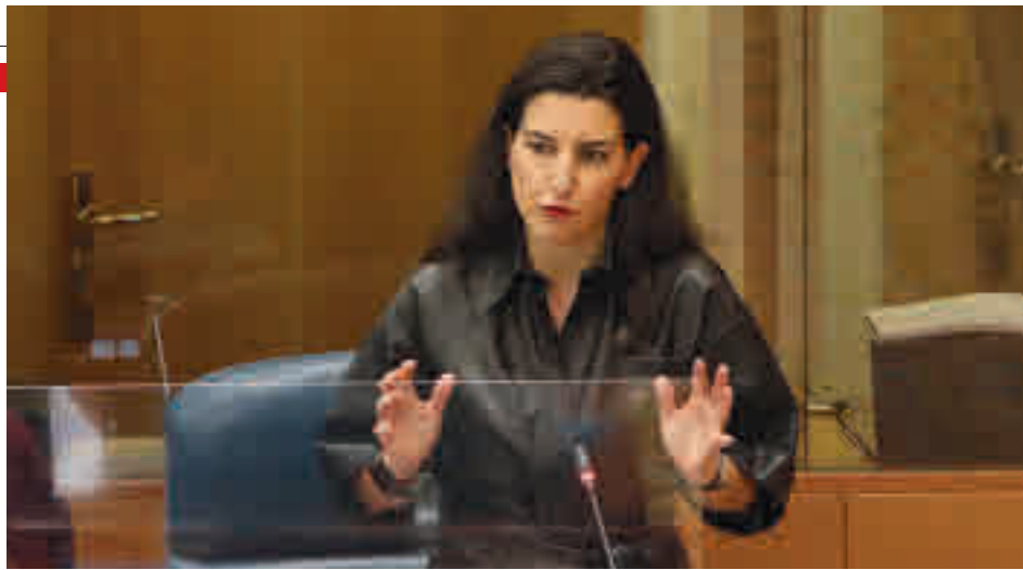
Rocío Monasterio pone condiciones al apoyo de Vox

partes del Gobierno, en el que presentaron vaciamente que coincidían en la necesidad de coincidir", no se conocen "ni líneas generales, ni estrategias, ni un folio indicativo". "Su Gobierno lleva dos años fallando y, esta vez, la situación es crucial. Asuma su responsabilidad", concluyó Gabilondo.