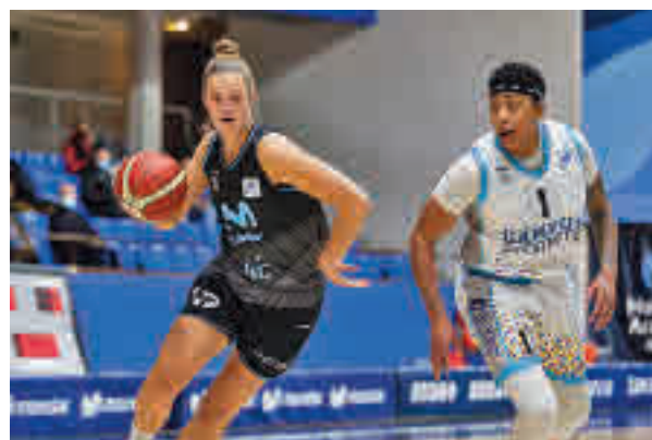
El 'Estu' regresa a Magariños