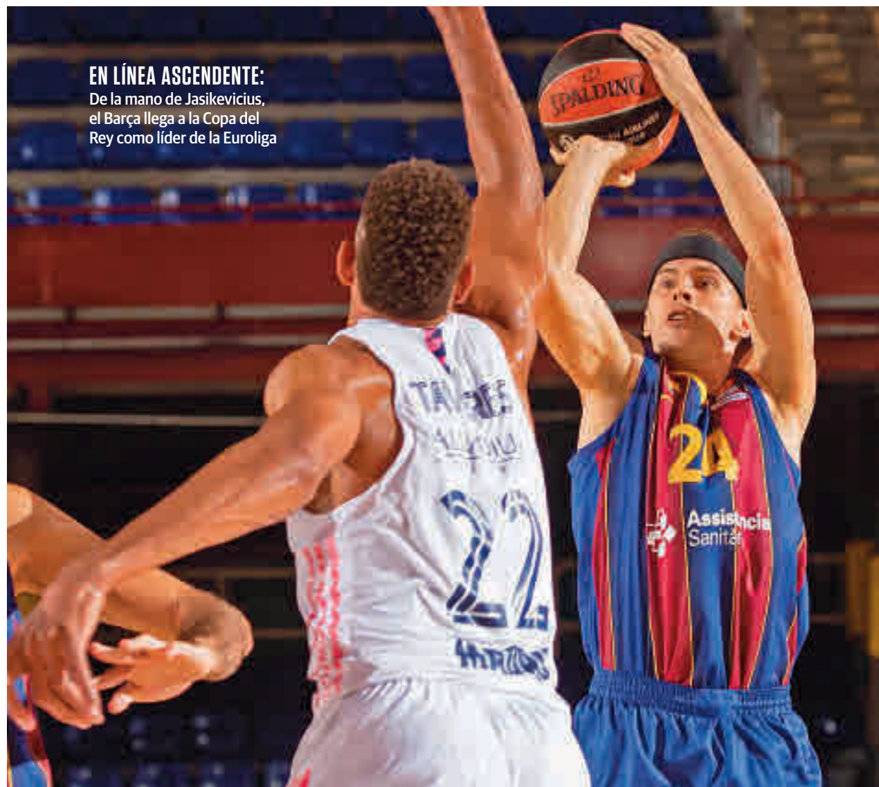
EN LÍNEA ASCENDENTE: De la mano de Jasikevicius, el Barça llega a la Copa del Rey como líder de la Euroliga

Real Madrid, que se vio las caras este jueves con el Valencia Basket, un encuentro del que habrá tomado buena nota el otro gran candidato. El Barça cierra la ronda de cuartos de final este viernes (21:30 horas) ante el Unicaja, con el objetivo de hacer buenos los pronósticos y colarse en una semifinal donde se vería las caras con el ganador del TD Systems Baskonia-Joventut (viernes, 18:30). Es cierto que los azulgranas siguen a rebu-