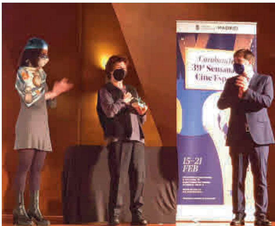
Julieta Serrano recoge el Premio Puerta de Toledo en la gala inaugural del 4 de febrero

Además, como homenaje al cine español y en representación de todos los ma-