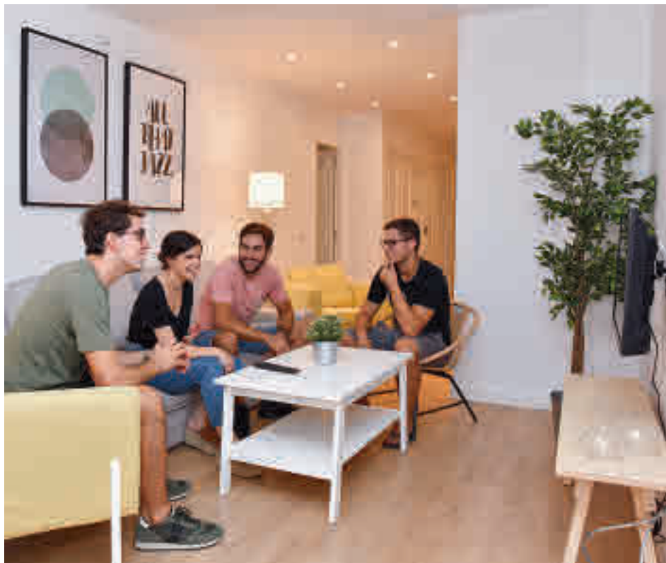
La iniciativa se dirige a los universitarios de la región