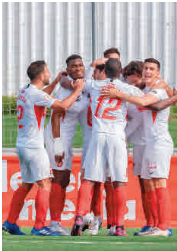
El Sanse camina con paso firme

EL CLUB DE MATAPIÑONERA ACUMULA 27 PUNTOS, 8 MÁS QUE EN LA 19-20