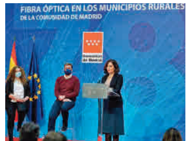
Ayuso anunció la finalización de los trabajos

"Estamos comprometidos con el problema de la despoblación y con vertebrar Madrid para que todos los habitantes, todas las personas que nos visitan, accedan a los mismos servicios de la misma manera, independientemente del municipio donde se encuentren. Todos los madrileños tienen que tener las mismas oportunidades", señaló Díaz Ayuso.