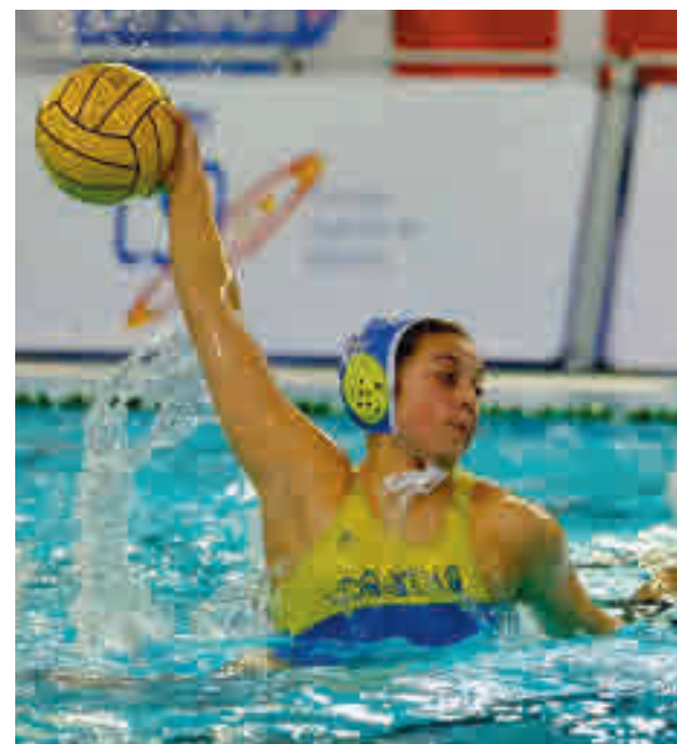
El conjunto de Boadilla es cuarto

Tras su importante victoria del pasado fin de semana en la cancha del líder, el Feel Voley Alcobendas recibirá este sábado 13 (19 horas) al tercero de la tabla, el CV CCO 7 Palmas.