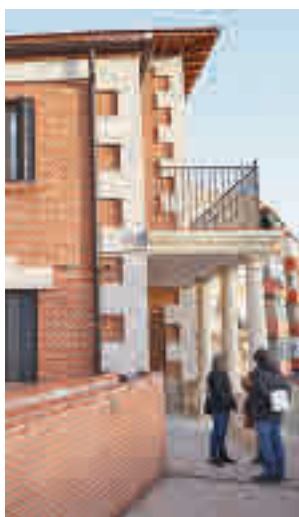
La nueva dotación