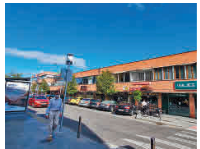
Zona comercial de Pozuelo de Alarcón

También es una ocasión especial para celebrar este día en los bares y restaurantes de la ciudad y degustar la oferta gastronómica.