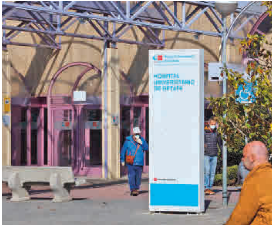
La incidencia acumulada ha bajado en Getafe

Según el documento, que recopila los datos existentes hasta el domingo 7, la tasa global de Getafe se situó en los 692 casos por cada 100.000 habitantes en los 14 días anteriores, una cifra sensiblemente inferior a los 909 del pasado 2 de febrero y a los 947 del 26 de enero. Este dato mantiene a Leganés como la segunda gran ciudad del Sur con unos números más favorables, a pesar de que siguen siendo demasiado elevados. La localidad getafense solo está por encima de Valdemoro (488) y de Leganés (610) y