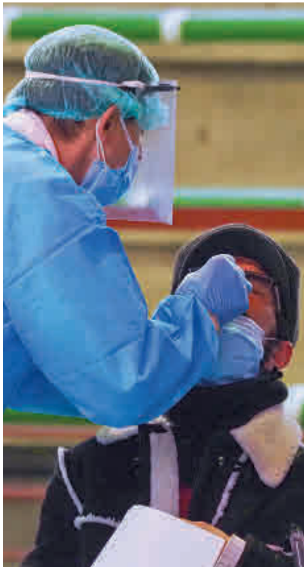
Los contagios siguen bajando en el Noroeste

El panorama es más esperanzador en el resto de grandes