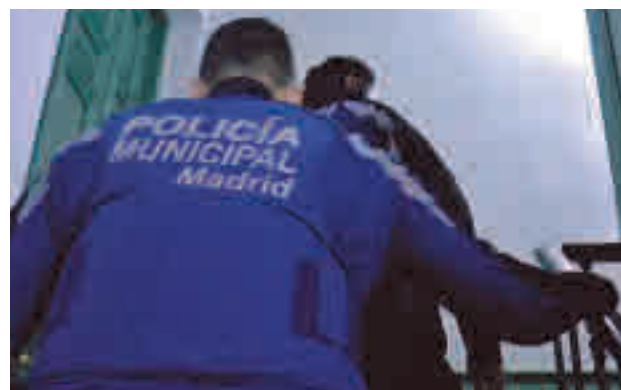
La actuación policial en una vivienda de Chamberí

El fin de semana pasado los agentes dismantelaron 395 fiestas en domicilios y locales y realizaron un total de 738 propuestas de sanción por no usar mascarilla, 331 denuncias por agruparse más