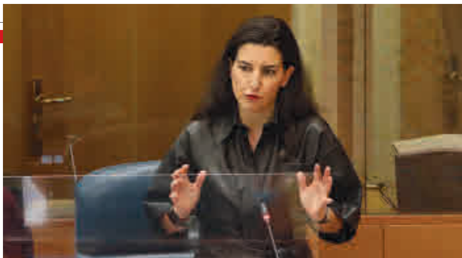
Rocío Monasterio pone condiciones al apoyo de Vox

partes del Gobierno, en el que presentaron vaciamente que coincidían en la necesidad de coincidir", no se conocen "ni líneas generales, ni estrategias, ni un folio indicativo". "Su Gobierno lleva dos años fallando y, esta vez, la situación es crucial. Asuma su responsabilidad", concluyó Gabilondo.