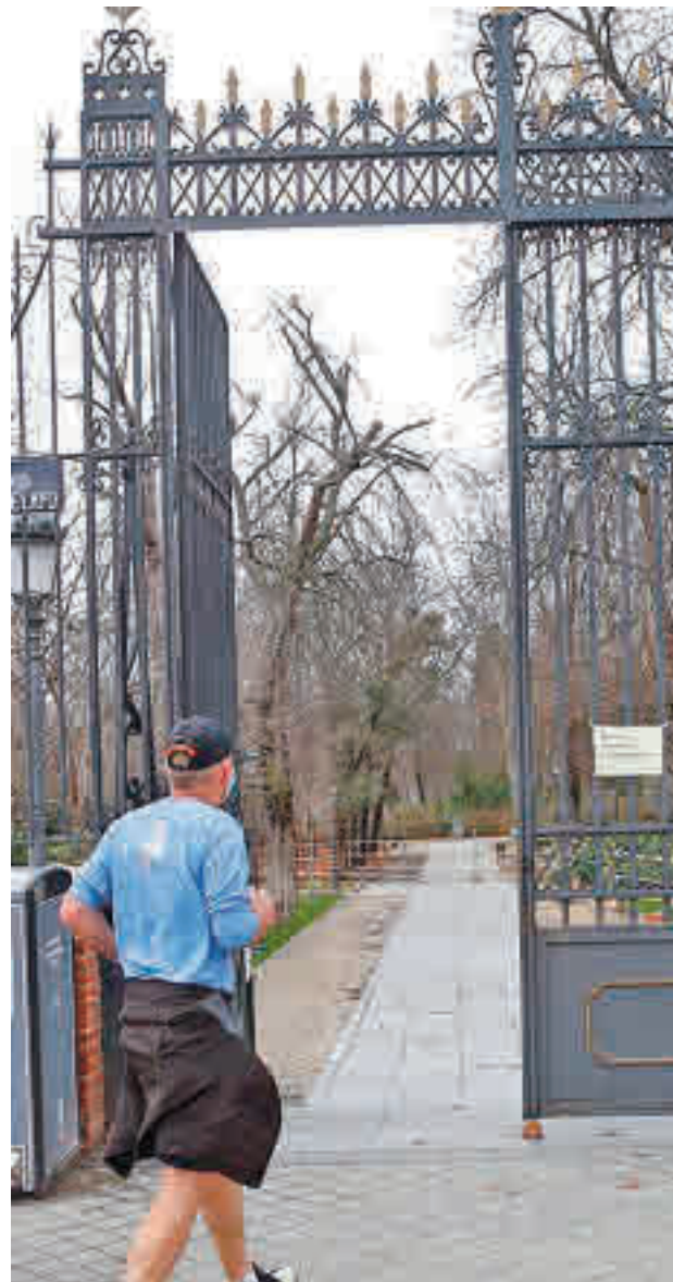
La puerta de Sáinz de Baranda

Cibeles prevé que el parque recupere la normalidad en marzo ● Se permite ya el acceso por las puertas de Sáinz de Baranda y de Reina Sofía solo para ir a la biblioteca y al quiosco Florida