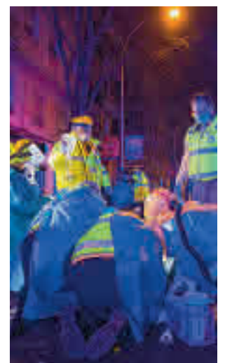
El operativo sanitario

Toda la actualidad de los distritos de Madrid en nuestra web