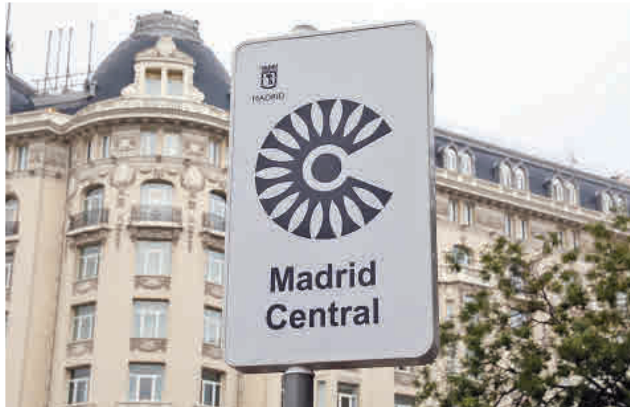
La zona de bajas emisiones que engloba todo el distrito Centro de la capital

A pesar de que la sentencia no es firme y de que es susceptible de recurso de casación en el plazo de 30 días, el Ayuntamiento de Madrid