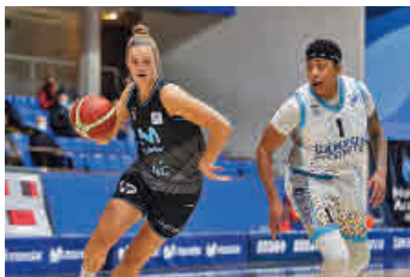
El 'Estu' regresa a Magariños