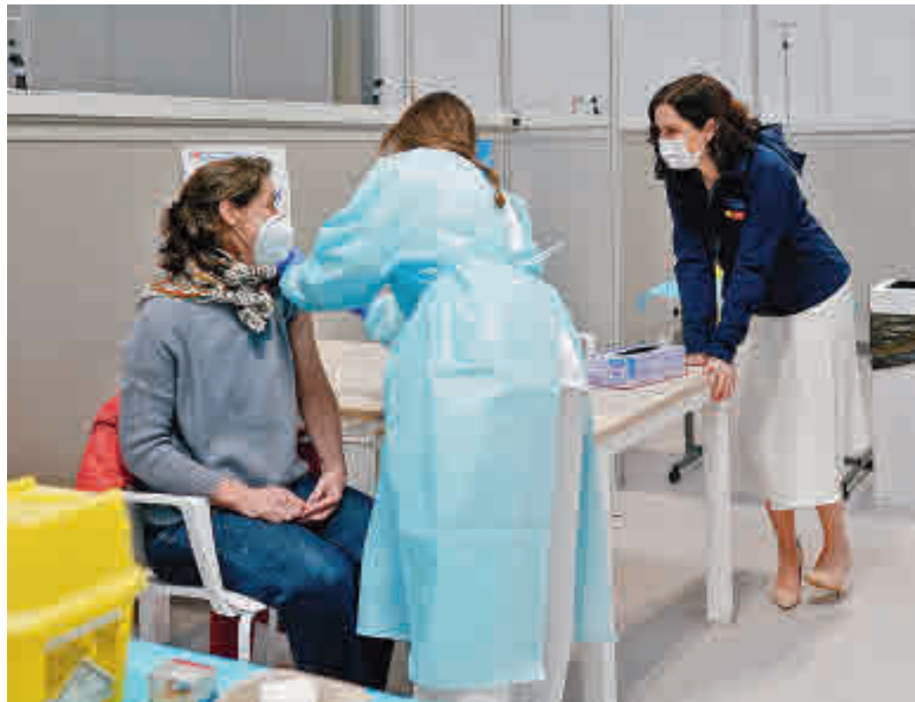
Isabel Díaz Ayuso hizo el anuncio en su visita al Isabel Zendal

LAS DOSIS COMENZARON A ADMINISTRARSE EN LA TARDE DE ESTE JUEVES 25