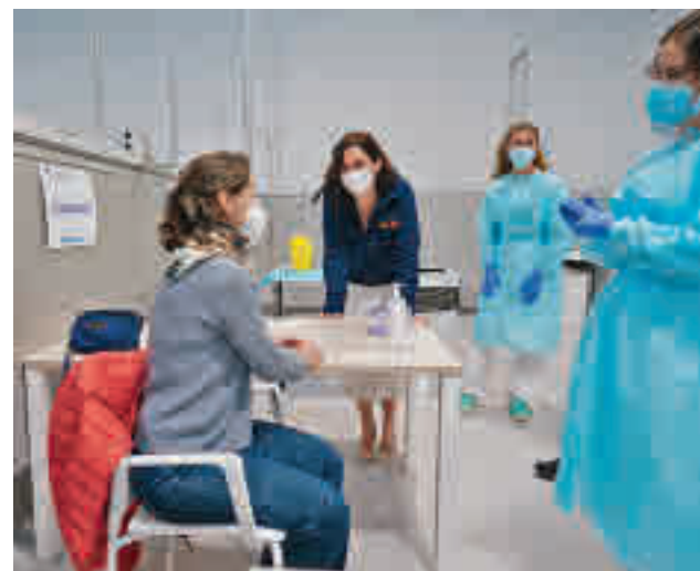
El Isabel Zenda será uno de los centros de vacunación