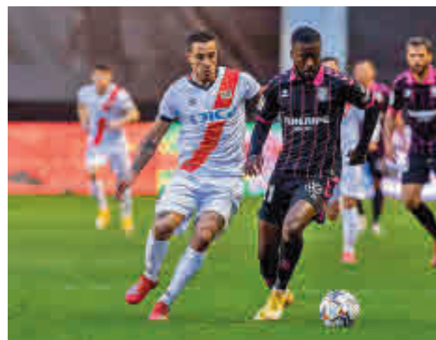
El Rayo cayó derrota en su último partido en casa

Con más moral llegan a esta jornada 27 los otros tres representantes de la región. El Leganés parece haber reaccionado a tiempo y ya está a solo tres puntos de la segunda plaza de ascenso directo. La llegada de Asier Garitano al ban-