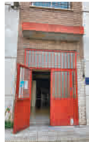
Hotel de Asociaciones