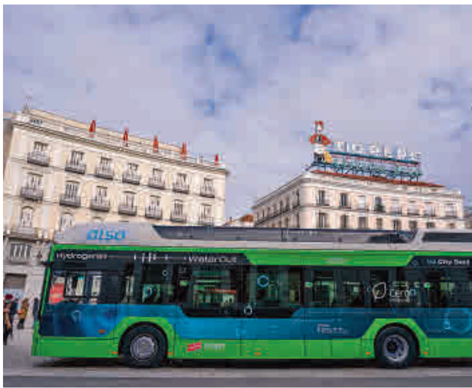
El nuevo autobús de hidrógeno de la Comunidad de Madrid