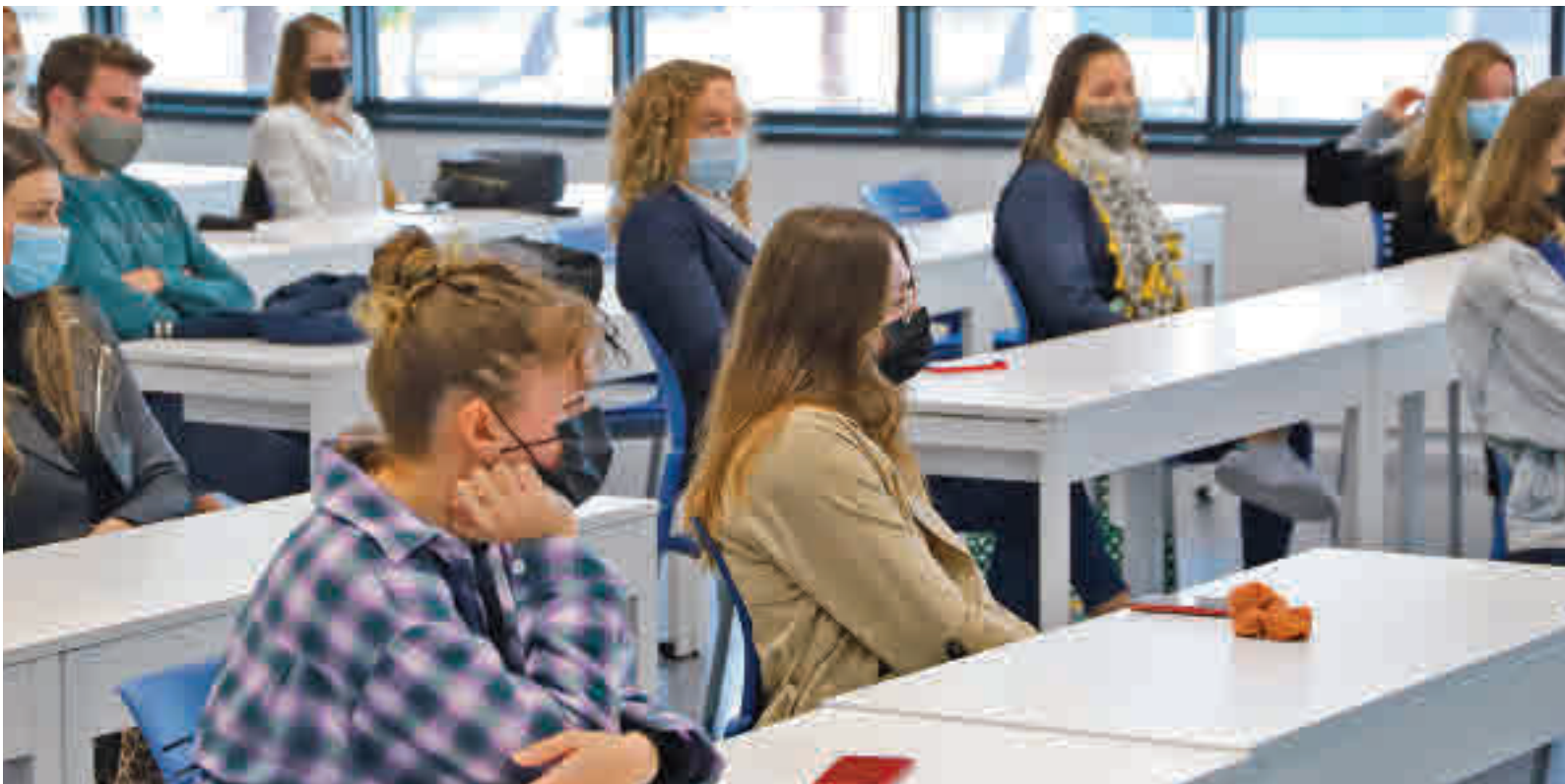
La tendencia es buscar una educación más global