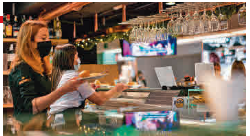
La Semana Santa podría ser menos restrictiva que el invierno

y de salud", por lo que ha instado a reducir lo antes posibles las hospitalizaciones para "poder atender a otras patologías". "Ojalá no asistamos a una cuarta ola que todos tememos", concluyó la portavoz del Gobierno.