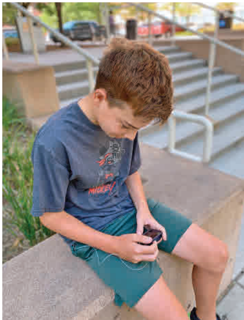
Las aplicaciones de videojuegos triunfan entre los menores

En relación a los últimos datos de Microsoft, son más de 100 millones de usuarios activos al mes los que disfrutan creando sus propios mundos e interactuando con otras personas. En este caso la mayoría de los menores accede para participar de opciones como luchas, desafíos o deportes.