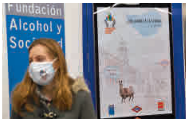
Uno de los carteles de la campaña

La Comunidad de Madrid ha presentado la campaña de educación sanitaria 'Alcohol y menores, yo no lo veo' que se exhibirá en los soportes publicitarios de los andenes de Metro de Madrid hasta el próximo 1 de marzo, para