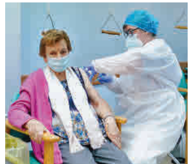
Vacunación en una residencia madrileña

La UE también mantiene que ese objetivo se puede alcanzar.