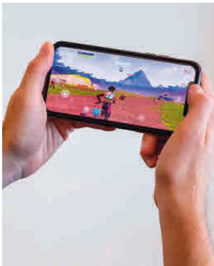
Fortnite, uno de los juegos de moda