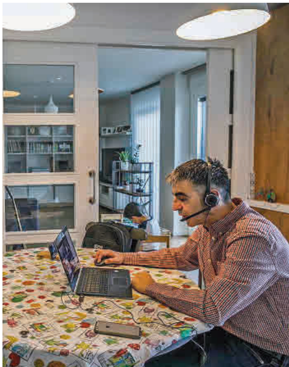
El teletrabajo es un fenómeno cada vez más extendido

El Estudio Diagnóstico Corresponsabilidad-Conciliación en la Comunidad de Madrid se ha elaborado con más de 500 entrevistas, realizadas a residentes en la región con edades comprendidas entre 18 y 64 años. La mitad de ellos residen en la capital y la otra mitad en distintos puntos de la geografía regional. El objetivo es conocer el grado de participación de los madrileños en las tareas del hogar y evaluar la incidencia de la pandemia en esta situación.