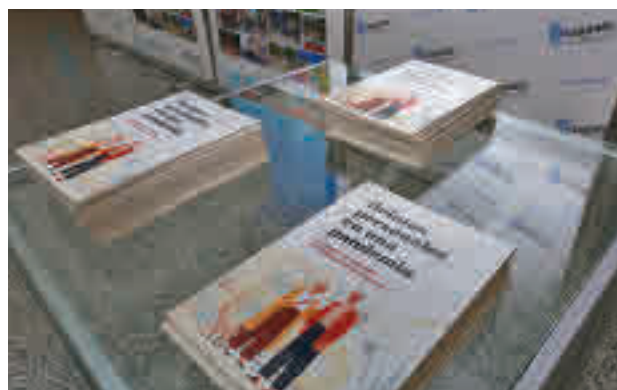
Ejemplares del libros de relatos

Un total de 27 mujeres y 12 hombres plasmaron por escrito sus sensaciones en este