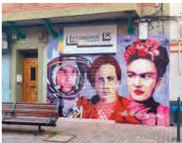
Fachada de la sede de Leganemos