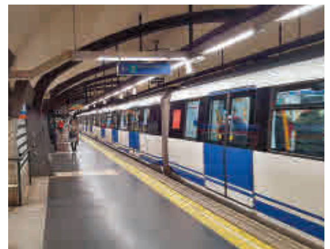
Metro de Madrid

Según Roldán, el mantenimiento predictivo permite tomar medidas antes de que se produzcan incidencias, de manera que supone “ganar en fiabilidad”. Por otro lado, la información en tiempo real que transmite el tren digital va a permitir a los usuarios conocer de antemano cuál es la ocupación. La futura estación de Gran Vía será la primera con esta tecnología.