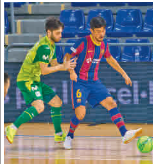
En la primera vuelta, el Inter ganó en el Palau por 2-3

Por otro lado, madrileños y catalanes aún tienen que disputar el partido correspondiente a la Supercopa, aplazado en enero por la borrasca 'Filomena'.