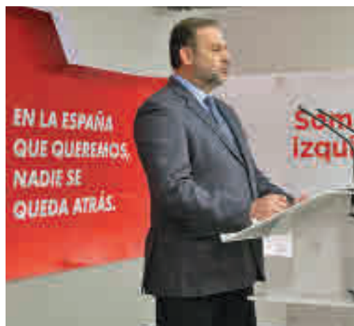
El ministro Ábalos, en una comparecencia

EL PERIÓDICO GENTE NO SE RESPONSABILIZA NI SE IDENTIFICA CON LAS OPINIONES QUE SUS LECTORES Y COLABORADORES EXPONGAN EN SUS CARTAS Y ARTÍCULOS