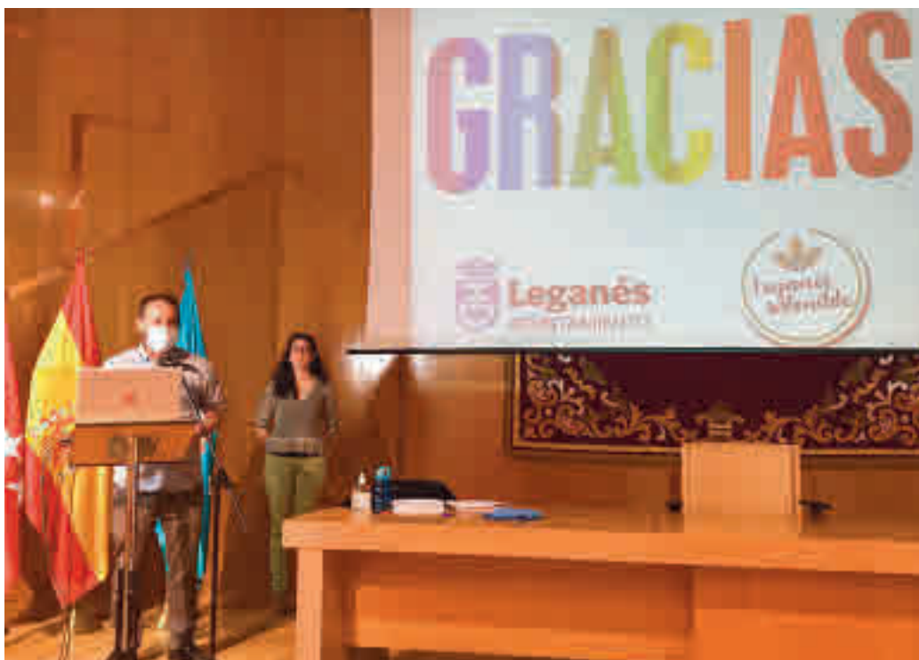
Firma del acuerdo entre las partes afectadas