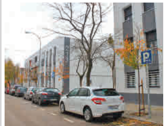
Varios de los edificios de la zona

Todos los pisos corresponden a dos promociones ubicadas en las confluencias de las calles de Mar de Las Antillas y Abárzuzu, y con éstas ya son 706 las casas entregadas a familias con derecho a realojo en este emplazamiento, concretamente en los sectores norte, este y sur, que son los más avanzados. A éstas se le sumarán en menos de un mes las 137 sorteadas, una vez que se hayan llevado a cabo las mudanzas de sus nuevos inquilinos.