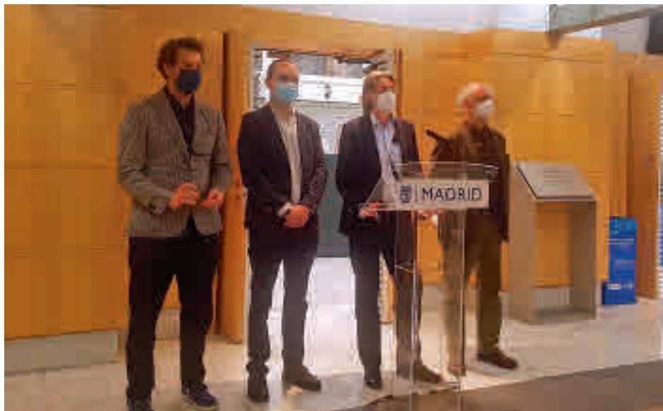
Un momento de la rueda de prensa, celebrada en Cibeles