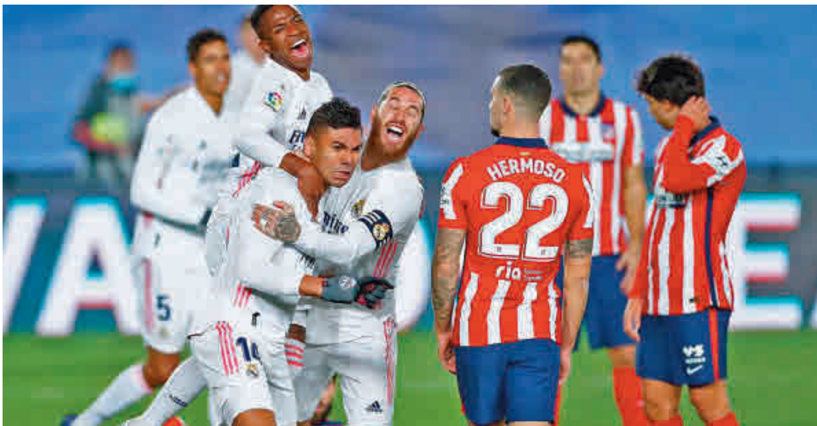
El antecedente de la ida fue favorable al Madrid, con Casemiro como autor del primer gol