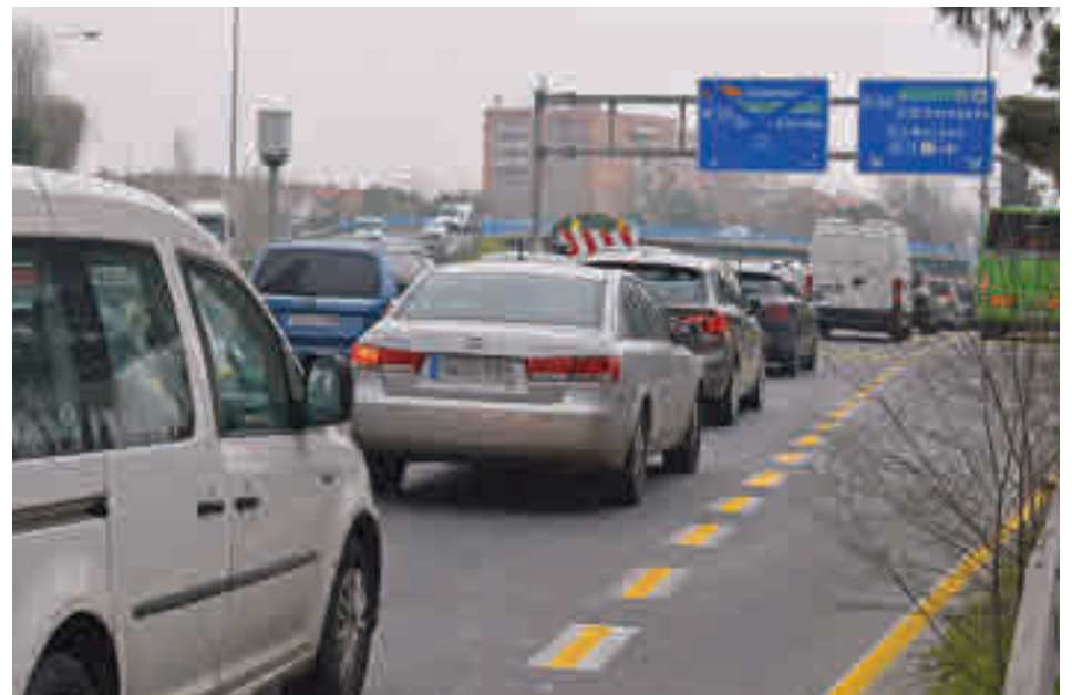
La zona afectada por los desvíos de tráfico

Según fuentes municipales, las rutas alternativas en dirección Colmenar hasta el 1 de febrero de 2022 son Paseo de la Castellana/avenida Monforte de Lemos/calle Ginzo de Limia/avenida de la Ilustración. Otra opción es Plaza de Castilla/avenida de Asturias/calle Ginzo de Limia/avenida de la Ilustración. Y una tercera, Sor Ángela de la Cruz/túnel Sor Ángela de la Cruz/calle de Valle de Mena/avenida de la Ilustración.