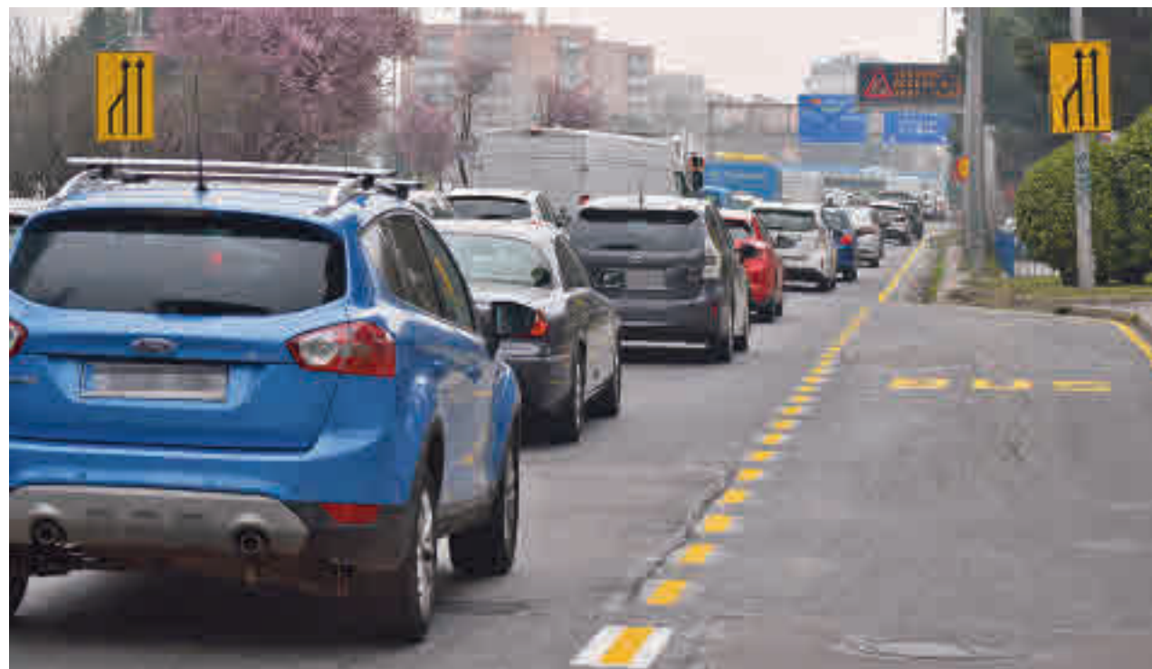
CHEMA MARTÍNEZ/ GENTE