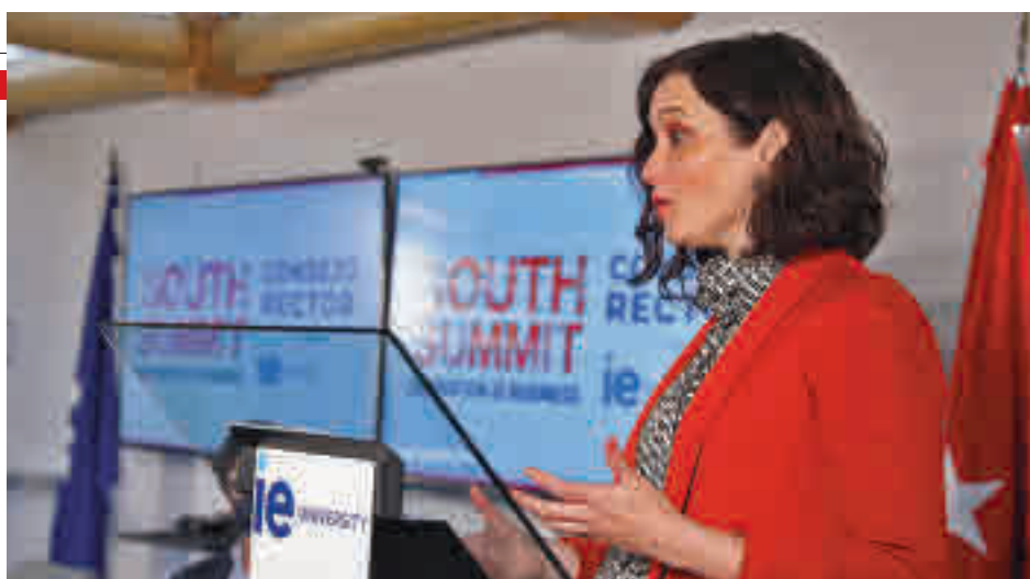
Isabel Díaz Ayuso, durante su intervención

La infraestructura, inaugurada por la presidenta regional, Isabel Díaz Ayuso, ha contado con una inversión de 1,5 millones de euros.