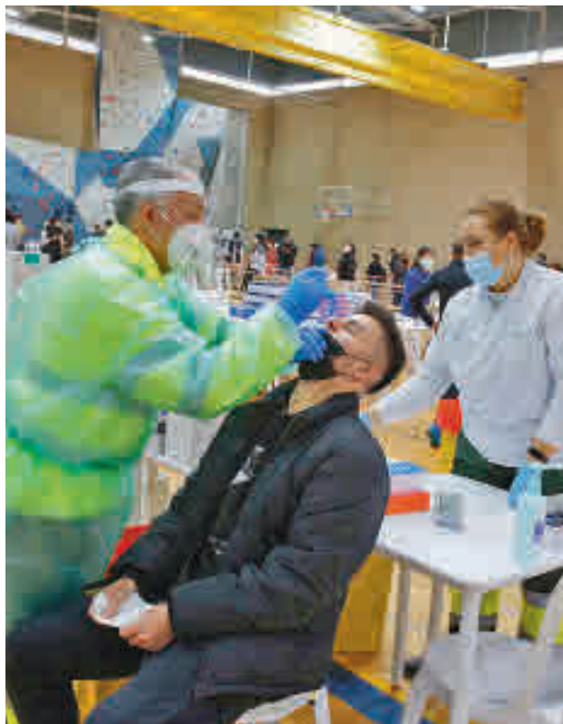
Los contagios siguen bajando en el Sur

En el informe publicado este martes 2 de marzo por la Consejería de Sanidad, Pinto es el municipio que presenta una incidencia más baja, con 173 positivos por cada 100.000 vecinos. Móstoles, con 183, es la otra ciudad que consigue