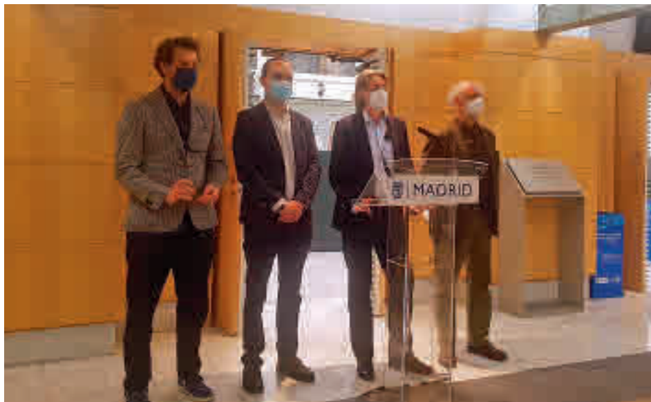
Un momento de la rueda de prensa, celebrada en Cibeles