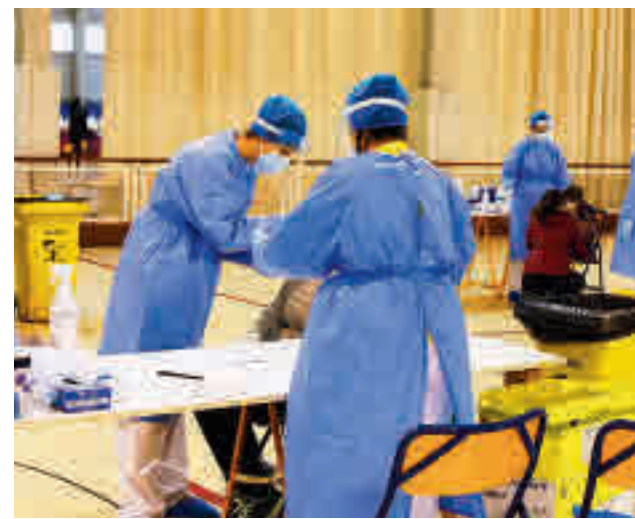
La incidencia sigue bajando en el Sur

Este viernes 5 de marzo Muerdo publica su quinto disco de estudio que lleva el nombre de 'La sangre del mundo'