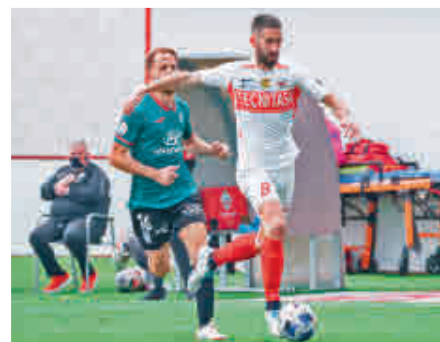
El club de Matapiñonera atraviesa un buen momento UD SANSE

En una situación similar está Las Rozas, que recibe este domingo en Navalcarbón al Atlético Baleares.