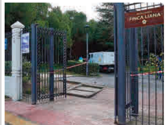
Parque de Finca Liana

Ecologistas en Acción de Valdemoro ha denunciado un vertido de centenares de kilos de amianto en una paraje natural de la localidad.