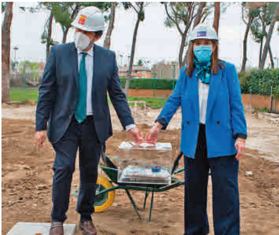
El simbólico acto de la primera piedra de la actuación