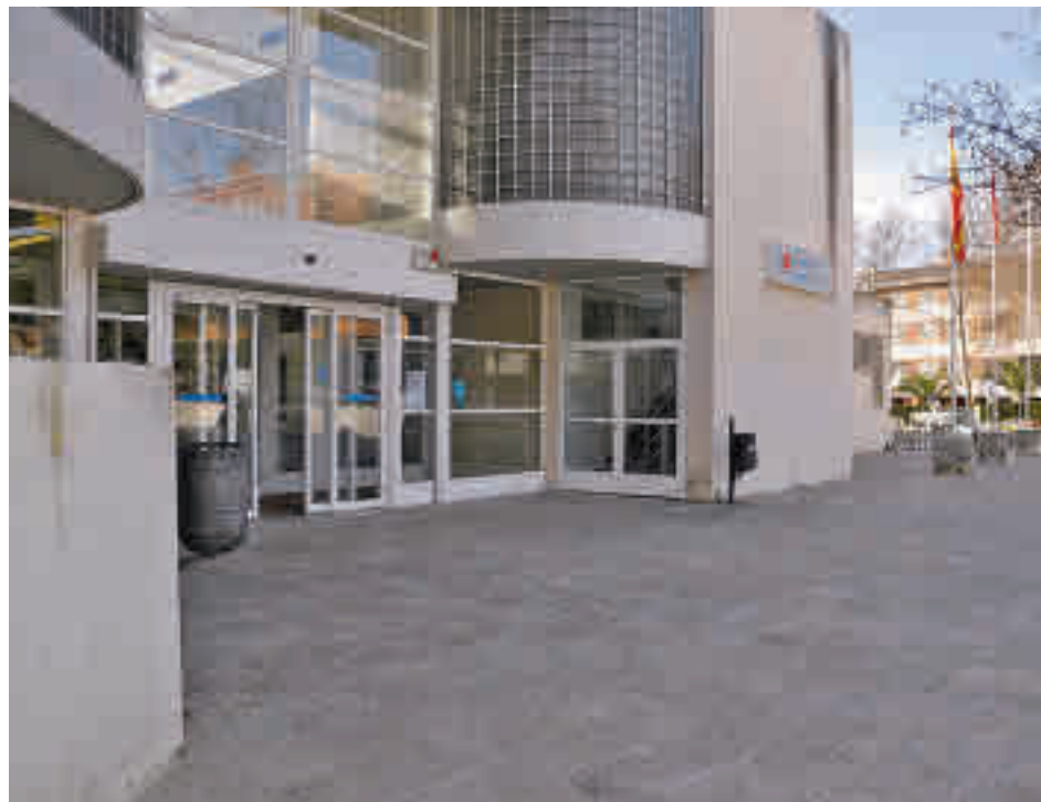
Centro de salud de Boadilla del Monte

El más llamativo es que, por primera vez en lo que llevamos de año, todas las grandes localidades están por debajo de los 400 casos por cada 100.000 habitantes en los últimos 14 días. La última en rebajar esa barrera ha sido Collado Villalba, que en el mapa que se puede consultar en la página web de la Comunidad de Madrid registra 397, lo que supone una bajada espectacular respecto a