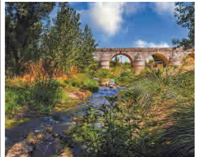
Una de las zonas verdes del municipio roceño

'Tree Cities of The World' cuenta con 120 ciudades y pueblos de 63 países.