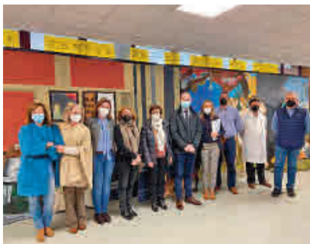
Foto de familia del alcalde con los docentes del instituto