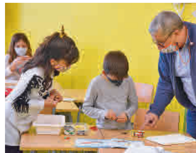
Uno de los centros participantes

Las solicitudes para participar en la segunda edición están abiertas hasta el día 19.