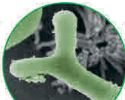
Ayuda eficaz con la bifidobacteria B. bifidum HI-MIMBb75

Efecto-Parche PRO El secreto de Kijimea Colon Irritable PRO: sus bifidobacterias especiales inactivadas térmicamente y con Efecto-Parche PRO. Las bifidobacterias se adhieren como un parche protector a las áreas dañadas de la pared intestinal. Así, esta puede recuperarse y está protegida contra nuevas irritaciones. De esta forma, pueden reducirse la diarrea, el dolor abdominal y la flatulencia.