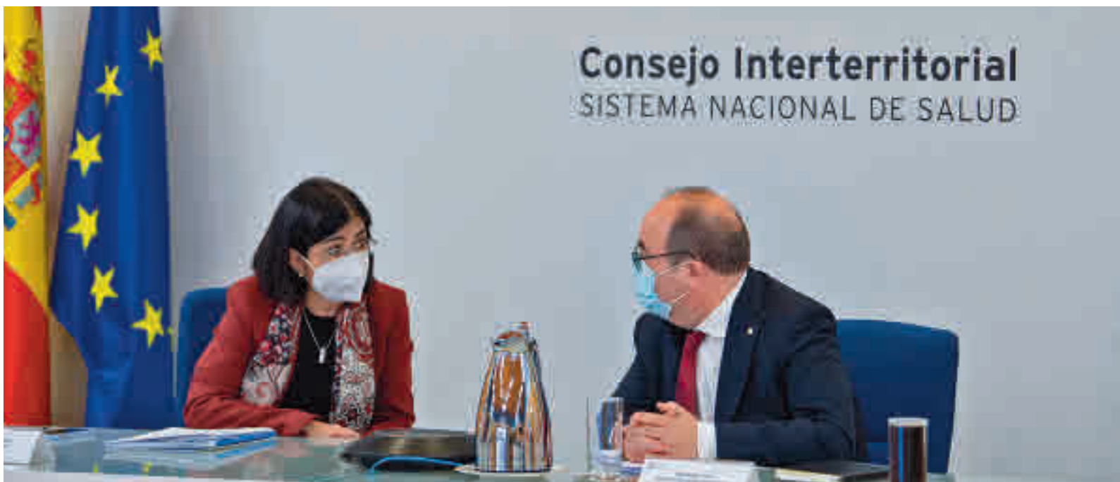
La ministra de Sanidad, Carolina Darias, junto con el titular de Administraciones Públicas, Miquel Iceta