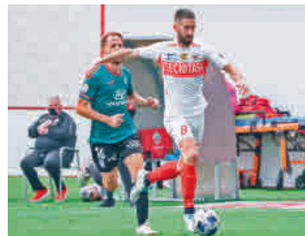
El club de Matapiñonera atraviesa un buen momento UD SANSE

En una situación similar está Las Rozas, que recibe este domingo en Navalcarbón al Atlético Baleares.