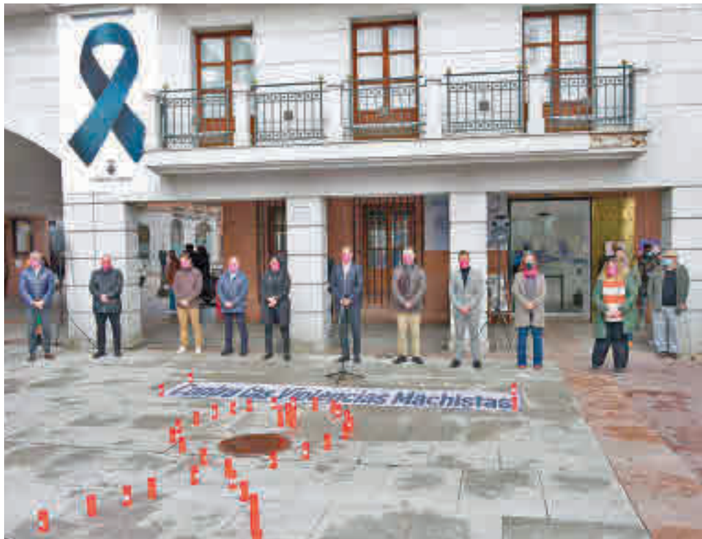
Minuto de silencio en el Ayuntamiento de Torrejón

Los hechos ocurrieron sobre las 10 de la mañana de este lu-