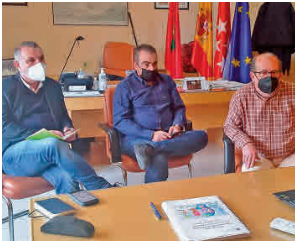
Parte del equipo de Gobierno durante la reunión telemática