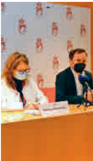
Rueda de prensa