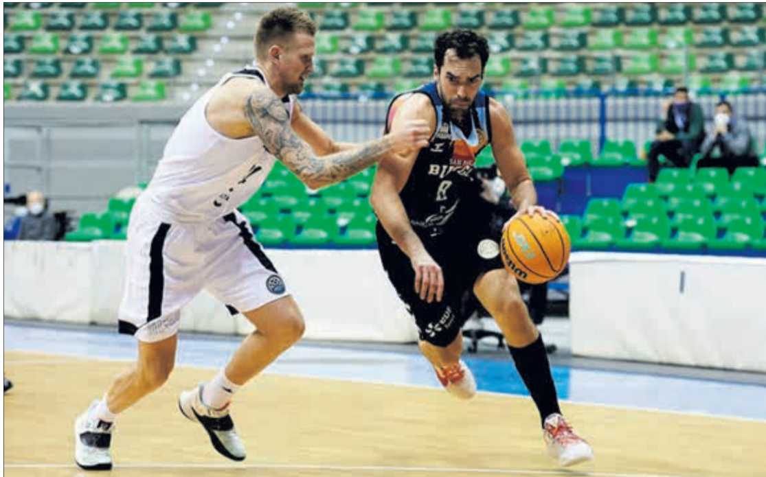
El Hereda San Pablo Burgos se impuso al VEF Riga (76-75) en su regreso a la competición europea.