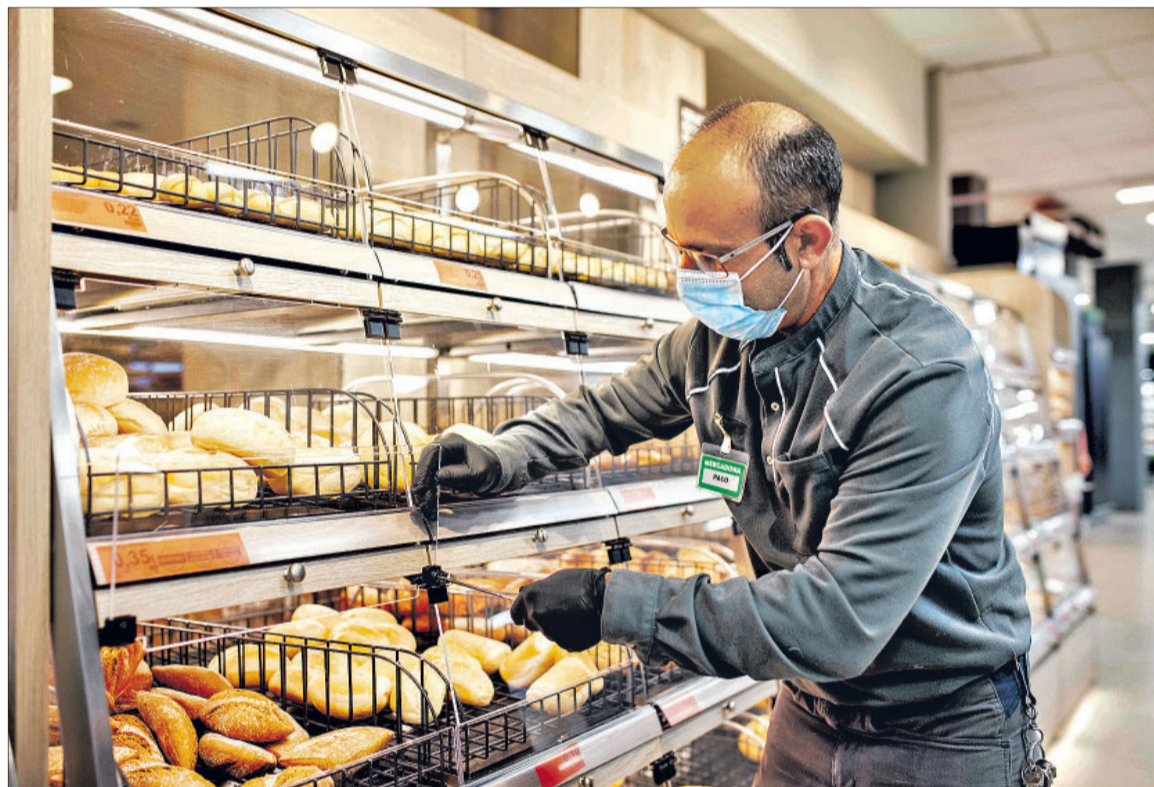
Trabajador de Mercadona en la sección de panadería.

La compañía destaca "el talento y el esfuerzo diario" de todos los trabajadores y trabajadoras, "un ejemplo para la sociedad"