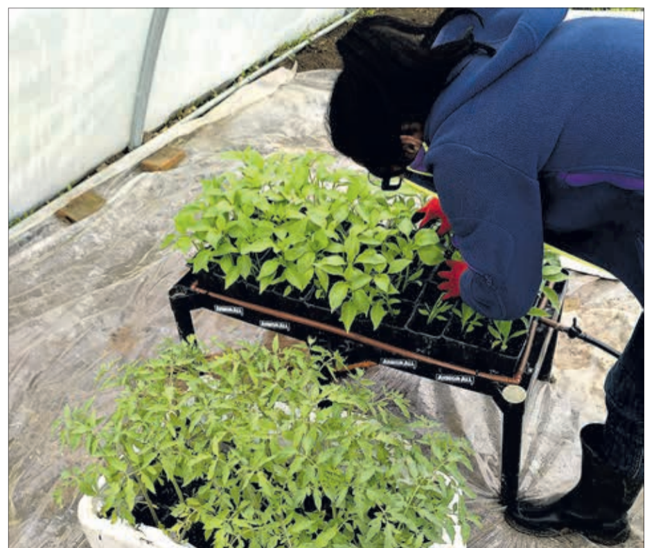
Trabajando con algunas de las especies del huerto, ubicado en Villanueva-Matamala, a quince minutos de la ciudad de Burgos.