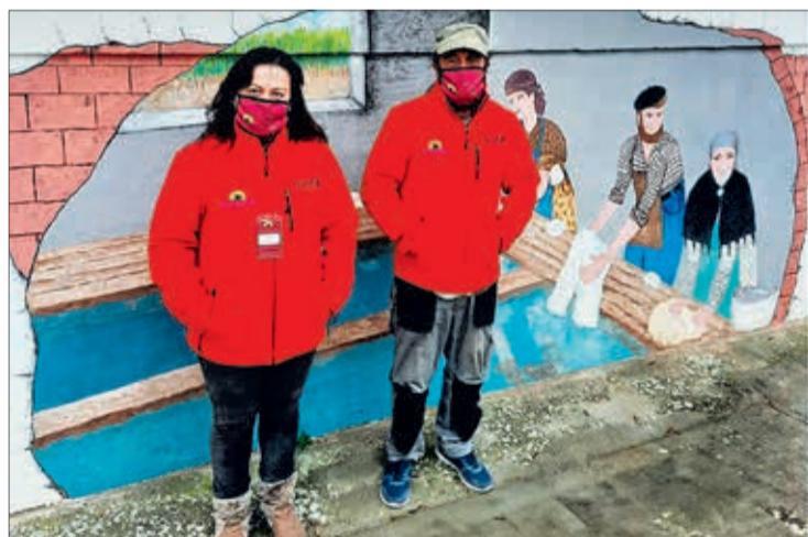
Un mural que pone en valor la tradicional labor de las lavanderas.

La finalidad de estos premios es apoyar todas aquellas iniciativas dirigidas al embellecimiento y conservación de los núcleos rurales y fomentar el espíritu de colaboración entre el vecindario y sus autoridades locales, en aras de la mejora de la calidad de vida y de la sostenibilidad de su pro-