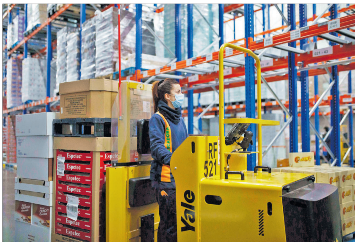
Trabajadora de Mercadona en el Bloque Logístico de Vitoria.