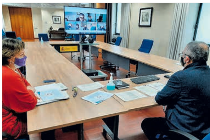
Reunión telemática para explicar el reparto de los fondos

PACTO DE ESTADO | Incremento superior a 150.000 euros