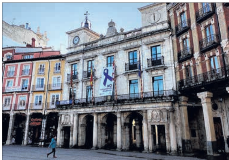
La aprobación inicial del Presupuesto del Ayuntamiento por el Pleno tendrá lugar en marzo.

De la Rosa resaltó que se trata de un presupuesto “tan ajustado” que se incrementa en 600.000 euros respecto al del año pasado y que “mantiene” los compromisos en materia de inversión “que teníamos que seguir afrontando en este año para generar y reactivar la economía, para proporcionar las infraestructuras y las dotacio-