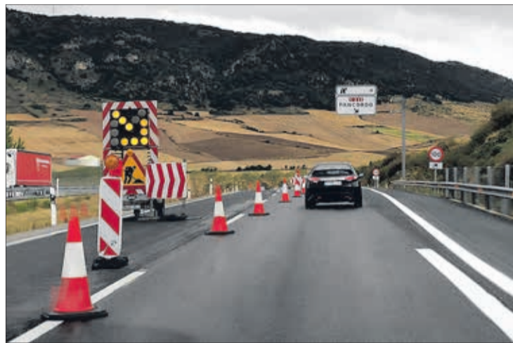
Imagen de archivo de la AP-1.

de alternativas comprendiendo tanto los enlaces existentes entre Burgos y Miranda de Ebro (Castañares, Rubena, Briviesca, Pancorbo, Ameyugo y Miranda), como la creación de nuevas conexiones, se valora conveniente la ejecución de dos nuevos enlaces y su conexión a la N-1, en