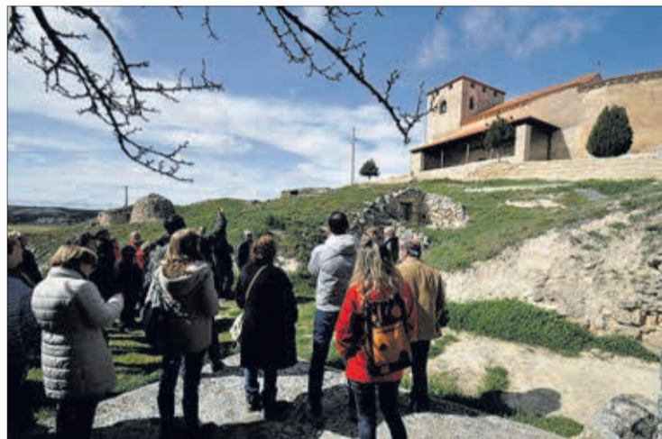
Un grupo conoce la historia de un recurso patrimonial de la Ribera del Duero.

"La conservación del patrimonio en el mundo rural comienza por mejorar su conocimiento en nuestros propios pueblos y pasa por su difusión al público en general. El concurso provincial es una buena excusa para juntarnos y compartir problemáticas comunes", señalan, para apuntar también que se trata de un "espacio de aprendizaje cooperativo" que refuerza las capacidades de los ayuntamientos, o simplemente un espacio de encuentro para conocer mejor el patrimonio cultural y natural de los pueblos de la comarca.