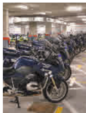
Las nuevas instalaciones

La infraestructura está compuesta de dos partes, una bajo rasante y otra al aire libre,