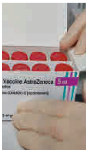
Vacuna de AstraZeneca