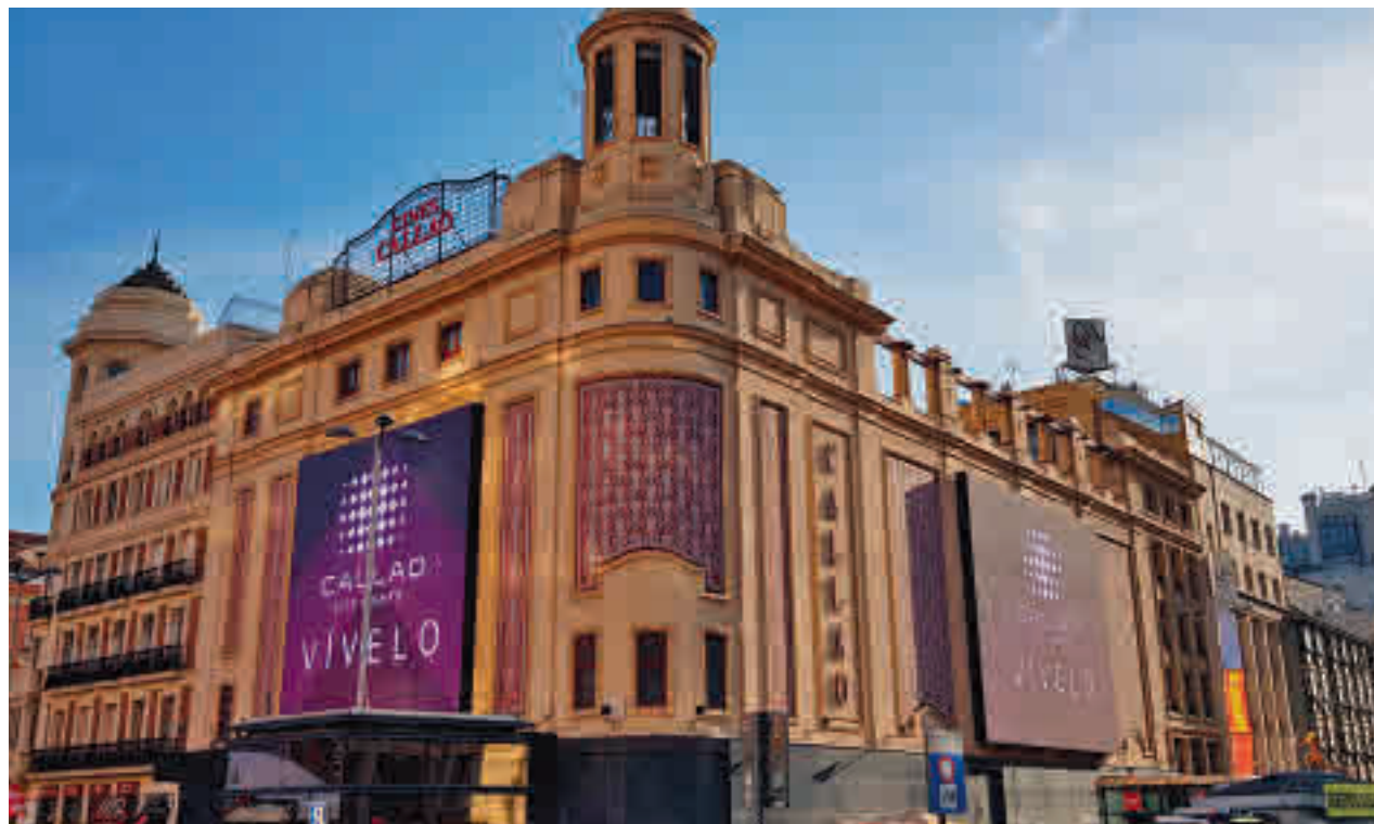
Las pantallas digitales instaladas en Callao

Toda la actualidad de los distritos de Madrid, en nuestra web