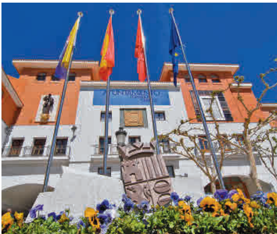
El Ayuntamiento de Torrejón de Ardoz