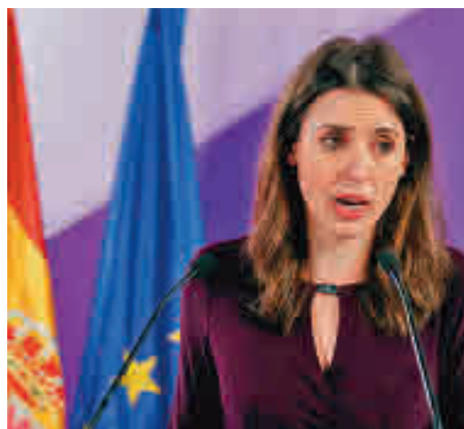
La ministra de Igualdad, Irene Montero

EL PERIÓDICO GENTE NO SE RESPONSABILIZA NI SE IDENTIFICA CON LAS OPINIONES QUE SUS LECTORES Y COLABORADORES EXPONGAN EN SUS CARTAS Y ARTÍCULOS