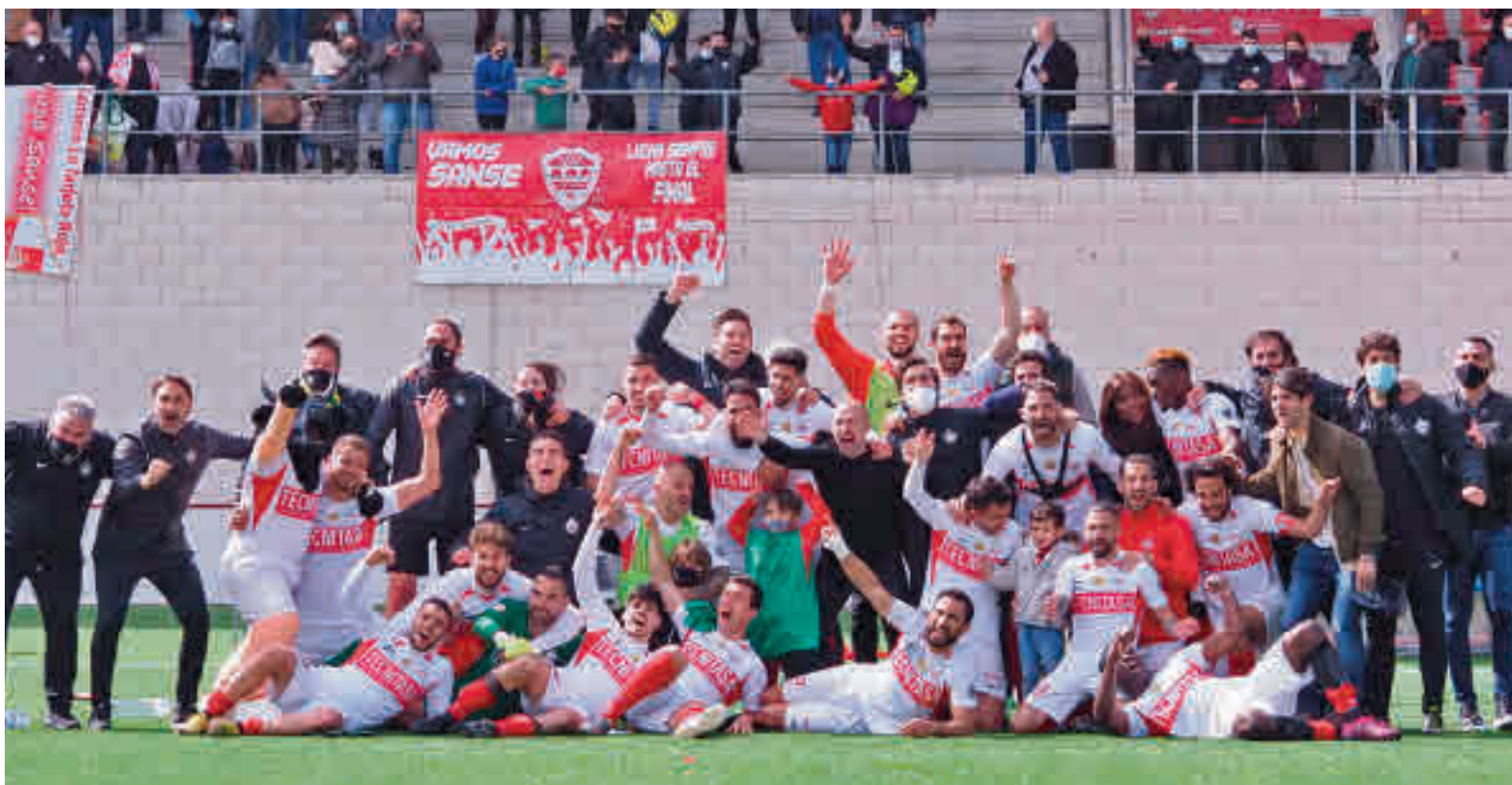
El Sanse celebró su presencia en la futura Primera RFEF sobre el césped de Matapiñonera