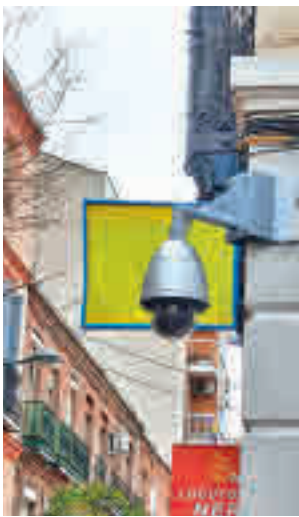
Uno de los dispositivos