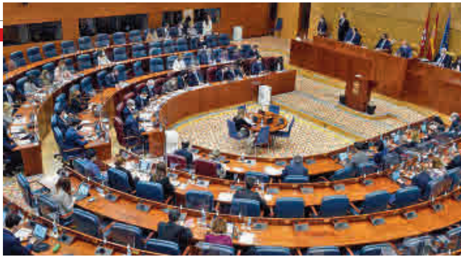
Asamblea de Madrid

Y por último, el gran lío de la izquierda. La ruptura de Íñigo Errejón con Pablo Iglesias dio lugar a dos listas (Más Madrid y Unidas Podemos), un proceso que parece muy difícil de revertir, aunque cier-