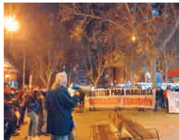
Un momento de la protesta MORATALAZ D-14