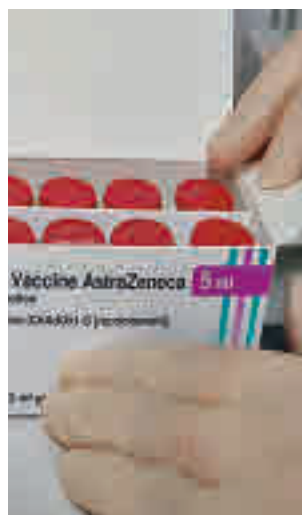
Vacuna de AstraZeneca