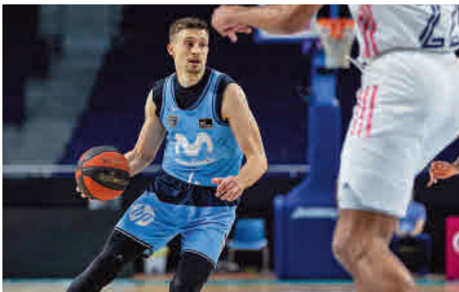
El Estudiantes afronta dos partidos seguidos en el WiZink Center