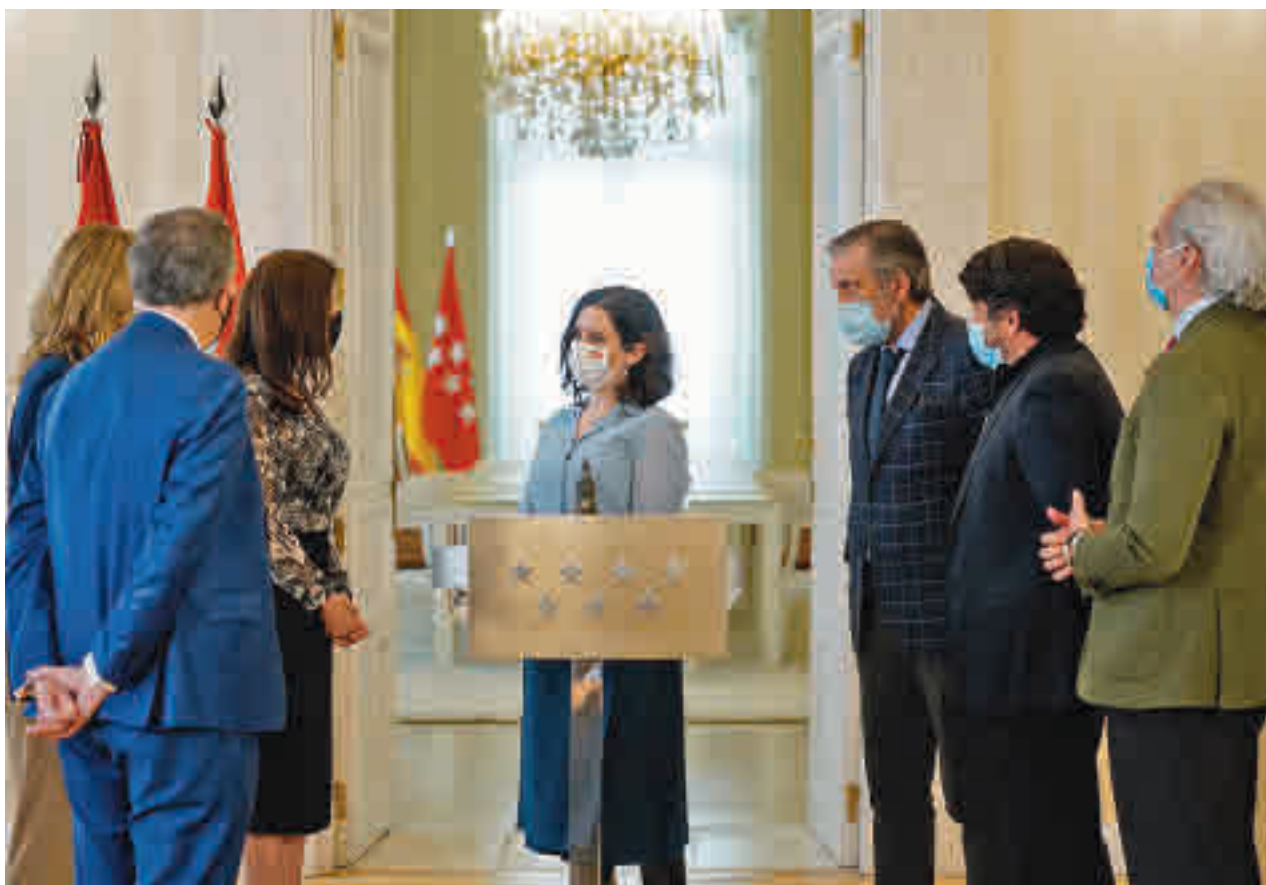
Ayuso compareció acompañada por los consejeros del Partido Popular