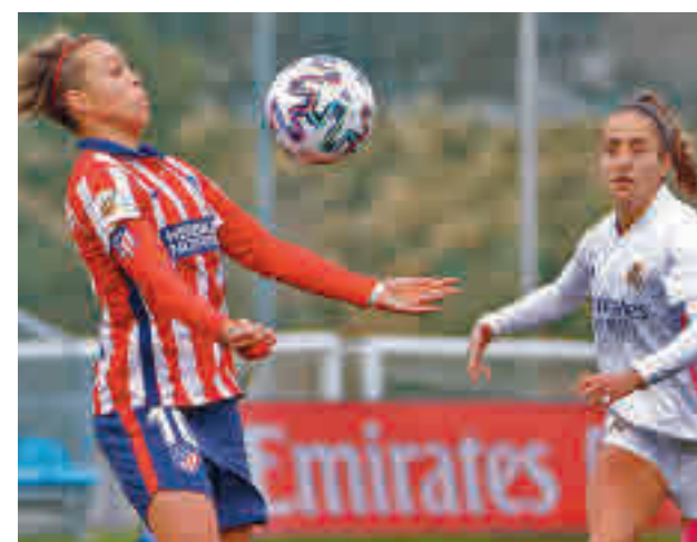
Imagen del partido de ida

Por su parte, el Madrid CFF, quinto en la tabla, recibirá al Eibar, mientras que el Rayo visitará al Deportivo.