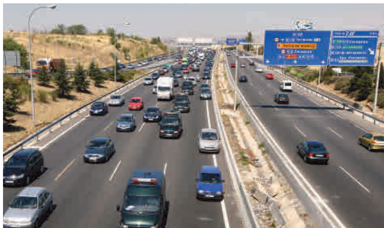
Madrid se niega a cerrarse perimetralmente de cara al puente y la Semana Santa

medidas son "de obligado cumplimiento" aunque se haya votado en contra. Están exentas Canarias y Baleares, y se da la circunstancia de que, aunque los españoles no puedan moverse por regiones distintas a la suya, sí que estará permitido que lleguen extranjeros de países con más incidencia siempre que traigan consigo una PCR con resultado negativo.