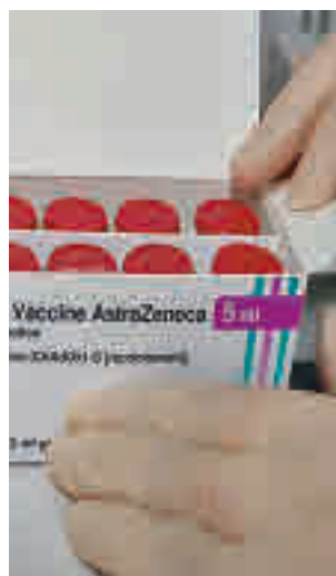
Vacuna de AstraZeneca