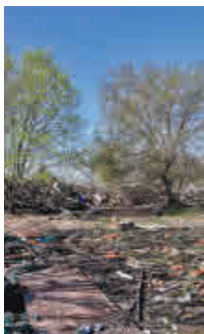
Estado actual de la zona

Mimbreras (Latina), desmantelado en 2012, para denunciar el abandono que sufre esta zona que formará parte en un futuro del proyecto municipal del Bosque Metropolitano. “Desde entonces, toda la zona está llena de restos