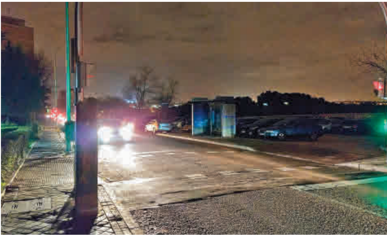
La carretera de Boadilla, a su paso por esta zona residencial del distrito de Latina