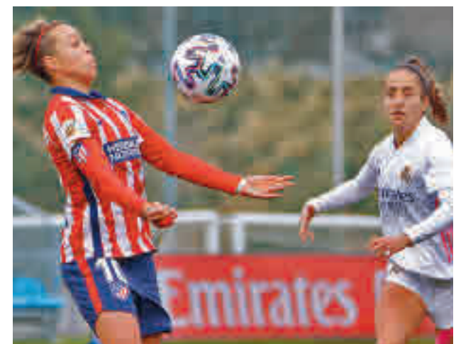
Imagen del partido de ida

Por su parte, el Madrid CFF, quinto en la tabla, recibirá al Eibar, mientras que el Rayo visitará al Deportivo.