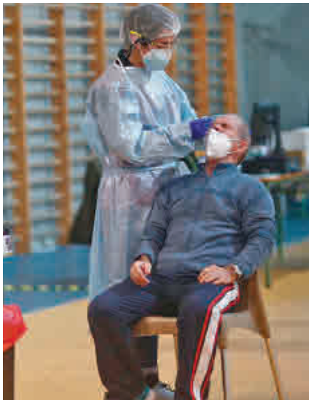
La incidencia sigue a la baja en el Sur

fuera del riesgo extremo por Covid-19, dado que se encuentra por debajo de los 250 contagios por cada 100.000 habitantes en los últimos 14 días. La única que supera esa barrera es Parla, que lo hace por muy poco, ya que registró 255. Casi todas ellas mejoran sus cifras con respecto a la semana anterior excepto Móstoles, que ha pasado de 183 a 198 casos por cada 100.000 vecinos.