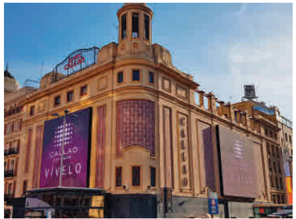
Las pantallas digitales instaladas en Callao

Una de las principales novedades será la regulación, por primera vez, del uso de pantallas digitales en establecimientos, una actividad cada vez más frecuente sobre la que no existe marco legal, y que puede resultar molesta