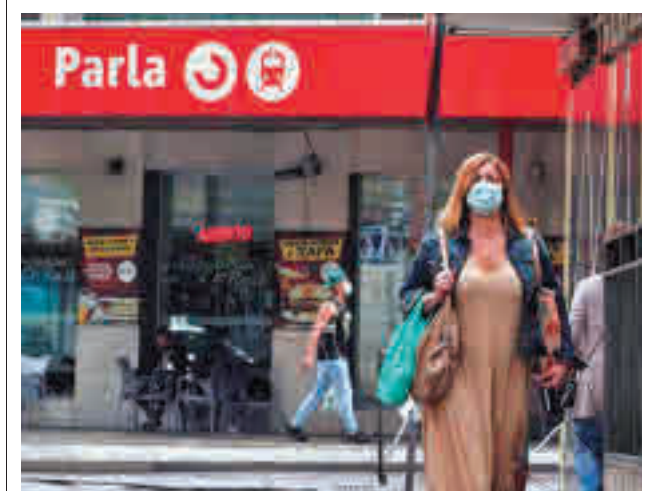
Estación de Cercanías de Parla GENTE

El Campeonato de España de Patinaje Artístico se celebrará del 19 al 21 de marzo en la Pista de Hielo Francisco Fernández Ochoa de Valdemoro.