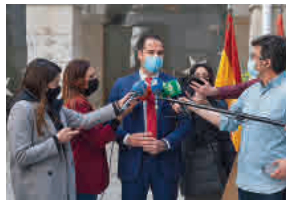
Aguado compareció ante los medios

planeando una moción junto al PSOE para desbancar a la presidenta popular. "Si hubiéramos querido hacer una moción, la habríamos impulsado", indicó el dirigente naranja, que señaló que "por un capricho personal y electoral, se-