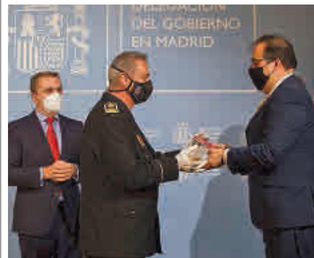
Acto de entrega de la condecoración

Por otro lado, el partido independiente Unión por Leganés (ULEG) ha decidido conceder sus Premios al Independiente del Año a los servicios esenciales que se activaron durante los momentos más duros de la pandemia del coronavirus y a los leganenses en general. “ULEG ha querido homenajar y premiar a los colectivos que han sufrido y luchado contra el coronavirus con tres galardones”, han señalado sus promotores, tras admitir que la Covid-19 “ha condicionado nuestras vidas en 2020 y 2021”, señalaron los responsables de la formación política, que en esta ocasión no han podido organizar un acto de entrega por las restricciones sanitarias.