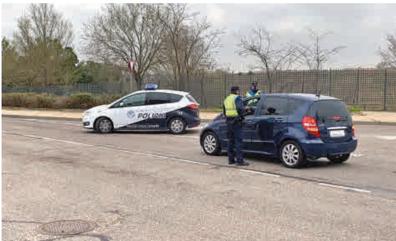
Controles en la Zona Básica de Salud de Marie Curie

La Zona Básica de Salud de Marie Curie, que se corresponde de manera casi íntegra con La Fortuna, registró en los últimos catorce días 236 casos confirmados de Covid-19 por cada 100.000 habitantes, muy por debajo de los 481 de la semana pasada y de los 512 del pasado 23 de febrero, momento en el que se decidió un cierre perimetral