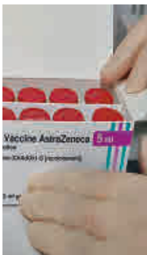
Vacuna de AstraZeneca