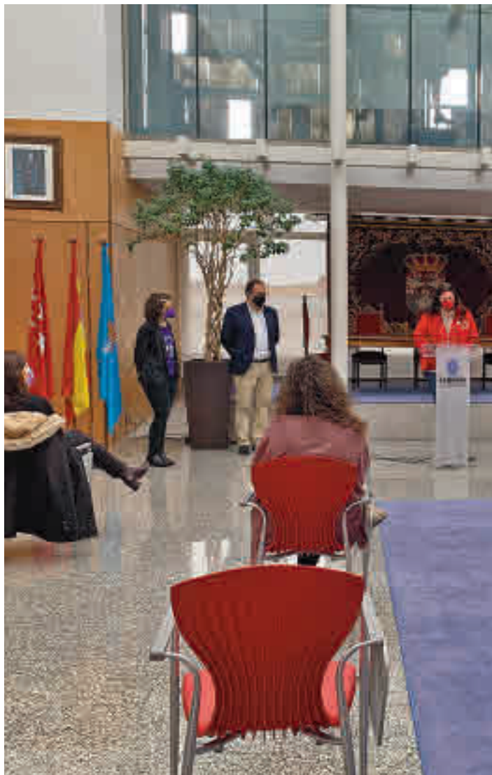
Acto de conmemoración del 8 de marzo en Leganés

DOS MUJERES DEL CONSEJO SECTORIAL LEYERON UN TEXTO