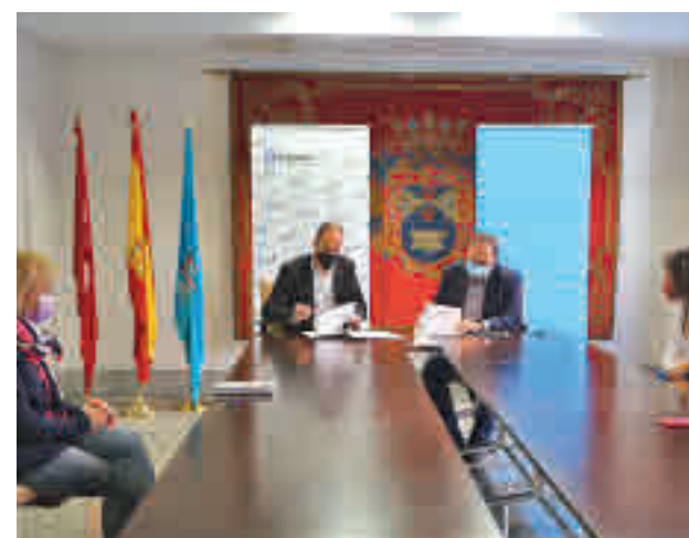
Firma del convenio

Gracias a este proyecto el Ayuntamiento de Leganés apoyará a las familias que acogen menores en situación de vulnerabilidad. En total, 36 familias acogedoras de nuestra ciudad contarán a partir de ahora con este servicio de acompañamiento con los objetivos de mejorar las relaciones de los meno-