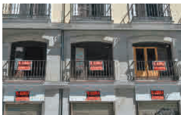
Una vivienda en alquiler en la ciudad

pone una reducción del 0,8% en comparación con enero, según los datos del Índice Inmobiliario Fotocasa. En lo que respecta a la capital, la bajada se cifró en el 1%, situándose el valor del metro cuadrado mensual en 14,88 euros. Los arrendamientos se depreciaron en 16 de los 20