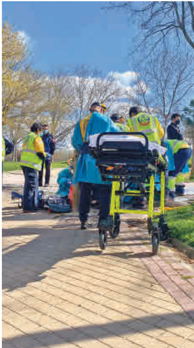
Un momento de la atención médica

El conductor del patinete eléctrico podría enfrentarse a un delito de homicidio involuntario y a otro de omisión