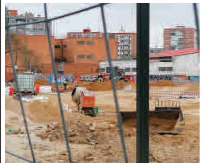
Las obras de construcción del estacionamiento disuasorio

Toda la actualidad de los distritos de Madrid, en nuestra web