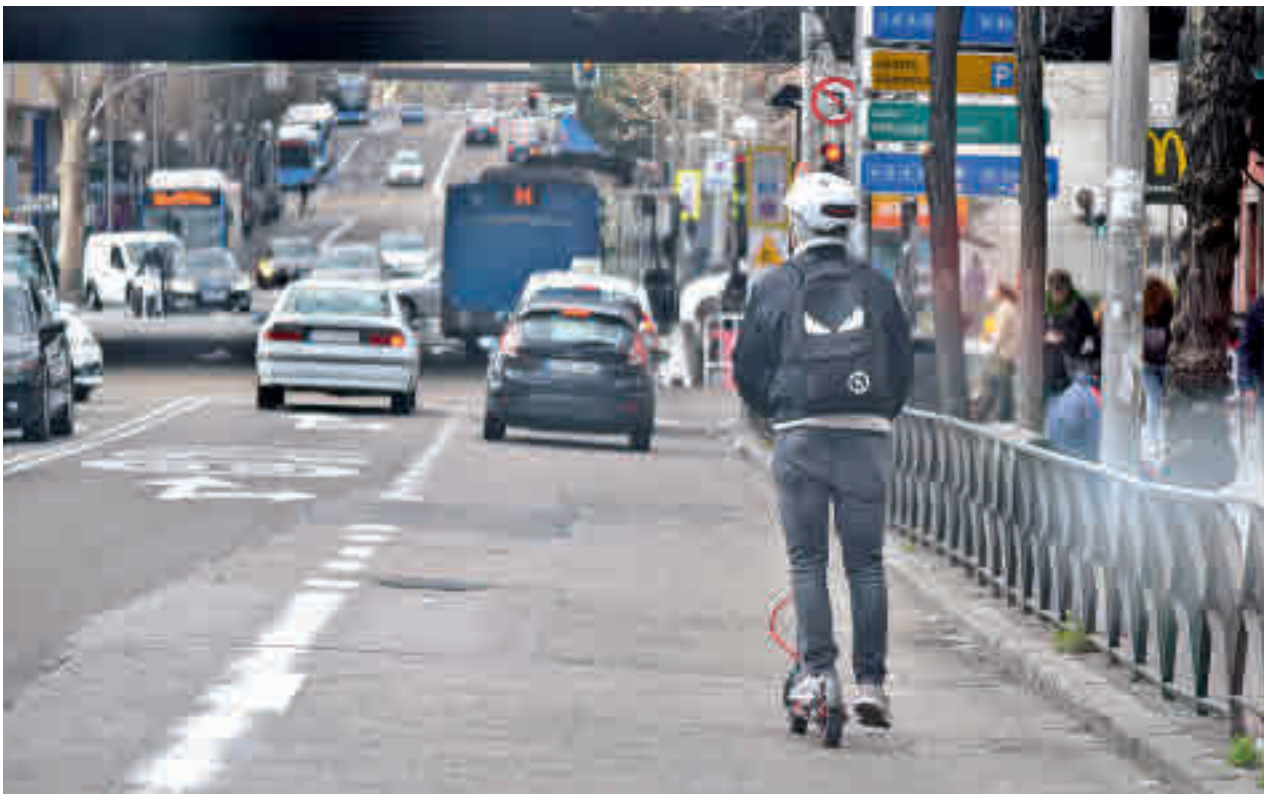
Un patinete circula por un carril bus en una calle de la capital