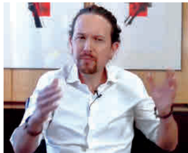
Pablo Iglesias, durante su anuncio