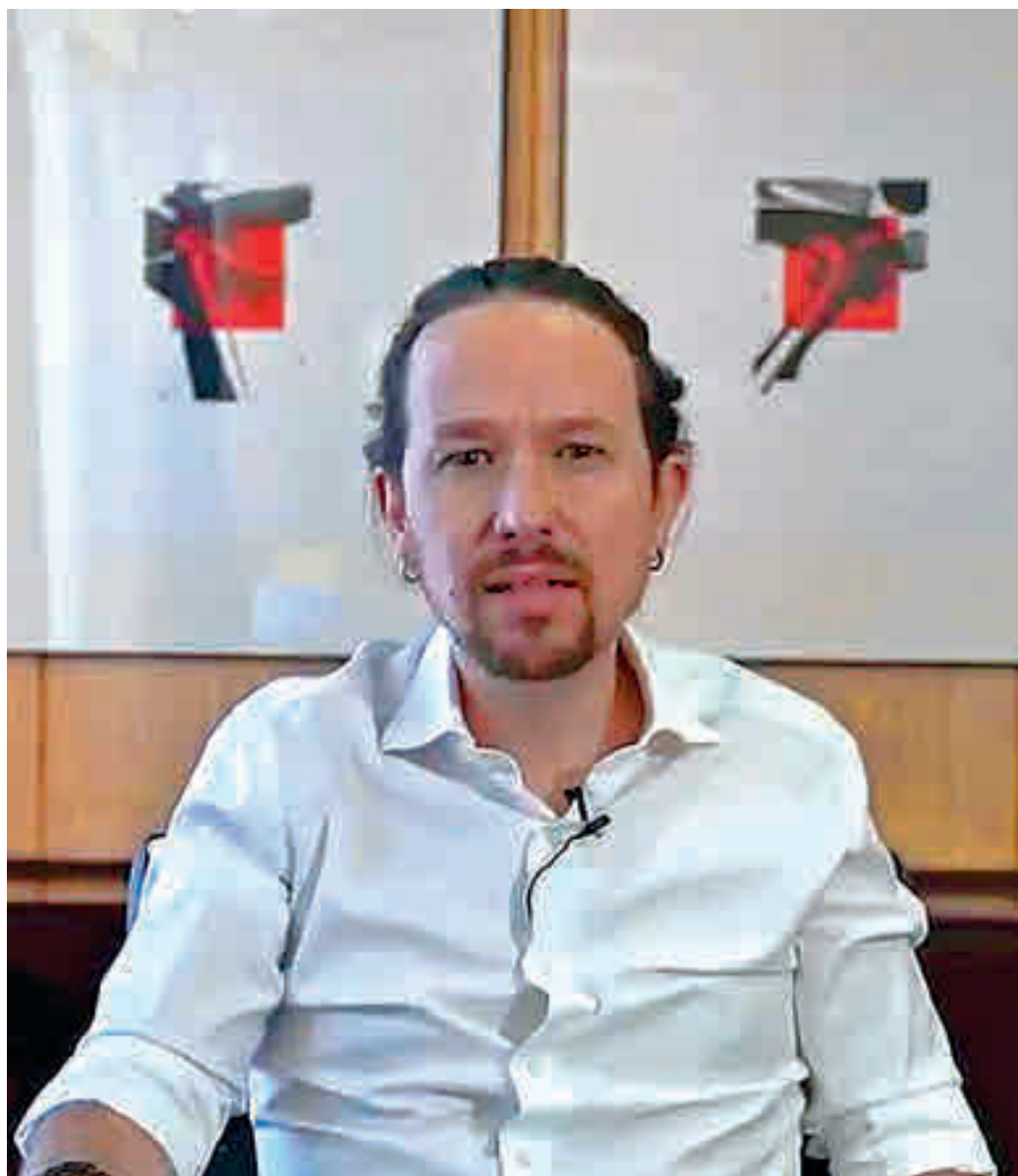
Pablo Iglesias será el candidato de Unidas Podemos en la Comunidad de Madrid

Precisamente los socialistas confirmaron el pasado fin de semana, antes de la irrupción