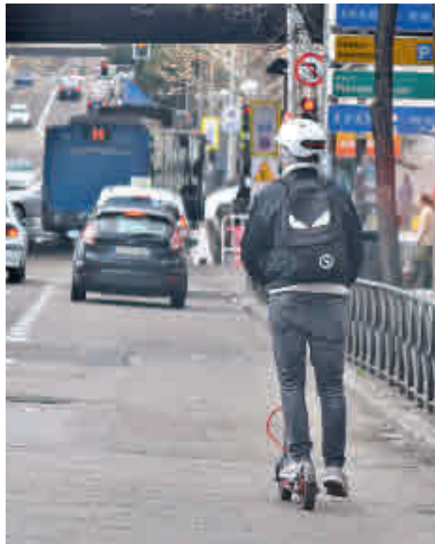
Un patinete circula por un carril bus

Según fuentes municipales, las sanciones van desde los 30 euros, las más leves, hasta los 200 euros de las más graves. Todas ellas se documentan con tres fotografías