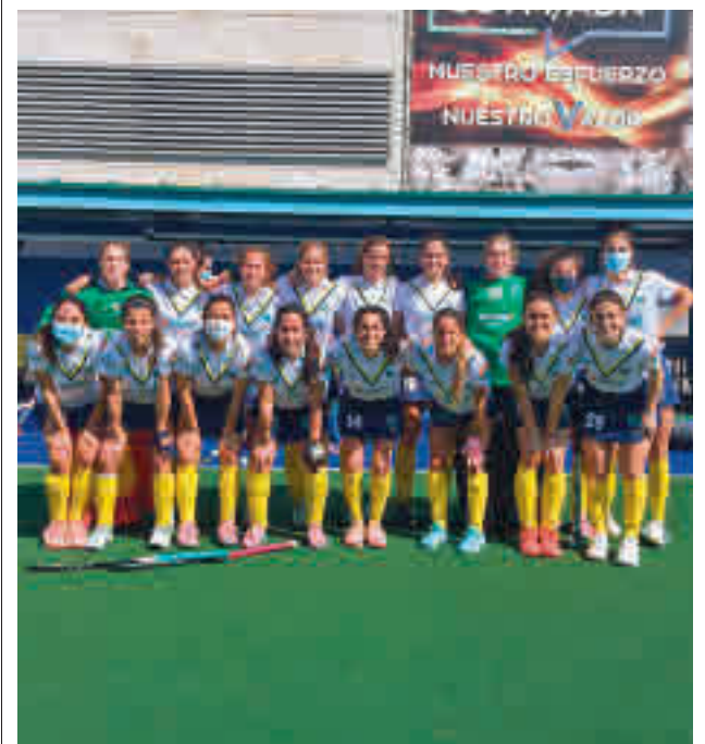
El equipo femenino, líder destacado RFEH

La delegación madrileña firmó una gran actuación en el Campeonato de España sub-18 de pista cubierta de Barcelona al finalizar segunda en el medallero y en la clasificación por puntos tras Cataluña.