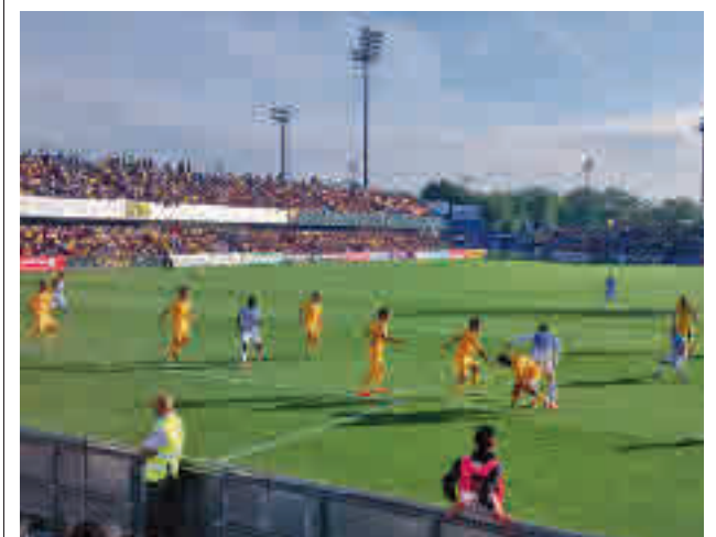
Estadio de Santo Domingo

La Policía Local de Valdemoro detuvo a un individuo mientras intentaba robar cable de un transformador eléctrico ubicado en una obra.