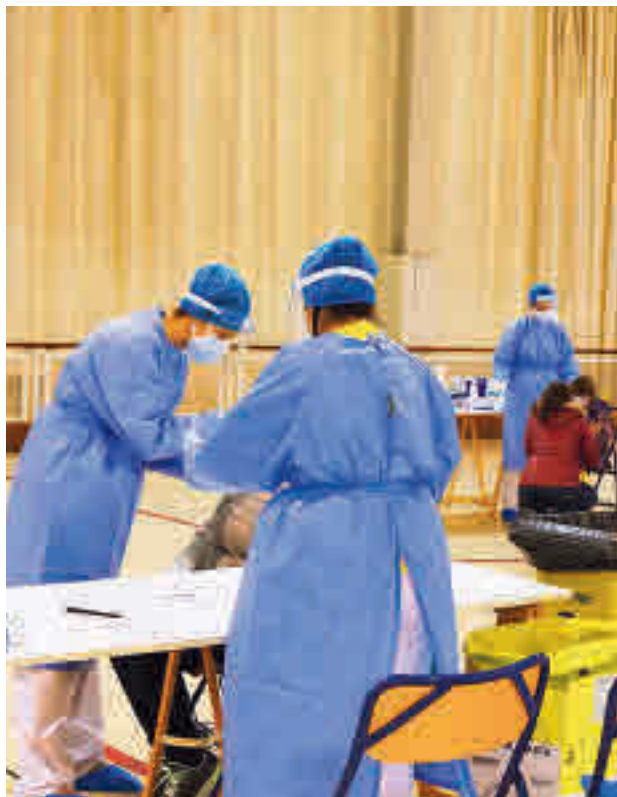
La incidencia baja lentamente en la zona Sur

En concreto, Móstoles ha registrado 204 contagios por cada 100.000 habitantes en los últimos 14 días (198 el pasado día 9), mientras que Alcorcón ha subido hasta los