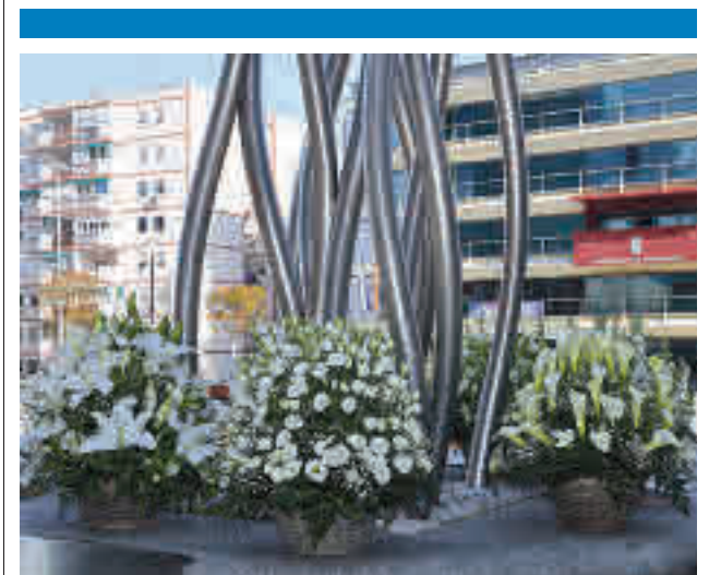
Acto de homenaje de este año

Este año se pone en marcha 'Fuentables' que, con un presupuesto cercano al millón de euros, permitirá que los centros escolares compren tablets y material informático.