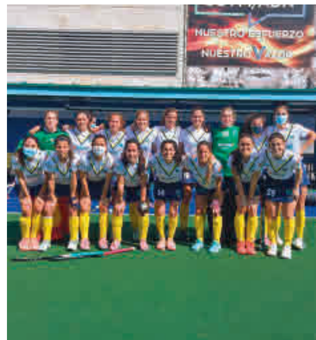
El equipo femenino, líder destacado RFEH

La delegación madrileña firmó una gran actuación en el Campeonato de España sub-18 de pista cubierta de Barcelona al finalizar segunda en el medallero y en la clasificación por puntos tras Cataluña.