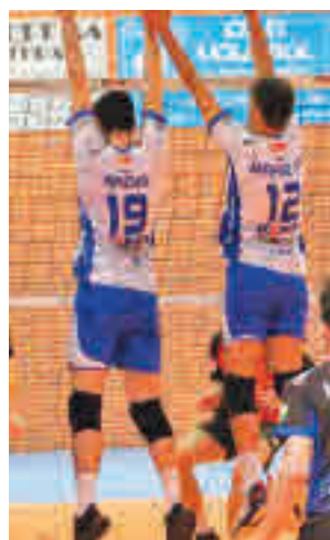
Obligados a vencer

la Superliga Masculina de voleibol, algo que en esta ocasión no dependerá de sí mismo. Los leganenses, terceros, están obligados a superar al