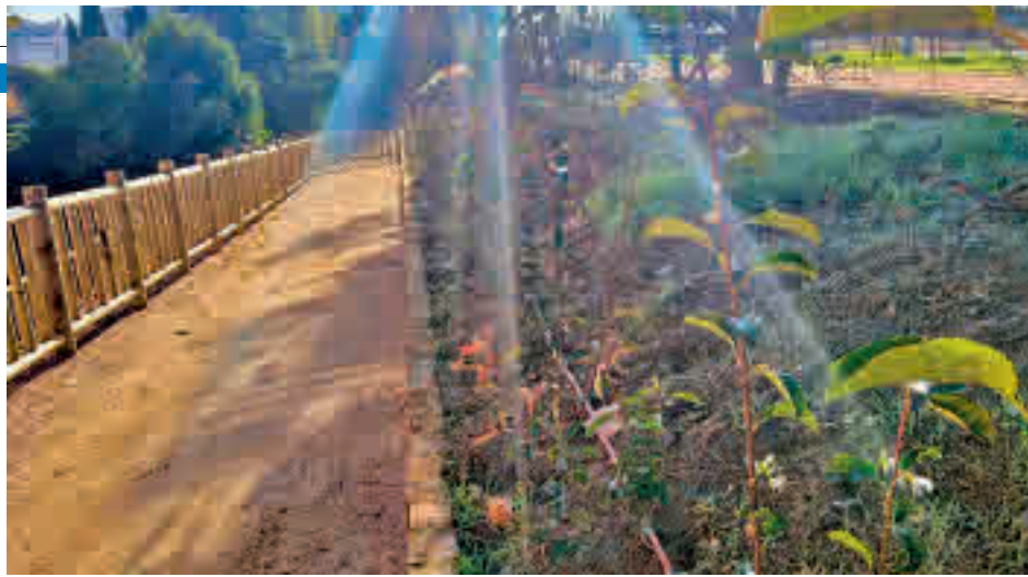
El Parque Lineal, nuevo emplazamiento verde que discurre paralelo a la carretera de Mejorada

“En próximos días vamos a organizar un pequeño acto institucional para ‘bautizar’ este espacio, y continuaremos con nuevas iniciativas