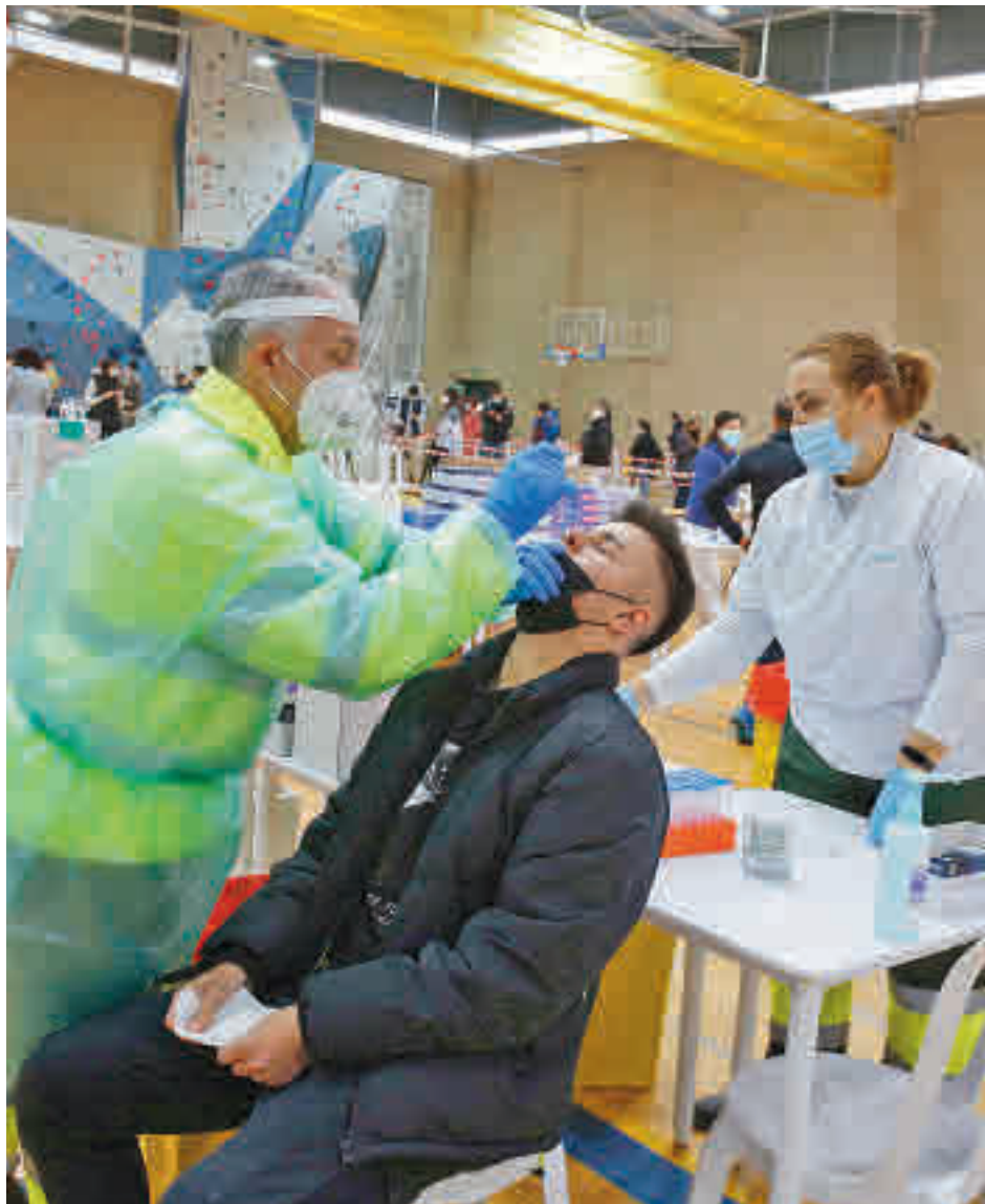
Los casos se estabilizan en el Noroeste

La gran novedad con respecto a los últimos días es la decisión del Gobierno regional de levantar el cierre perimetral que pesaba sobre Collado Villalba desde principios del mes de enero. Con una incidencia acumulada de 290 positivos por cada 100.000 habitantes en los últimos días, la entrada y la sa-