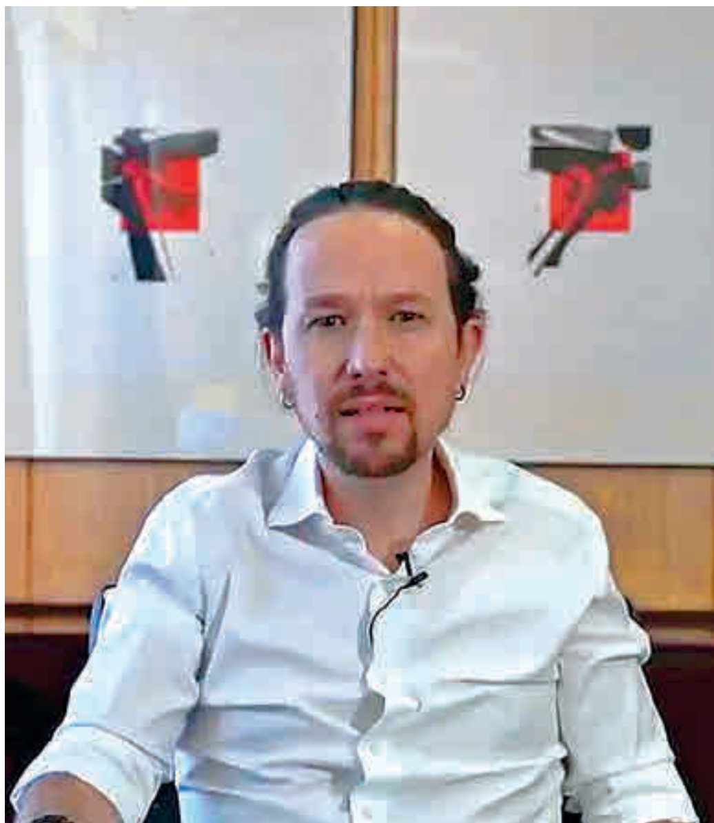
Pablo Iglesias será el candidato de Unidas Podemos en la Comunidad de Madrid

Precisamente los socialistas confirmaron el pasado fin de semana, antes de la irrupción