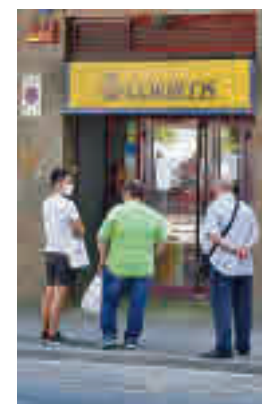
Oficina de Correos

El interesado debe acreditar su personalidad mediante firma electrónica y aceptando-