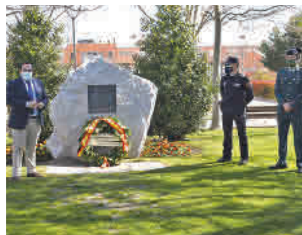
Acto de homenaje a las víctimas del 11-M

En su intervención, el regidor recordó a las 192 personas asesinadas el 11-M de hace 17