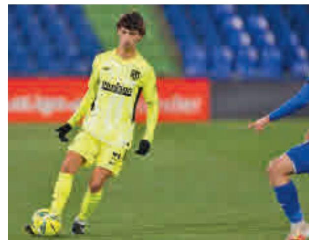
Joao Félix, jugador del Atlético de Madrid LALIGA

En lo que respecta al Real Madrid, a seis puntos del líder, deberá afrontar un compromiso complicado ante el Celta en Balaídos. Territorio inexpugnable para ellos a finales de los noventa, no pierden sin embargo allí desde el 2014.