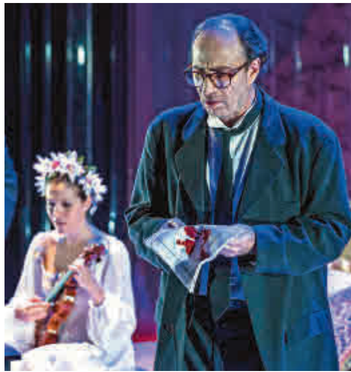
'Los hermanos Machado' reestrena el Tomás y Valiente

La adquisición de los boletos se realizará exclusivamente de forma online a través de la página del Ayuntamiento de Fuenlabrada (Ayto-fuenlabrada.es). Se podrá comprar un máximo de seis En el caso de la programación dirigida a los adultos, la ubicación de los espectadores se realizará en asientos alter-