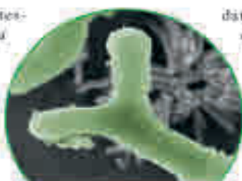
Ayuda eficaz con la bifidobacteria B. bifidum HI-MIMBb75

Nuestro intestino es una verdadera maravilla: en una longitud de unos seis metros, descompone los alimentos en compuestos vita-