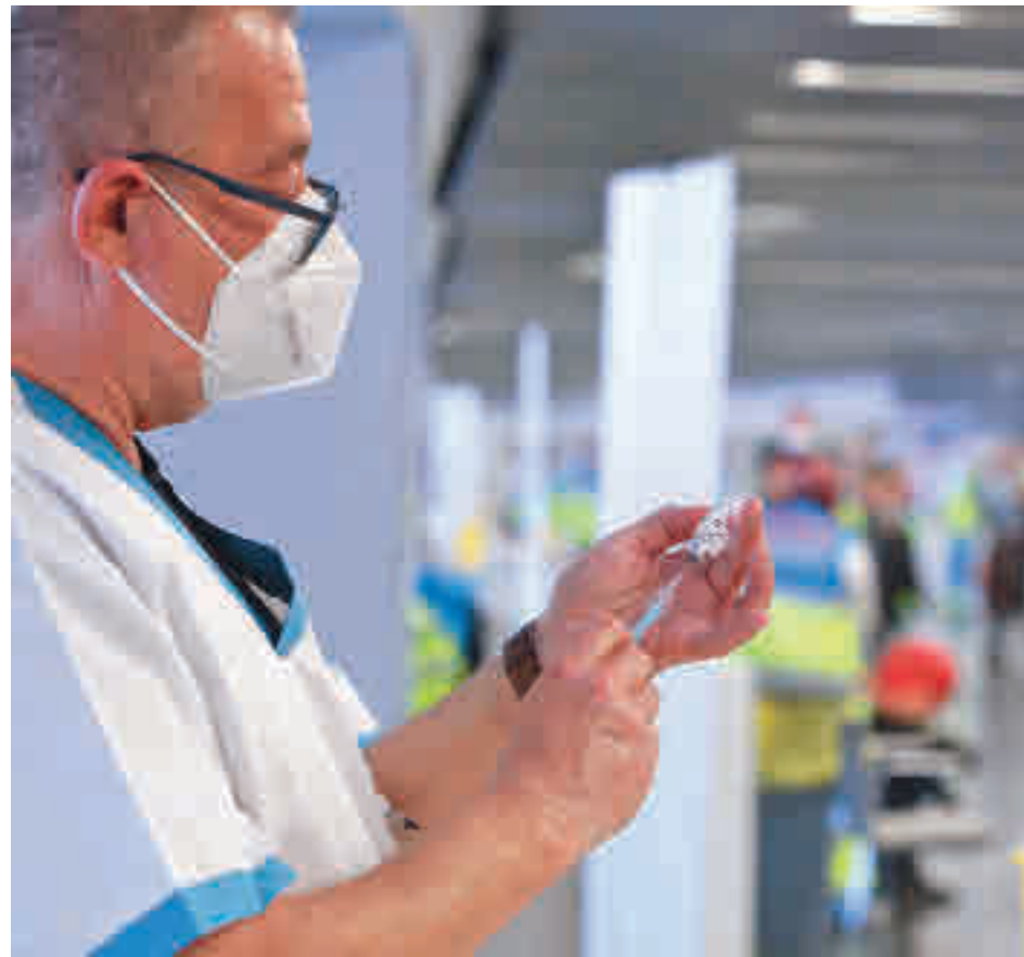
Personal sanitario administrando la vacuna de AstraZeneca

El Ministerio de Sanidad ordena que se deje de aplicar durante 15 días debido a los casos de trombosis que se han registrado entre algunos de los que la han recibido • La Agencia Europea del Medicamento se pronunciará este jueves 18