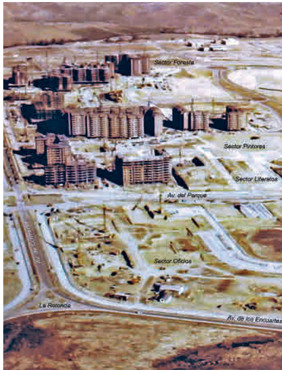
Imagen histórica de Tres Cantos

La idea original fue haber consolidado un modelo de ciudad en torno a la industria editorial. Se hablaba de la ciudad de las industrias gráficas o del libro. Paradójicamente, 30 años más tarde, esta idea,