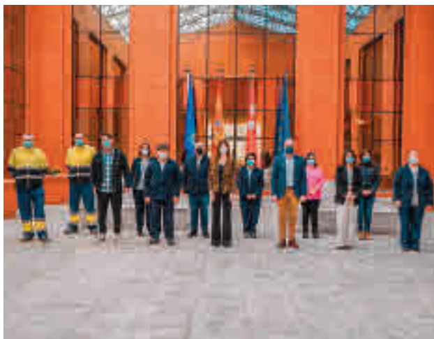
Parte del equipo de Gobierno con los trabajadores

Ahora se abre un plazo de 40 días para la recogida de solicitudes. Desde el Ayuntamiento esperan que este nuevo servicio entre en funcionamiento "durante el último trimestre" de este mismo año 2021.