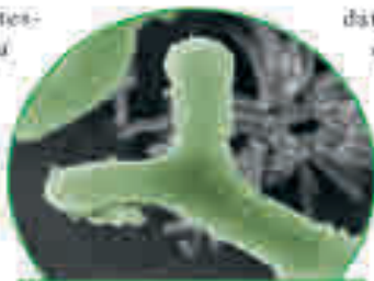
Ayuda eficaz con la bifidobacteria B. bifidum HI-MIMBb75

Nuestro intestino es una verdadera maravilla: en una longitud de unos seis metros, descompone los alimentos en compuestos vita-