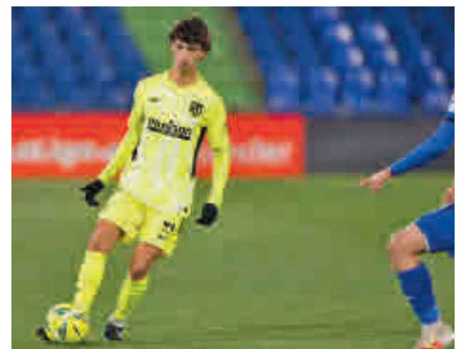
Joao Félix, jugador del Atlético de Madrid

En lo que respecta al Real Madrid, a seis puntos del líder, deberá afrontar un compromiso complicado ante el Celta en Balaídos. Territorio inexpugnable para ellos a finales de los noventa, no pierden sin embargo allí desde el 2014.