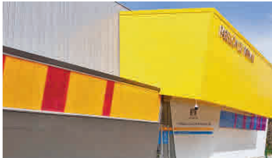
Imagen del renovado Pabellón Laura Oter

no de la remozada instalación del Pabellón Laura Oter. "Vamos a por la quinta Copa, a ver si lo podemos lograr en casa, encima en un pabellón nuevo, que el Ayuntamiento ha hecho una gran inversión. Hay que estrenarlo bien", desea