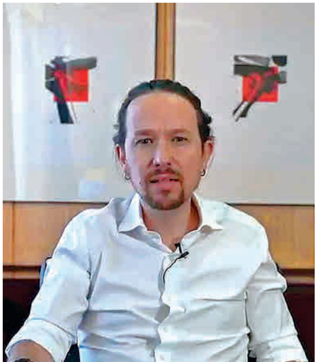
Pablo Iglesias será el candidato de Unidas Podemos en la Comunidad de Madrid

Precisamente los socialistas confirmaron el pasado fin de semana, antes de la irrupción