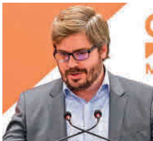
Fran Hervías, de Cs al PP

EL PERIÓDICO GENTE NO SE RESPONSABILIZA NI SE IDENTIFICA CON LAS OPINIONES QUE SUS LECTORES Y COLABORADORES EXPONGAN EN SUS CARTAS Y ARTÍCULOS