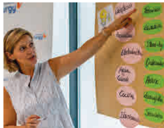
Formadora de la Escuela de Energía FUNDACIÓN NATURGY

"En este acompañamiento juegan un papel fundamental nuestros voluntarios energéticos, pero desde la Escuela de Energía hemos querido dar un paso más con la implementación de este servicio", explica María Eugenia Coronado, directora general de Fundación Naturgy. "De esta manera, maximizamos la aplicación de las recomendaciones de eficiencia y ahorro, detectamos posibles incidencias en las gestiones con sus compañías suministra-