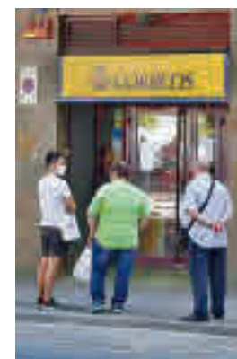
Oficina de Correos

El interesado debe acreditar su personalidad mediante firma electrónica y aceptando-