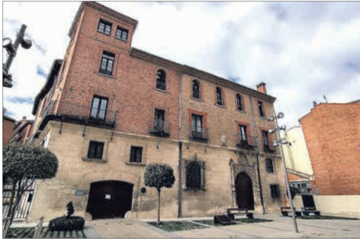
Imagen del Palacio de Castilfalé, donde se ubica el Archivo Municipal.

Además, manifestó que ICOMOS ha aceptado la invitación