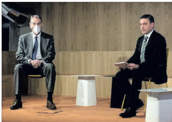
La presentación tuvo lugar en el nuevo edificio de la Fundación, el jueves 18.

Desde su puesta en marcha en 2016, indicó Barbero, la Fundación ha ayudado a 17 organizaciones a través de este programa y, actualmente, son tres las empresas que están recibiendo apoyo.