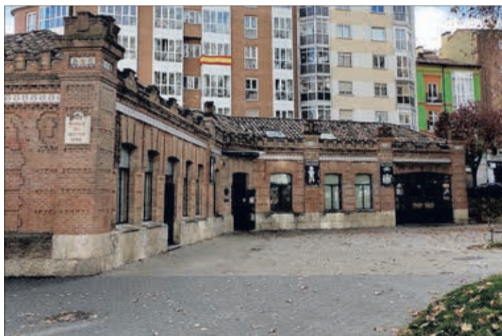
Imagen de la fachada de la Oficina Municipal de Información al Consumidor.

Por otra parte, el número de reclamaciones creció un 49 %, pasando de 1.950 a 2.907. Del