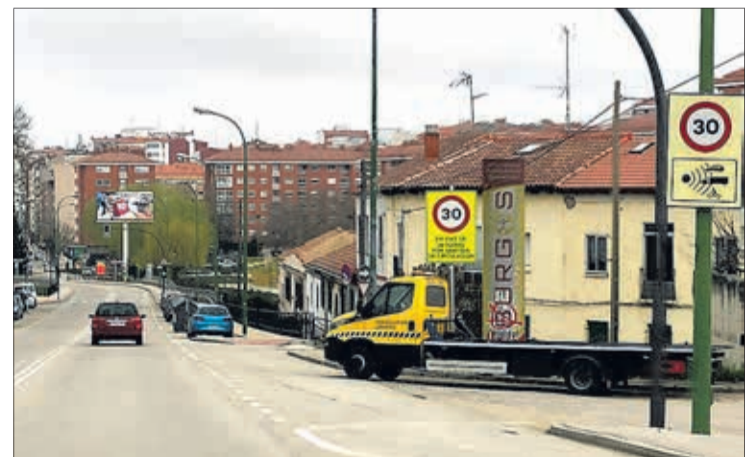
Las tres asociaciones llevan años reclamando la creación del Consejo de Movilidad.

Las tres asociaciones entienden que la ausencia de norma de un plazo establecido para la creación, “no convierte la disposición en una