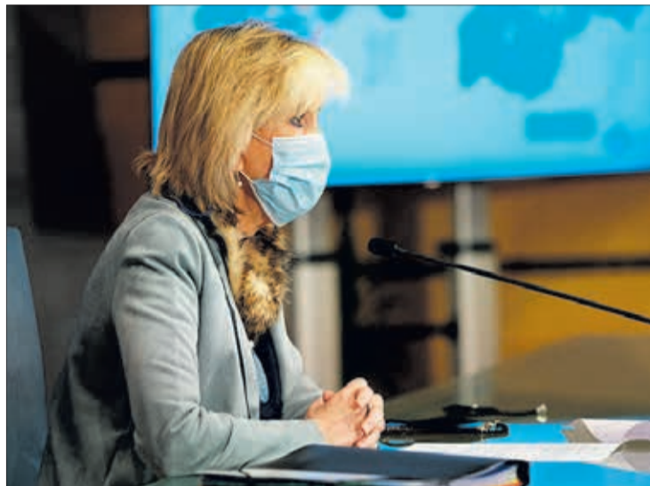
La consejera de Sanidad, Verónica Casado, el miércoles día 17 durante la rueda de prensa.

En la habitual comparecencia semanal para informar de la situación epidemiológica en la Comunidad en relación a la COVID-19, Casado indicó que “estamos en una situación de valle” y se ha parado el descenso, “ya que no estamos descendiendo a la velocidad a la que lo hacíamos y, de hecho, en algún momento fluctuamos con alguna que otra subida, de ahí que no nos debemos relajar”. De hecho, el martes 16, la incidencia acumulada a siete y 14 días subió un 1%. “Es una situación contenida y tenemos que ser cautelosos. Ya vimos