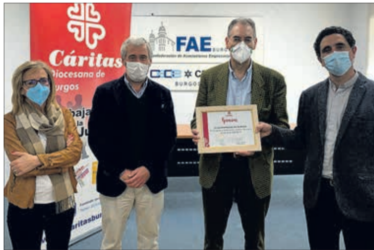
El acto de entrega del diploma tuvo lugar el lunes 15.

De esta forma, Cáritas Burgos hizo entrega de un diploma con-