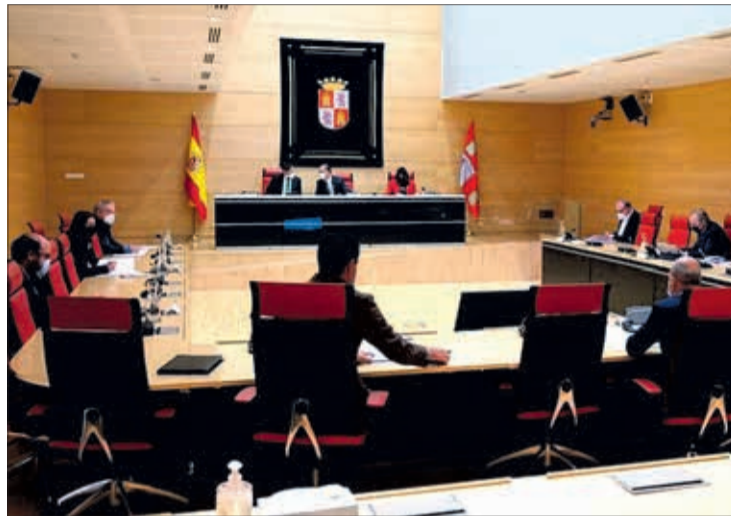
Reunión de la Junta de Portavoces para ordenar el pleno de la moción de censura

Hay que recordar que según establece el Reglamento de las Cortes, para ser elegido presi-