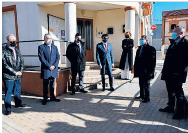
El convenio se suscribió en Villasandino, el lunes 15.

Asimismo, la Junta de Castilla y León añadirá una inversión de 870.000 euros para la adecuación de otras 18 viviendas más, como actuación propia de la Consejería de Fomento y Medio Ambiente. En total, se prevé destinar 1,3 millones para rehabilitar 26 viviendas en la provincia, que al final de la legislatura contará con 52 viviendas rehabilitadas, tras una inversión total de 2,5 millones de euros. La firma del convenio se produjo en Villasandino, uno de los municipios incluidos en el protocolo, donde los representantes institucionales visitaron una