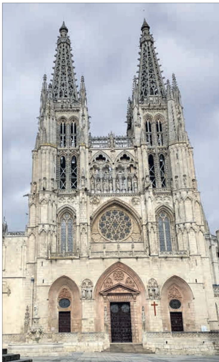
Las actuales puertas de la fachada principal datan de finales del siglo XVIII.

Por otro lado, los firmantes del primer manifiesto contra las nuevas puertas hicieron público el jueves 18 un segundo manifiesto en el que anuncian que se constituirá una plataforma para "aglutinar" a todas las personas contrarias a la intervención encargada por el Cabildo. Pág. 7