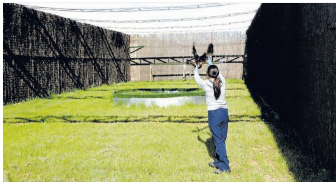
El Centro de Recuperación de Animales Silvestres está situado en Albillos.

En cuanto a la procedencia, en 2019, el 65 % de las entradas en el CRAS correspondió a ejemplares encontrados en Burgos; el 27% procedía de Soria y el 7% de Palencia, mientras que, en 2020, los animales silvestres burgaleses que entraron al centro superaron