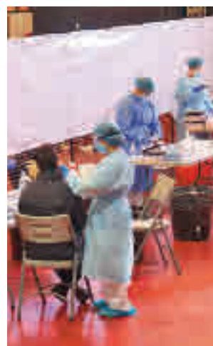
Test de antígenos

En el de este martes 6 de abril, tanto Tres Cantos como Colmenar han recibido noticias de diversa consideración.