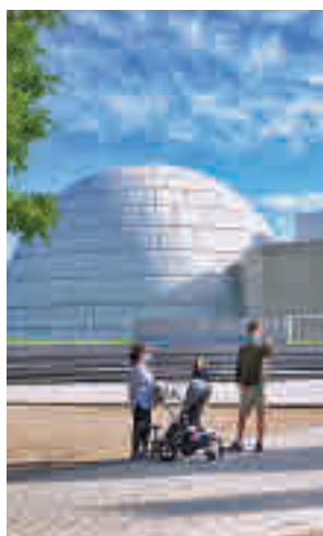
Planetario de Madrid

Las conferencias se retransmitirán en streaming a través del canal de YouTube del Planetario. Los estudian-