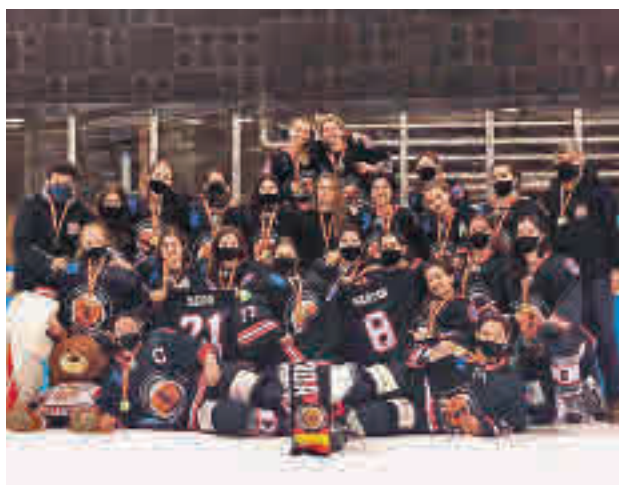
Nuevo éxito de las majariegas