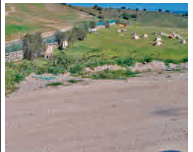
Imagen del ganado pastando cerca del vertedero

"haremos frente a las obligaciones de pago de la sentencia con determinación y los recursos que dan nuestra fortaleza económica y no dejaremos de impulsar el desarrollo del proyecto que los vecinos se merecen".