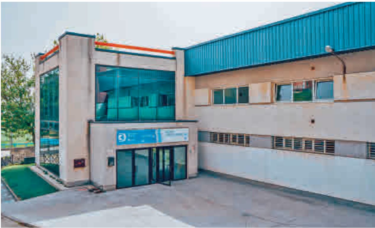
Fachada exterior del edificio donde está la piscina cubierta