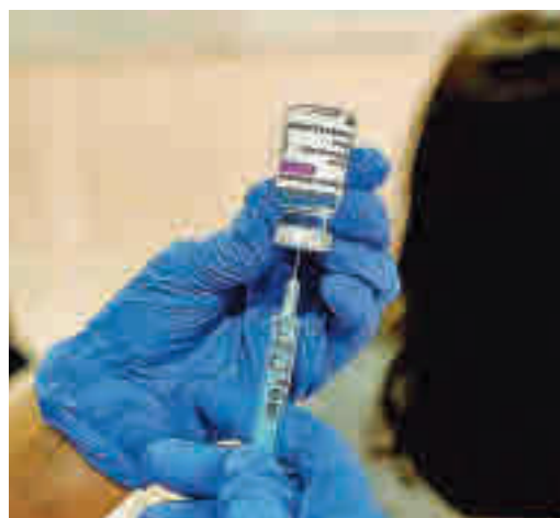
La vacuna de AstraZeneca, otra vez en duda

EL PERIÓDICO GENTE NO SE RESPONSABILIZA NI SE IDENTIFICA CON LAS OPINIONES QUE SUS LECTORES Y COLABORADORES EXPONGAN EN SUS CARTAS Y ARTÍCULOS