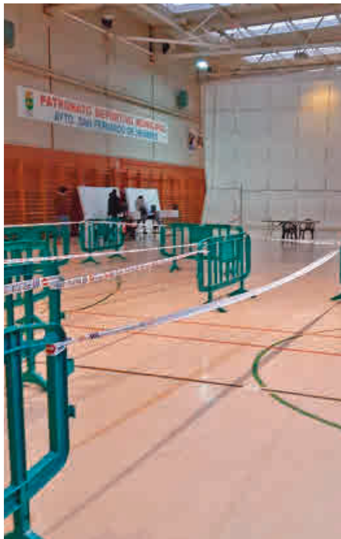
Imagen de una las jornadas de test de antígenos en San Fernando

lidades que se sitúan en su entorno más próximo, pues según el informe que publica la Consejería de Sanidad de la Comunidad de Madrid el crecimiento de la incidencia es algo común en todo ese área