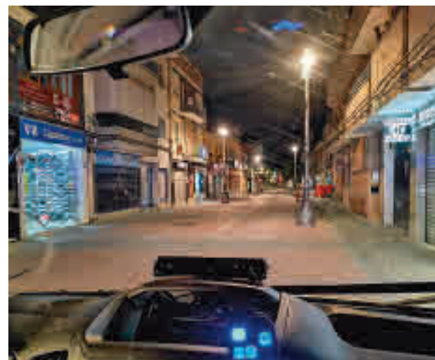
La incidencia sigue al alza