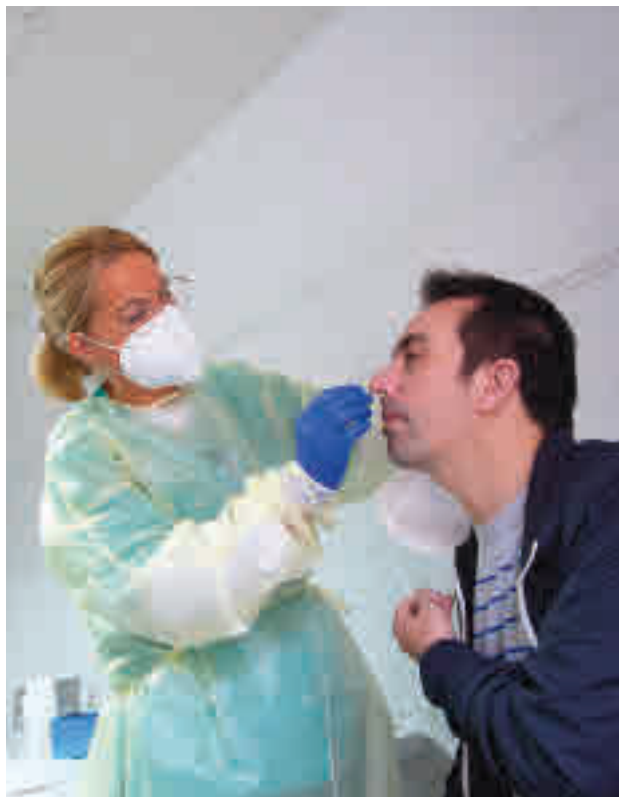
La incidencia sube en la zona Sur

El segundo municipio más afectado por la Covid es Parla, con 321 casos frente a los 278 de hace siete días. A continuación se sitúa Móstoles, que una semana más ve incrementada su incidencia tras pasar de los 240 casos de la semana pasada a los 290 de esta, superando ya el umbral de riesgo extremo. La zona