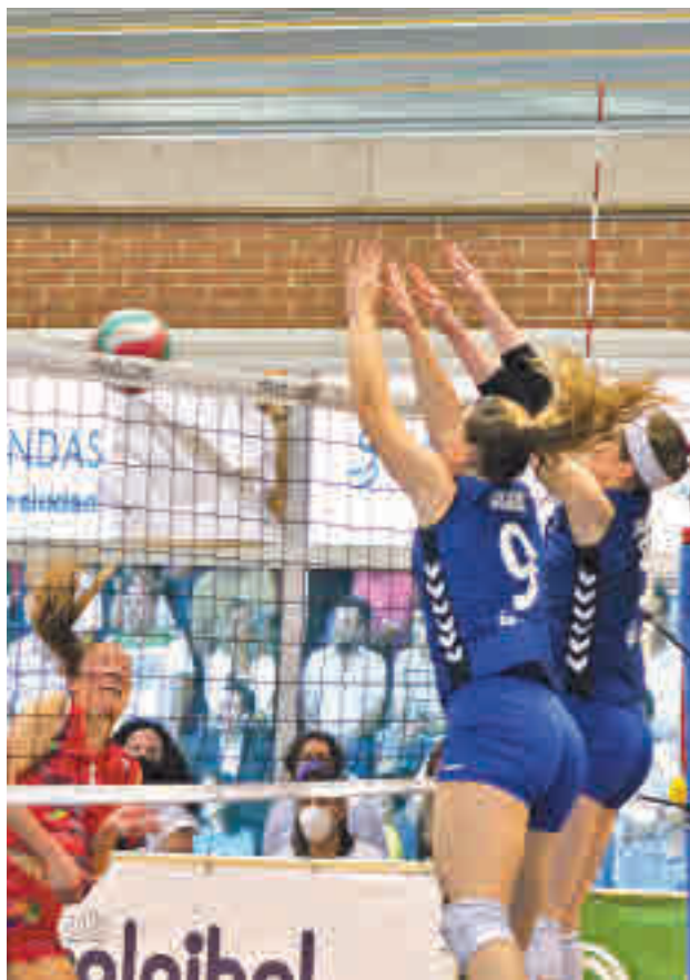
La serie llegará al Luis Buñuel el sábado 17 de abril

ANTE EL AVARCA MENORCA, LAS MADRILEÑAS TIRARON DE BUEN JUEGO Y ÉPICA