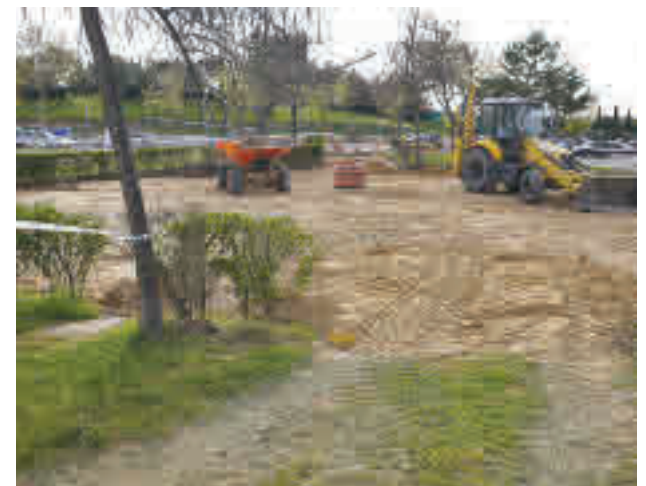
Obras en el parque Gregorio Marañón

El Consistorio boadillense ha señalado que los trabajos contarán con un presupuesto de 106.313 euros.