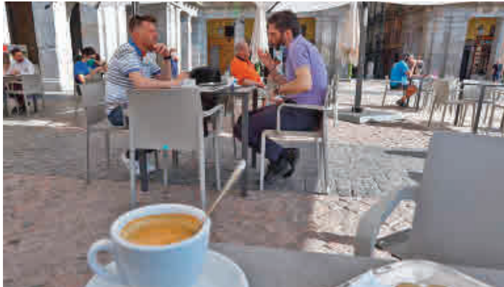
En la actualidad, hay en la capital alrededor de 8.000 terrazas de veladores

Así lo decidió el pasado miércoles 7 de abril la Comisión de Terrazas de la capital, según dio a conocer la vicealcaldesa, Begoña Villacís, a