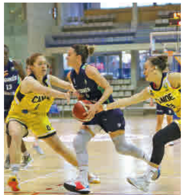
Gran ocasión para Leganés, Canoe y Alcobendas

AR Concepción-Ciudad Lineal y CDN Boadilla se ven las caras este sábado 10 (17:30 horas) en la Piscina M-86, en el marco de la jornada 13 dentro del grupo para lograr la permanencia.