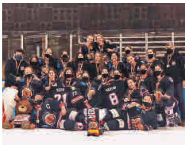
Nuevo éxito de las majariegas