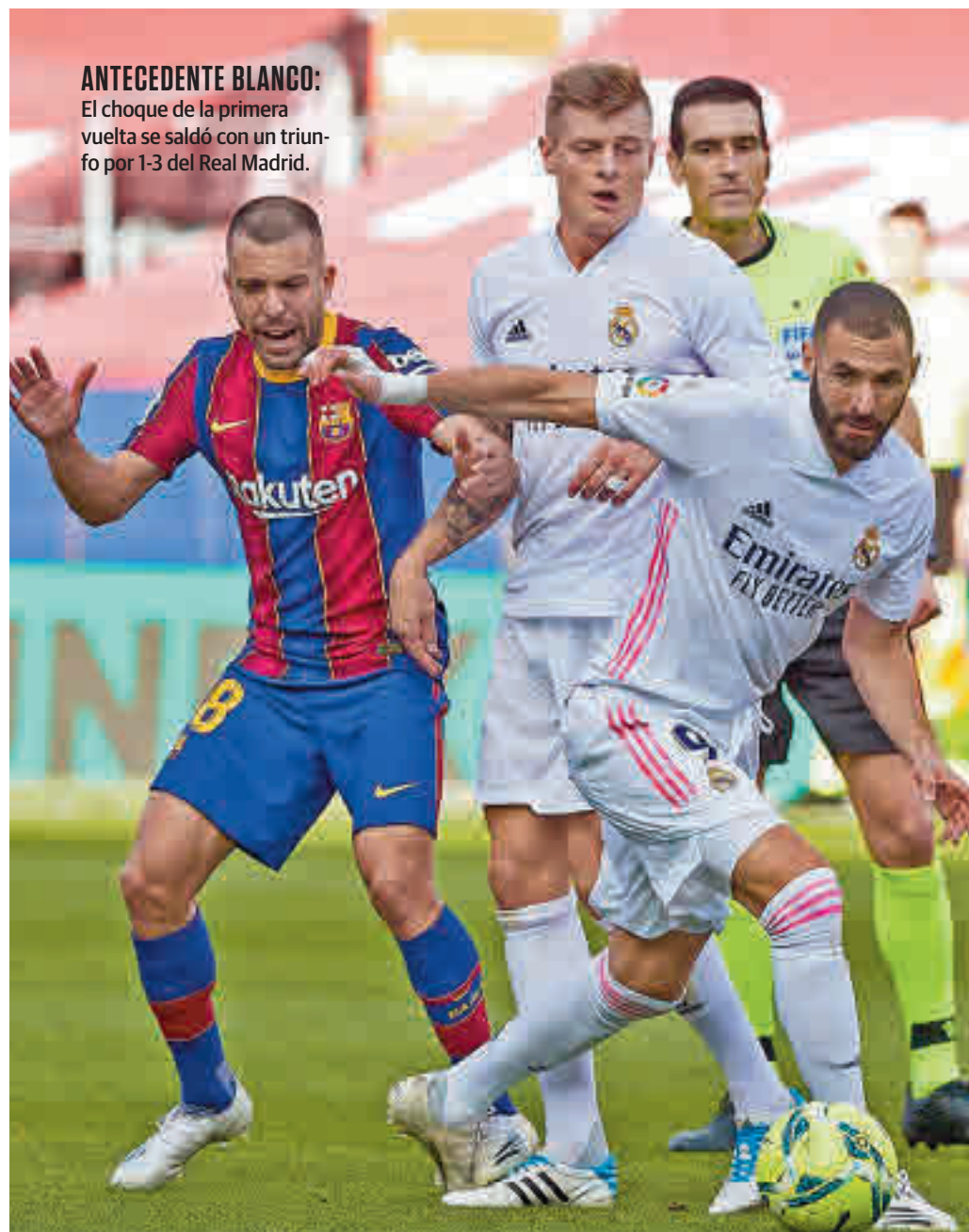
ANTECEDENTE BLANCO: El choque de la primera vuelta se saldó con un triunfo por 1-3 del Real Madrid.

emocionante del que hace apenas dos meses cabría esperar. El bajón del Atlético, sumado a la mejoría de Barça y Real Madrid deja a los tres candidatos en un pañuelo, tres puntos, con dos enfrentamientos directos aún por disputar. El primero de ellos ten-