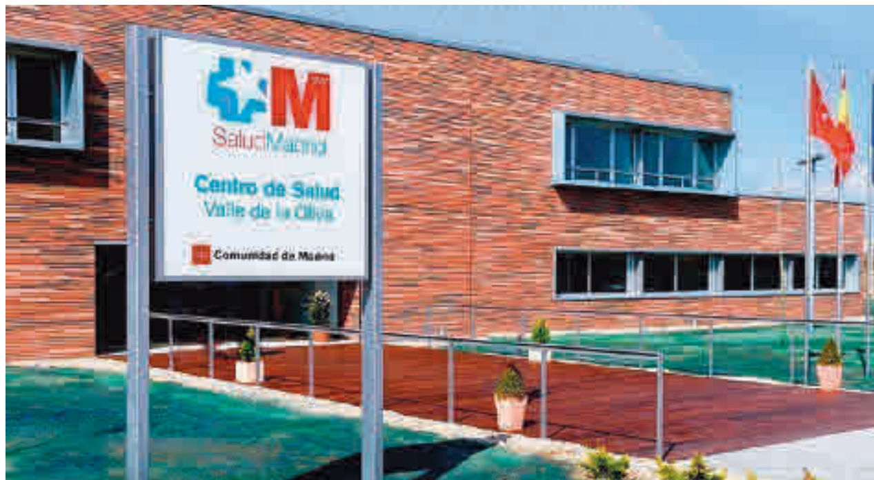
Valle de la Oliva podría reabrirse la semana que viene

COLLADO VILLALBA ES LA CIUDAD CON LA MENOR TASA DE CONTAGIOS