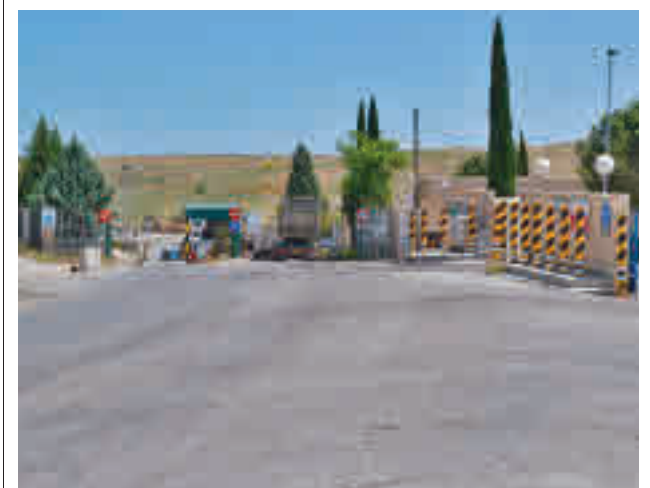
Vertedero de Pinto

La Policía Nacional ha detenido a un joven relacionado con la paliza que sufrió el día 20 de marzo a un adolescente de 17 años en Parla.