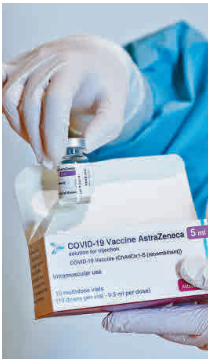
Vacunación de AstraZeneca

Hay que recordar que en un primer momento esta vacuna se restringió a los menores de 55 años (principalmente personal esencial como profesores, policías o bom-