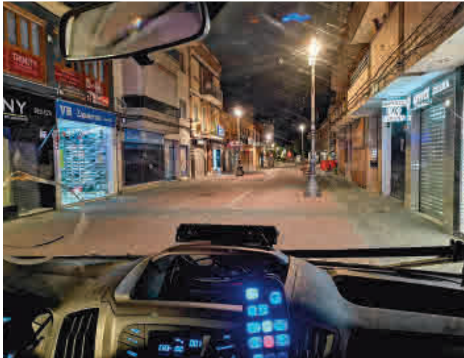
Los contagios siguen creciendo en Getafe

No es la única ZBS getafense de la localidad que supera los límites establecidos por la Consejería de Sanidad, ya que El Bercial se sitúa en los 411 casos por cada 100.000 vecinos. Sin embargo, la semana pasada ya estaba en 416 y los responsables sanitarios madrileños no tomaron ningún tipo de decisión, por lo que habrá que esperar a la comparecencia de este viernes 9 de abril para saber si cambian su criterio y aplican