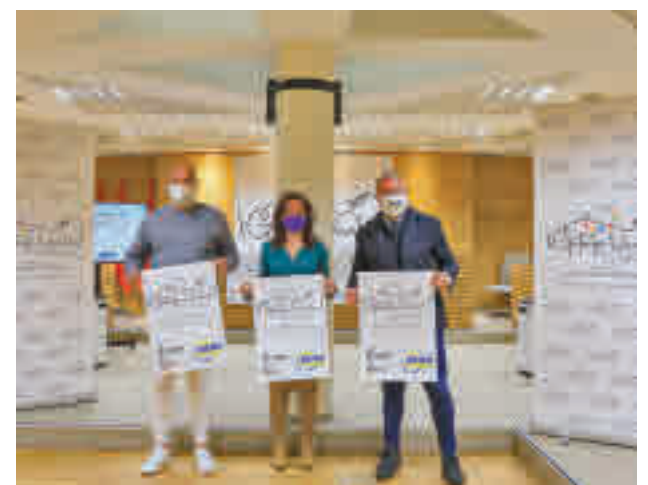
Presentación de la candidatura

Por su parte, Hugo Alonso ha puesto en valor que "Getafe apuesta por la actividad física ante la Covid frente a otras ciudades que se retraen, y además se valora el fomento de la diversidad, de los clubes y el asociacionismo, así como de las políticas deportivas e inclusivas a través del deporte".