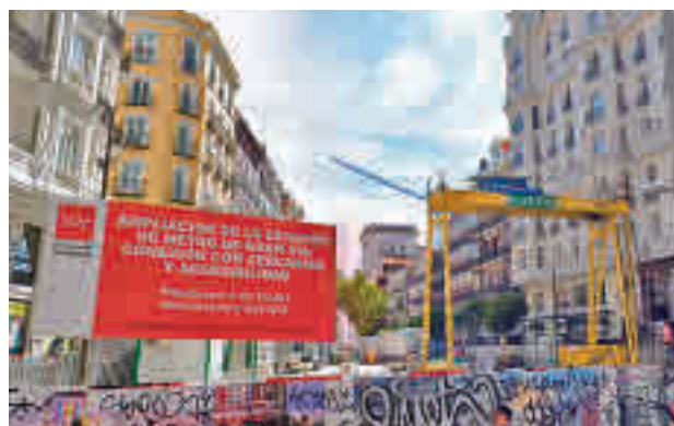
Las obras de remodelación en la calle Montera

Según fuentes regionales, los trabajos llevados a cabo conllevarán un cambio radical tanto en su arquitectura como en la implantación de nuevas instalaciones, convirtiéndose gracias a los últimos