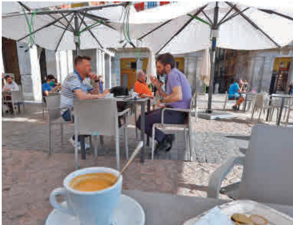
En la actualidad, hay en la capital alrededor de 8.000 terrazas de veladores

Al respecto, Villacís aseguró que estos beneficios no vencerán el próximo 9 de mayo con el decaimiento del Estado de Alarma, tal y como estaba previsto en un principio, pues era una "petición" del sector para tener "más garantías, seguridad y certidumbre". Se busca de esta manera compensar las pérdidas que ha sufrido el sector por el