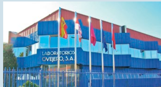
Laboratorios Ovejero, en proceso de compra por parte del Grupo Labiana.

EMPRESAS | ES OPTIMISTA RESPECTO A SU PROCESO DE COMPRA