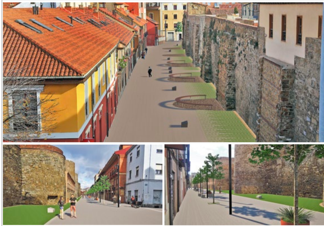
Así quedará la peatonalización de las calles Carrera y Los Cubos, un proyecto que persigue poner en valor el entorno de la Muralla.

El proyecto, como todas las normas básicas de accesibilidad, incluye la sustitución de todo el pavimento de la calle Carreras y avenida de los Cubos. En ambas vías se delimita-