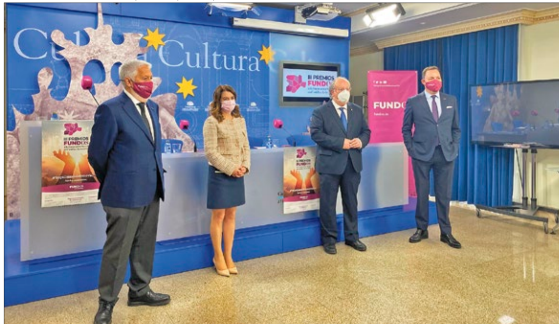
Presentación de la nueva convocatoria de los Premios Fundos de Innovación Social, que se entregarán en febrero de 2022 en Salamanca.