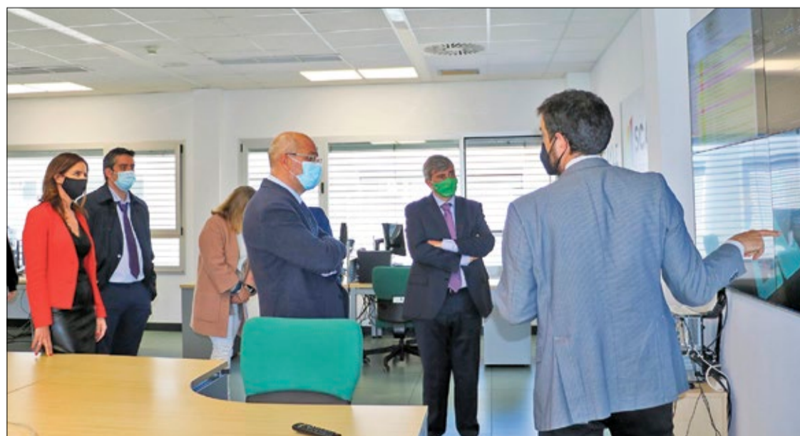
El vicepresidente y la consejera de Empleo, junto al rector de la ULE, en la visita que cursaron a las instalaciones del SCAYLE.

La jornada tuvo como objetivo sensibilizar a las empresas sobre la necesidad de implementar medidas de ciberseguridad en sus procesos de producción, gestión y comercialización, además de informar sobre las ayudas convocadas por la Consejería de Empleo e Industria para impulsar la ciberseguridad como sector estratégico en Castilla y León. Estas ayudas forman parte de un conjunto de iniciativas que se van a poner en marcha en el ámbito del DIH (Digital Innovation