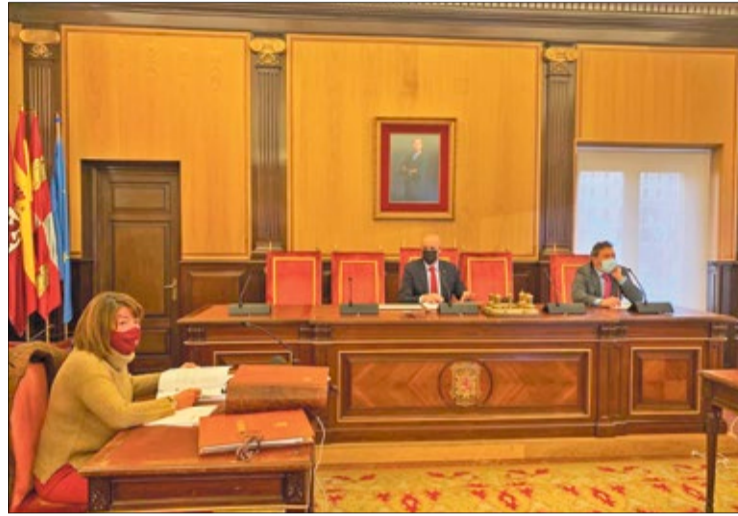
Imagen de la Junta de Gobierno del 26 de marzo, celebrada vía telemática.

Esta nueva edición pondrá a disposición de los leoneses bonos de 5, 20 ó 40 euros de valor nominal para adquirir bienes o servicios con un 25% de descuento, aportado por el Ayuntamiento, para canjear en pequeño comercio y hostelería. Cada consumidor podrá adquirir bonos por un importe máximo de 120 euros para poder gastar en el pequeño comercio y 60 euros máximo en establecimientos de hostelería. Los bonos se pondrán en circulación próximamente y se podrán utilizar en los establecimientos adheridos hasta el 30 de noviembre de 2021.