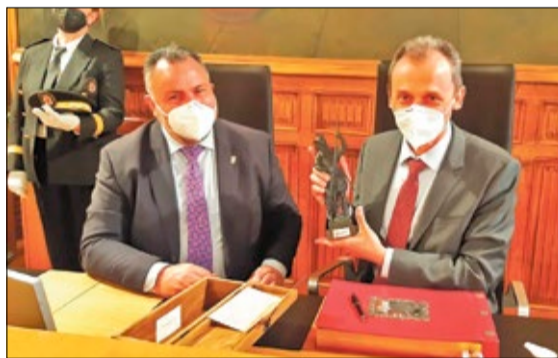
El ministro Pedro Duque visitó el Palacio de los Guzmanes donde fue recibido en el salón de plenos por el presidente y los portavoces de los grupos políticos y escribió en el Libro de Honor de la Diputación. Duque también visitó la Escuela de Aeroespacial de la ULE.

el Salón de Actos de la Escuela de Ingenierías, donde confirmó trabajar para hacer más racional la justificación de proyectos y establecer cambios en la actividad postdoctoral de los científicos.