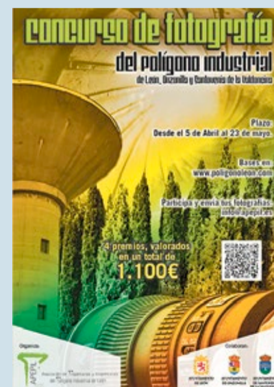
Cartel del concurso de fotografía.

La Asociación de Proprietarios y Empresarios del Polígono Industrial de León (APEPIL) organiza en colaboración con el Consorcio Urbanístico Intermunicipal para la gestión del Polígono Industrial de León el primer Concurso Fotográfico del Polígono Industrial de León, Onzonilla y Santovenia de la Valdolina. La temática del concurso es el propio polígono y está dotado con 1.100 euros en premios. La fecha límite de entrega de trabajos es el próximo 23 de mayo.