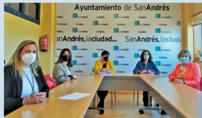
La alcaldesa se reunió con la Asociación de Mujeres Empresarias de León.