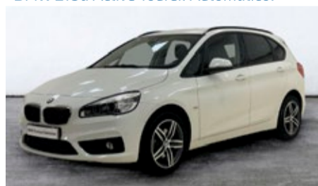
BMW 218d Active Tourer. Automático.

26.900 € Combustible: Diésel Matriculación: 30/04/2018 Kilometraje: 33.000 km