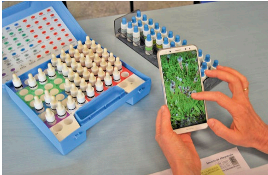
Con la llegada de la primavera también lo hace la alergia al polen, aunque este año el uso de la mascarilla mitigará sus efectos.

La Sociedad Española de Alergología e Inmunología Clínica (Seaic) augura una primavera "moderada" con unas concentraciones de polen entre los 3.000 y 4.000 granos por metro cúbico de aire. Esos valores están estrechamente relacionados con la precipitación, la humedad y las temperaturas registradas entre octubre y marzo. Así, al margen de las lluvias en otoño e invierno, las nevadas del temporal 'Filomena' y posterior deshielo han favorecido el crecimiento y desarrollo de las plantas. No obstante, según Camazón, "los niveles de polen también dependerán