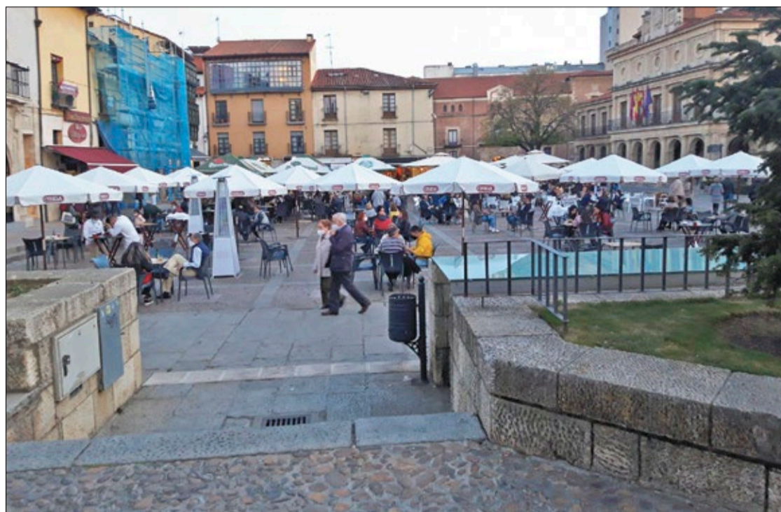
Con la llegada del buen tiempo, las terrazas vuelven a llenarse pero manteniendo las medidas sanitarias. En la foto, la Plaza de San Marcelo.

Asimismo, otros cinco municipios están las puertas de ingresar en el grupo de riesgo alto, superando una incidencia de 100 casos por 100.000 habitantes. En este grupo se encuentran León capital, con 139 y San Andrés del Rabanedo, con 144. En este sentido, el alcalde de León, José Antonio Díez, ha mostrado su convencimiento de que el cierre del interior de bares en la ciudad de León será "cuestión de días", aunque ha destacado que durante la Semana Santa -festividad que podría desencadenar la temida cuarta ola- se han cumplido las medidas sanitarias. Díez también ha aludido a la "responsabilidad" de los ciudadanos para evitar y contener los contagios.