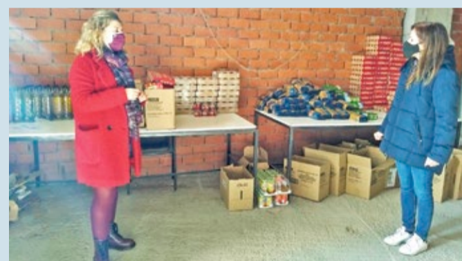
La concejala de Bienestar Social visitó al personal encargado del reparto.