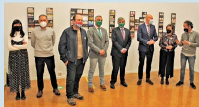
Inauguración del certamen, en el que participan editores, ULE y Ayuntamiento.

CULTURA | INCLUYE EXPOSICIONES, TEATRO, PRESENTACIONES DE LIBROS Y CONCIERTOS