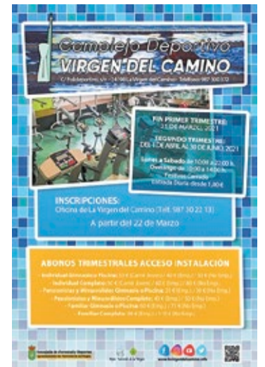
Cartel informativo de los abonos.