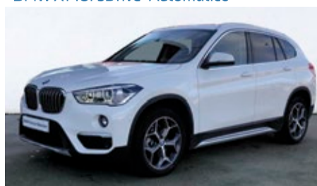
BMW X1 18i sDrive Automático

30.900 € Combustible: Gasolina Matriculación: 28/12/2018 Kilometraje: 35.000 km