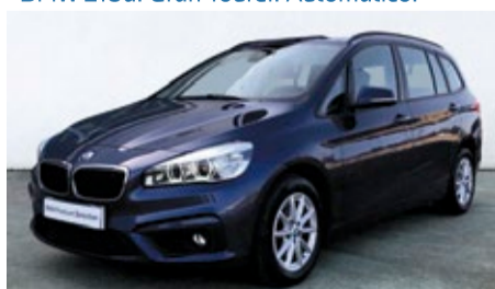
BMW 218d. Gran Tourer. Automático.

18.900 € Combustible: Diésel Matriculación: 14/10/2016 Kilometraje: 92.000 km