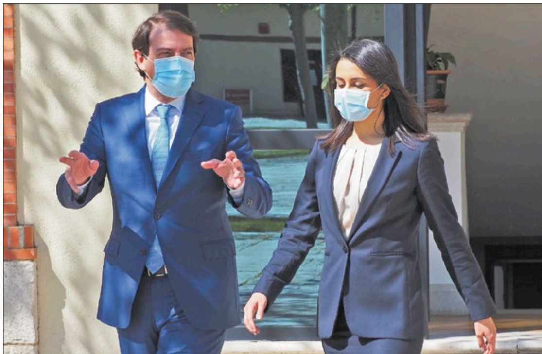
Inés Arrimadas y Alfonso Fernández Mañueco, momentos antes del encuentro en el que ratificaron el Pacto de Gobierno en Castilla y León.

La visita de Arrimadas a Valladolid estaba prevista para el lunes 15 de marzo pero se pospuso por la situación de Murcia, la convocatoria de elecciones en Madrid y la presentación de una moción de censura en Castilla y León. Tras todos estos hechos, Mañueco y Arrimadas escenificaron que el pacto sigue vigente en Castilla y León. Mañueco resumió el encuentro como la garantía de la "estabilidad" en Castilla y León. "Ratificamos al más alto nivel y de manera pública compromiso firme fuerzas para mantener ese pacto de gobierno que ha dado estabi-