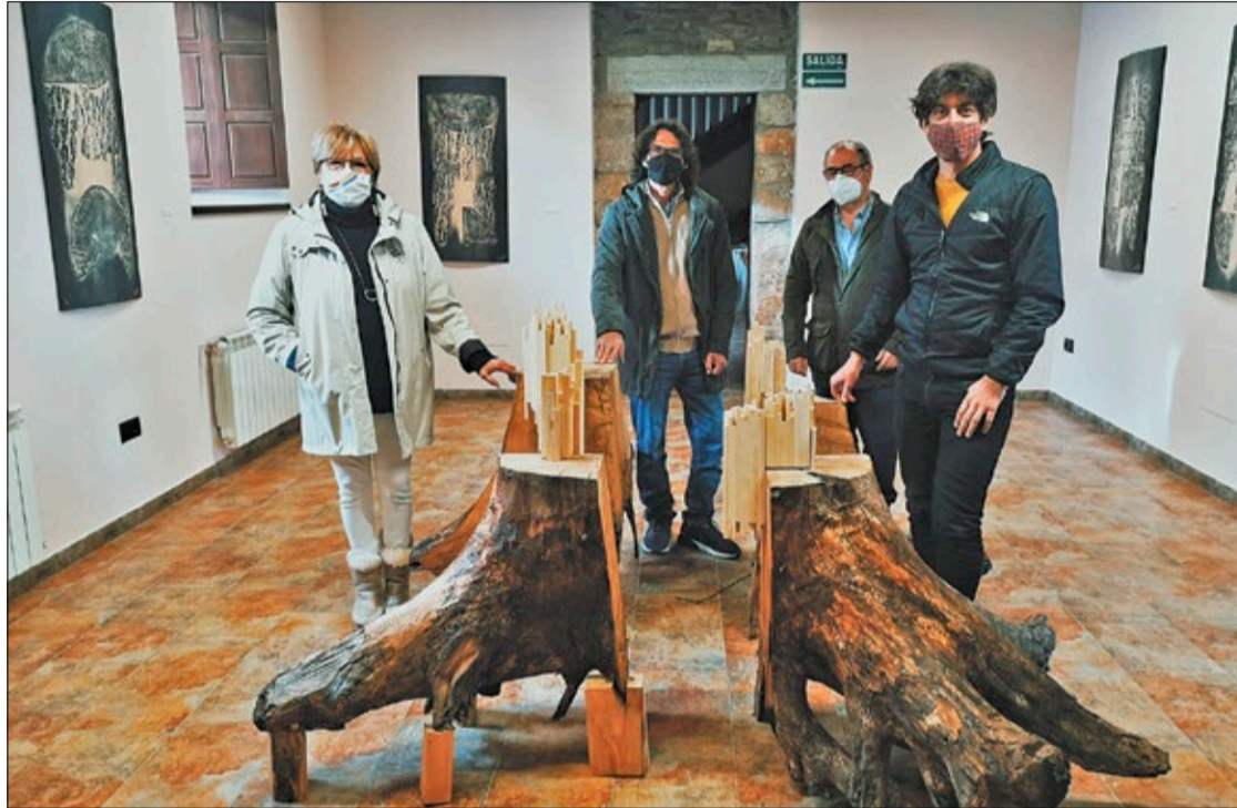
Inauguración de la muestra ‘El bosque dormido’ que puede visitarse en el Centro de Interpretación de la Biosfera de Omaña y Luna.

En concreto, la exposición está formada por 31 obras gráficas con tratamiento escultórico, realizadas sobre madera, y por una instalación creada a partir de un antiguo tronco de nogal. Las piezas que pueblan ‘El bosque dormido’ han sido formalizadas por medio de un con-