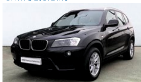
BMW X3 20d xDrive

16.900 € Combustible: Diésel Matriculación: 22/05/2013 Kilometraje: 180.000 km