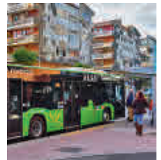
Un autobús en Torrejón