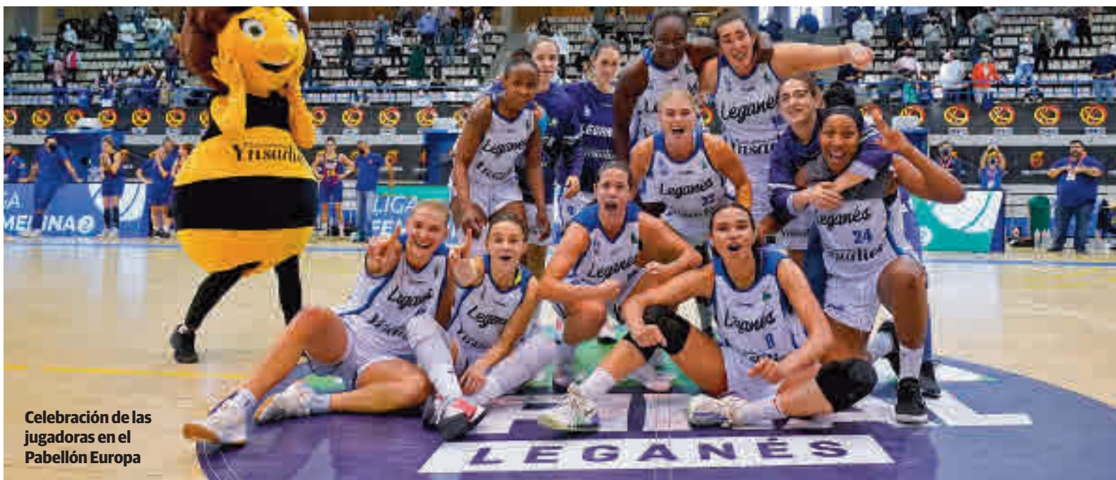
Celebración de las jugadoras en el Pabellón Europa