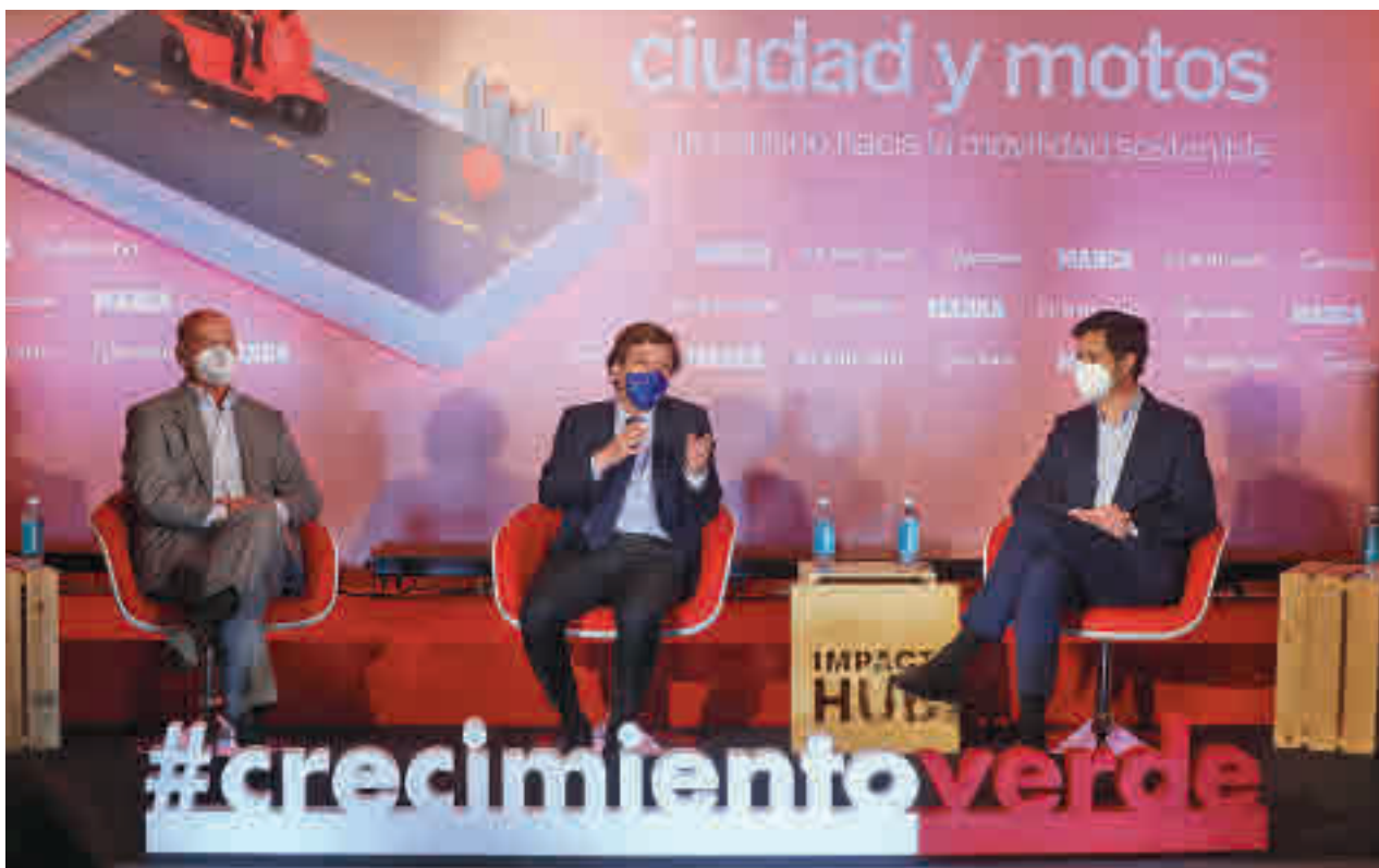
La intervención del alcalde en el coloquio organizado por Unidad Editorial el pasado 14 de abril