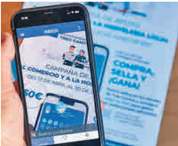
Los sellos se adquieren a través de una app móvil

Esta campaña se reactivará en la temporada de otoño, concretamente del 4 de octubre al 15 de diciembre, aunque en esta ocasión los consumos en hostelería se traducirán en premios en comercios de cara a Navidad.