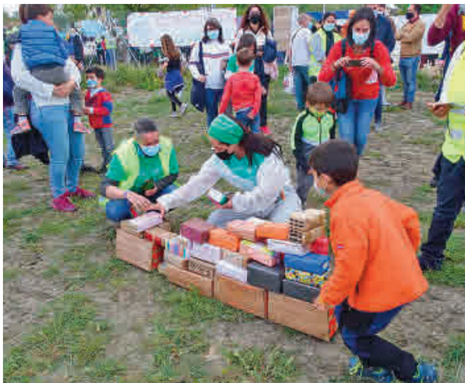
Los residentes, mayores y pequeños, hicieron ladrillos con cajas de cartón AV PAU ENSANCHE

Fuentes de la Consejería de Educación explican a este periódico que la construcción del segundo instituto está dentro de la planificación de centros realizada por su dirección general de Infraestructuras, "aunque no se trata de una obra que se vaya a acometer a corto plazo". "Se creará cuando sea necesario, pero por ahora las necesidades de escolarización de la zona están cubiertas", añaden.