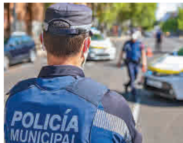
Uno de los controles policiales en las zonas restringidas

El documento, como es habitual, detalla, por otro lado, los nuevos contagios. Puente de Vallecas tiene el