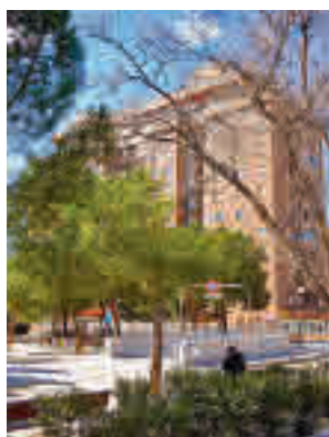
El barrio de Las Rosa

La primera de ellas es la Parcela D Gran San Blas, un espacio situado al suroeste