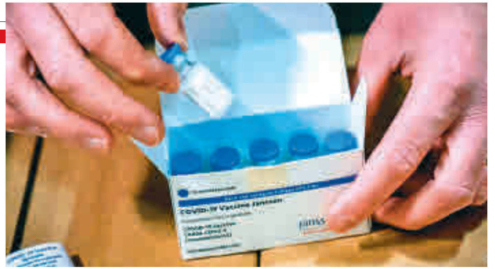
Viales de la vacuna de Janssen

calendario planificado de reparto de vacunas. Por tanto, es importante actuar rápidamente, anticiparse y ajustar cuando sea posible", señaló la presidenta de la Comisión Europea, Ursula von der Leyen.