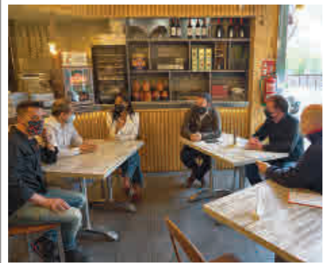
Un momento de la reunión