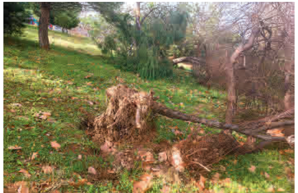
Dos ejemplares arrancados en una zona ajardinada de Las Tablas AV LAS TABLAS

El portavoz alerta de que en la zona de Castillo de Candanchú hay muchos árboles caídos. "La gente del huerto urbano comunitario del Tablao de la Compostura limpiamos el entorno, pero en el resto hay árboles arrancados de cuajo que son peligrosos", explica a GENTE. "Hemos enviado un escrito y no contestan, algo habitual en