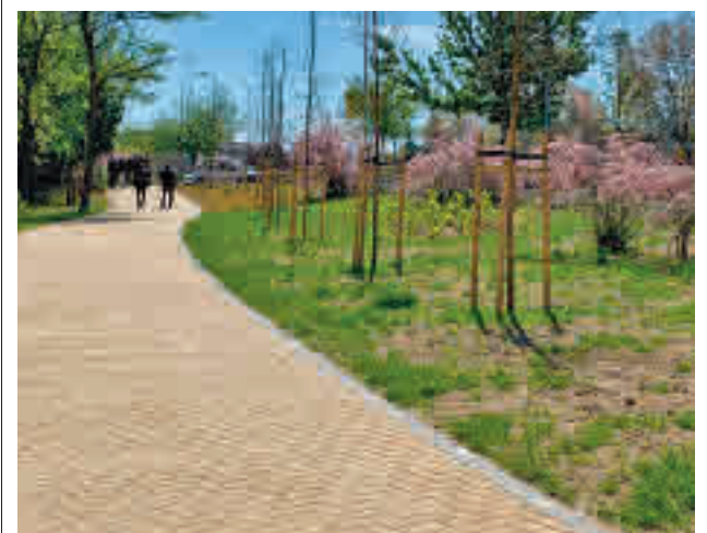
El jardín ha supuesto la inversión de 172.000 euros

Una semana después, a la misma hora, los más pequeños podrán participar en el taller 'Quijote y sus molinos', donde crearán la marioneta de Quijote o los molinos de viento con materiales de reciclaje y pinturas.