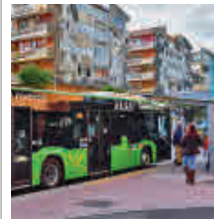
Un autobús en Torrejón