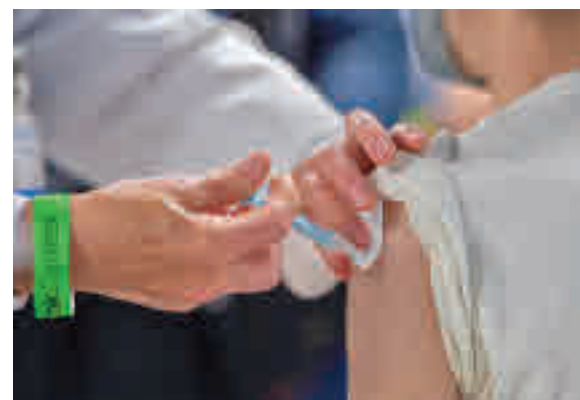
Dosis de AstraZeneca

inocularán el segundo pinchazo. Ese día la Agencia Europea del Medicamento (EMA, por sus siglas en inglés), presentará un informe detallado por grupos de edad sobre los efectos adversos de esta vacuna, un documento que servirá