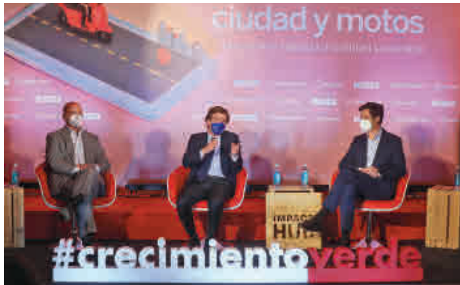
La intervención del alcalde en el coloquio organizado por Unidad Editorial el pasado 14 de abril

El Ayuntamiento de Madrid pondrá en marcha un proyecto piloto que consistirá en un carril 'avanzamoto' específico en los últimos 70 metros antes del semáforo con el objetivo de reducir las situaciones de riesgo que se producen para los motoristas. El lugar elegido para su implantación será la avenida de Asturias desde la calle de Montoya hasta Carmen Montoya, en el distrito de Tetuán. El alcalde de Madrid, José Luis Mar-