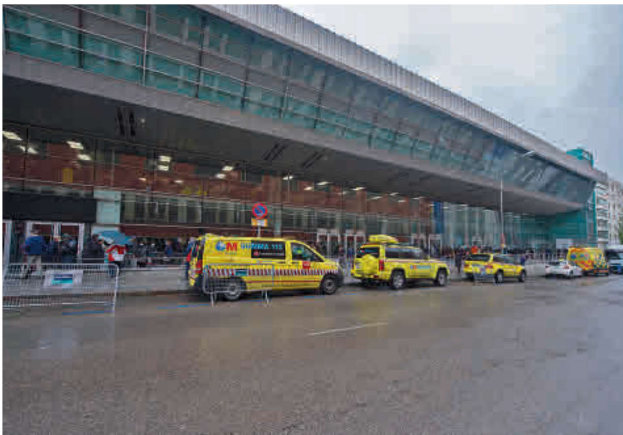
Vacunación en la Comunidad de Madrid