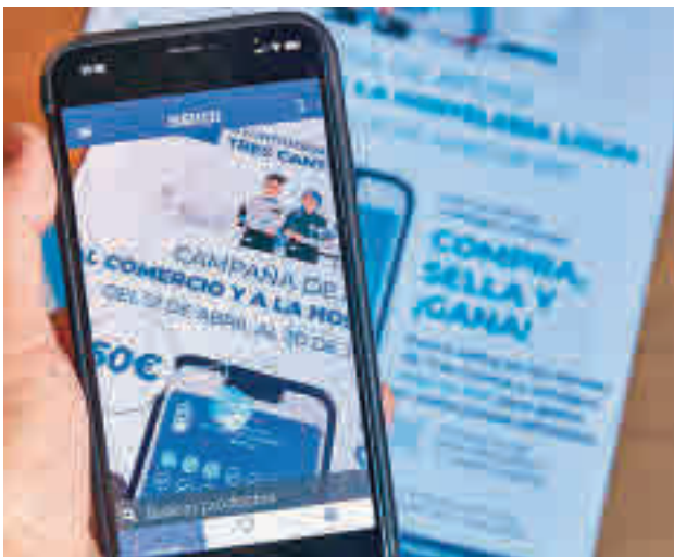
Los sellos se adquieren a través de una app móvil

Esta campaña se reactivará en la temporada de otoño, concretamente del 4 de octubre al 15 de diciembre, aunque en esta ocasión los consumos en hostelería se traducirán en premios en comercios de cara a Navidad.