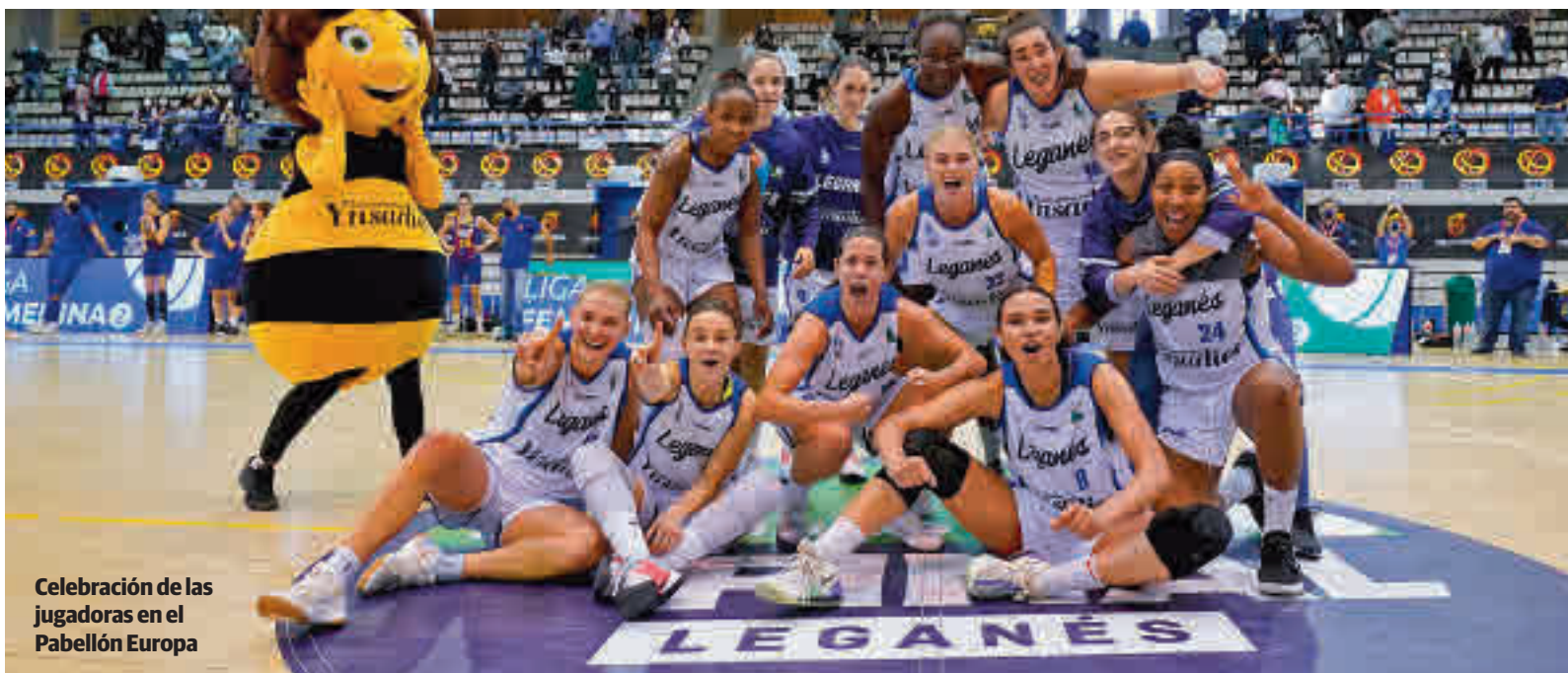
Celebración de las jugadoras en el Pabellón Europa

EL CONJUNTO DE ANTONIO PERNAS FIRMÓ TRES RESULTADOS DE AUTORIDAD