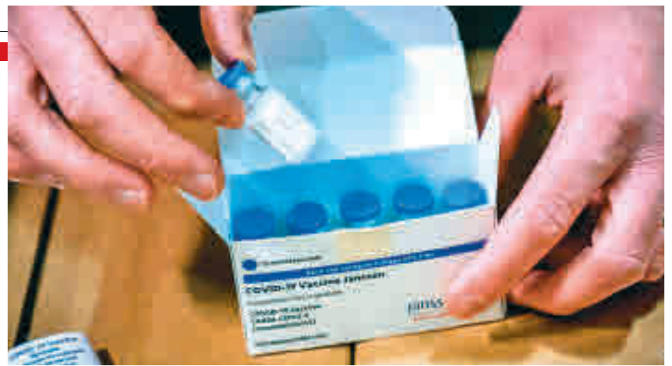
Viales de la vacuna de Janssen

calendario planificado de reparto de vacunas. Por tanto, es importante actuar rápidamente, anticiparse y ajustar cuando sea posible", señaló la presidenta de la Comisión Europea, Ursula von der Leyen.