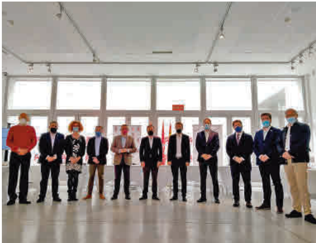
Unidos por objetivos comunes AYUNTAMIENTO DE TORREJÓN

En este sentido, el Consorcio tiene como uno de los principales objetivos fijados el esfuerzo en el nuevo Marco Financiero Europeo 21-27