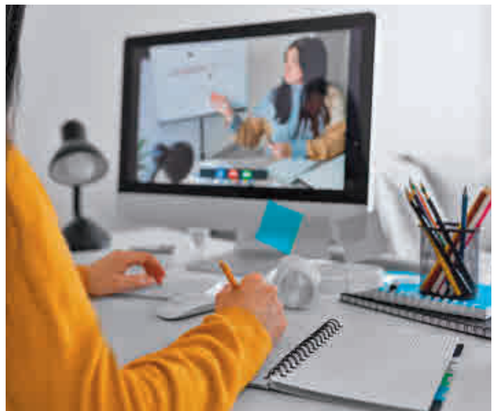
El documento puede consultarse en la web Colmenarviejo.com

Esta guía es una publicación elaborada por la Casa de la Juventud de Colmenar Viejo en colaboración con la Asesoría de Estudios de Tres Cantos, y