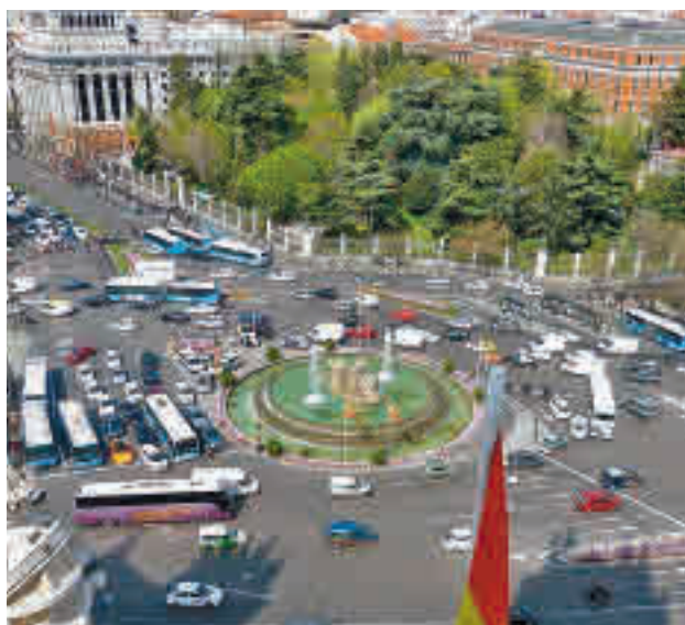
Coches circulando en Madrid

La cifra madrileña está por encima de la media nacional, que se sitúa en el 7,7%, lo que significa que 2,6 millones de vehículos no cumplen con esta obligación, un dato que se ha incrementado en un 16% en el último año. El envejecimiento del parque automovilístico, el desconocimiento por parte de los pro-