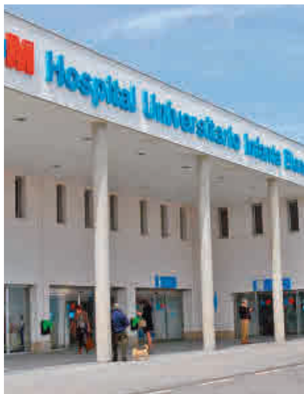
Los casos siguen al alza en el Sur

Getafe, que ocupa la segunda posición en esta clasificación, ha pasado de 333 a 369 casos por cada 100.000