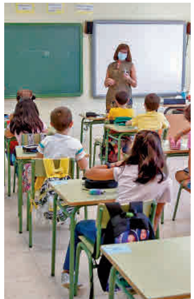
Colegio de la Comunidad de Madrid

para las familias, incluyendo un listado de preguntas y respuestas frecuentes. Además, tienen a su disposición el número de teléfono 012 en el caso de cualquier tipo de consulta o posible incidencia por parte de las familias.