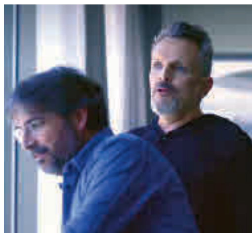
Un momento del programa 'Lo de Évole'

EL PERIÓDICO GENTE NO SE RESPONSABILIZA NI SE IDENTIFICA CON LAS OPINIONES QUE SUS LECTORES Y COLABORADORES EXPONGAN EN SUS CARTAS Y ARTÍCULOS