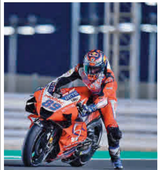
Jorge Martín deslumbró en Losail