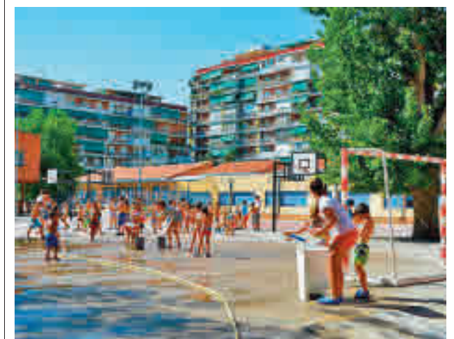
Campamento urbano en Alcorcón

Desde esta semana el Ayuntamiento de Valdemoro ha incorporado un servicio de cita online para los trámites del Área Económica.