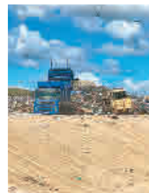
Vertedero de Colmenar

En la redacción de la declaración han tenido en cuenta las consideraciones realizadas en los informes y alegaciones presentados por