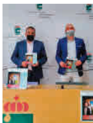
El acto de presentación

Así las cosas, sobre las tablas del teatro se representarán ‘La herencia’, ‘Arde ya la yedra’, ‘Nanuk en el bosque de las emociones’ o ‘Los asquerosos’, protagonizada por los actores