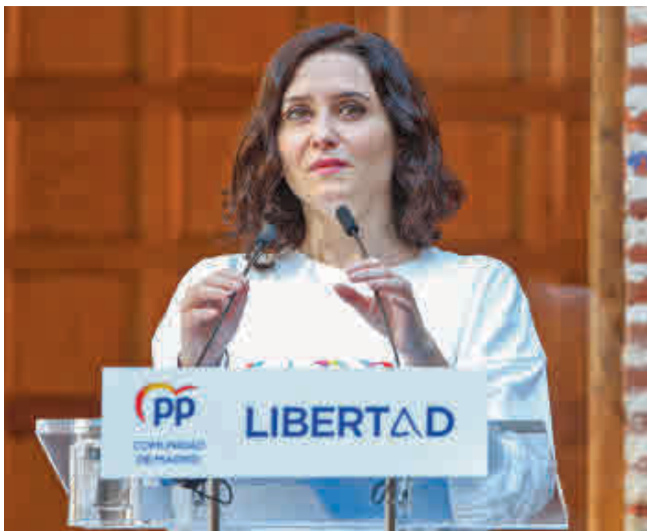
Isabel Díaz Ayuso, durante un acto electoral

La respuesta de la popular Isabel Díaz Ayuso a Montero no se hizo esperar. "Nosotros