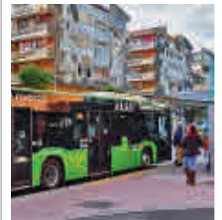
Un autobús en Torrejón