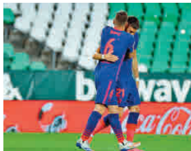
El Atlético sacó un punto del campo del Betis

En el caso de hacer valer su condición de favorito en este choque, el Atlético se colo-