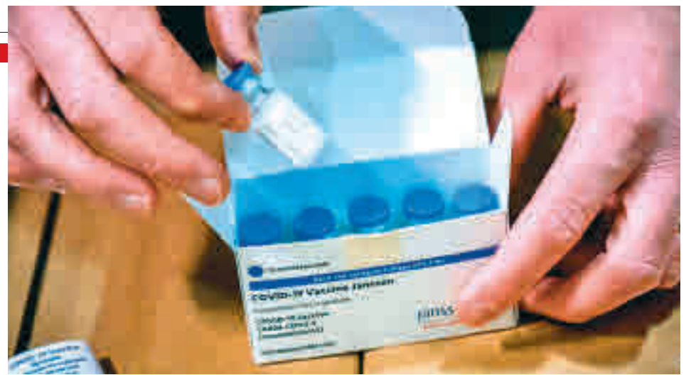
Viales de la vacuna de Janssen

calendario planificado de reparto de vacunas. Por tanto, es importante actuar rápidamente, anticiparse y ajustar cuando sea posible", señaló la presidenta de la Comisión Europea, Ursula von der Leyen.