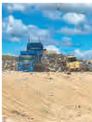
Vertedero de Colmenar

En la redacción de la declaración han tenido en cuenta las consideraciones realizadas en los informes y alegaciones presentados por