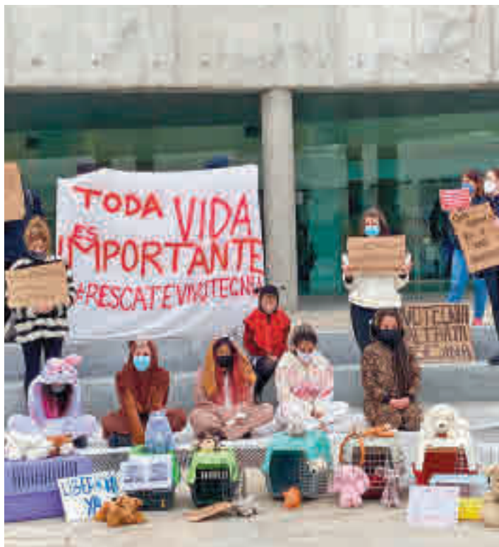
Una de las concentraciones de protesta GENTE

Las reacciones no se hicieron esperar. Las críticas crecían al mismo tiempo que el vídeo iba recabando visualizaciones, hasta tal punto que el Gobierno regional decidió tomar cartas en el asunto. Para la Comunidad de Madrid, los hechos suponían “una infracción muy grave” en la normativa reguladora del uso de animales de experimentación, por lo que se realizó con carácter inmediato una inspección de trabajo para recabar más información al respecto. El resultado, la suspensión de la activi-