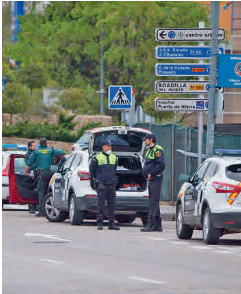
Valle de la Oliva podría salir de su cierre perimetral

El documento refleja que la única Zona Básica de Salud que por el momento está cerrada perimetralmente, la de Valle de la Oliva (Majadahonda), podría abandonar esta situación la próxima semana, ya que con 292 casos por cada 100.000 habitantes es una de las áreas sanitarias con una tasa más baja de esta parte de la región. Suerte muy distinta podría correr la otra