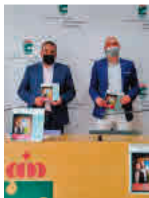
El acto de presentación

Así las cosas, sobre las tablas del teatro se representarán ‘La herencia’, ‘Arde ya la yedra’, ‘Nanuk en el bosque de las emociones’ o ‘Los asquerosos’, protagonizada por los actores