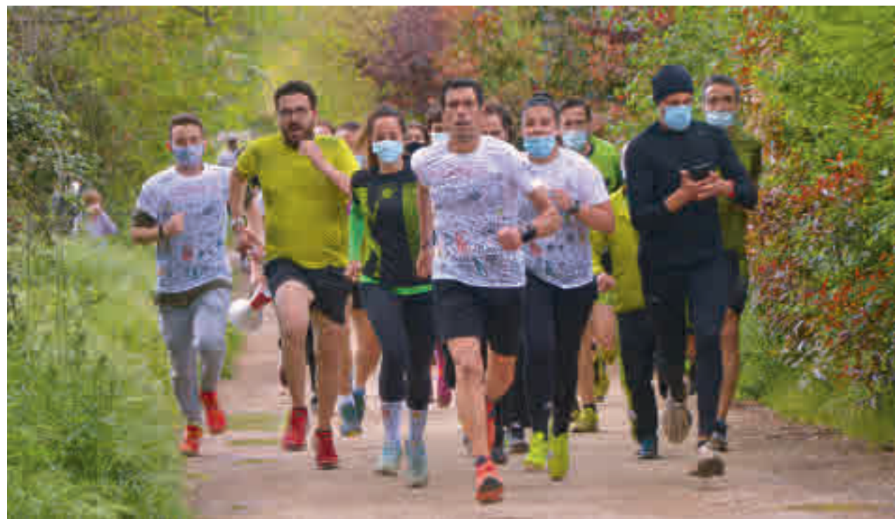
AYTO. DE SAN FERNANDO