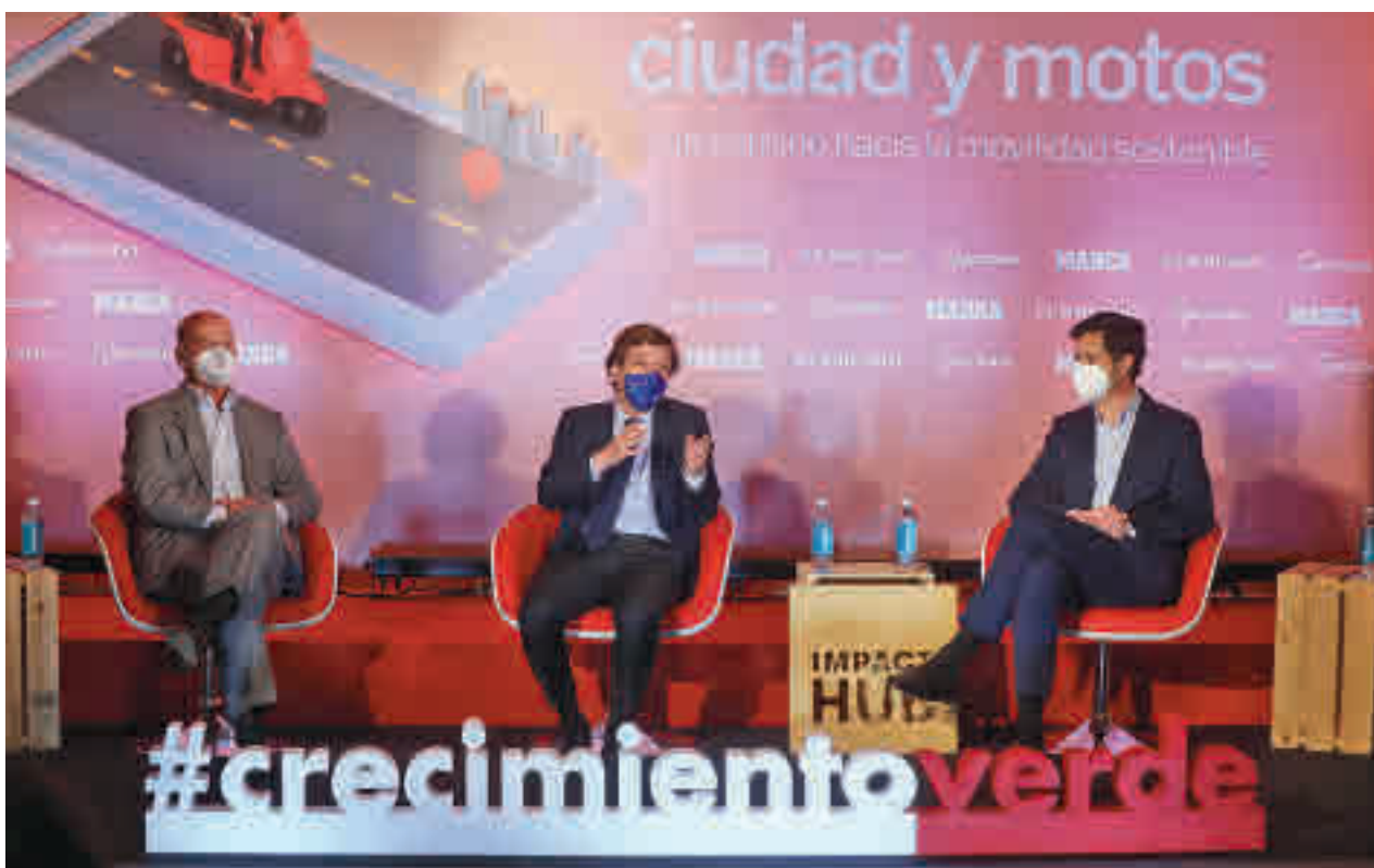
La intervención del alcalde en el coloquio organizado por Unidad Editorial el pasado 14 de abril