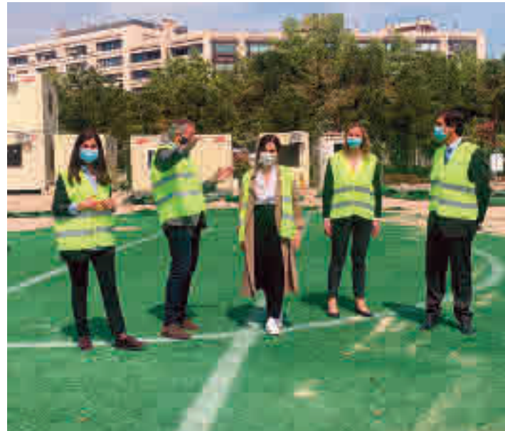
Un momento de la visita de la presidenta autonómica

El entorno contará con más de 55.000 metros cuadrados de zonas verdes • La Comunidad de Madrid prevé que las obras de remodelación estén terminadas en la primavera de 2023