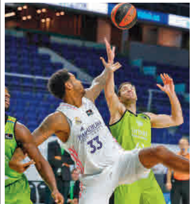
Imagen del partido de la primera vuelta