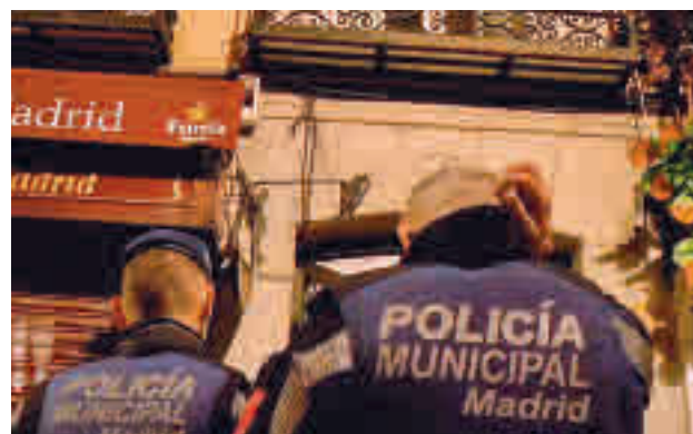
La policía intensifica los registros en pisos

En concreto, los agentes locales intervinieron en 61 eventos ilegales el viernes, 147 el sábado y 147 el domingo y 12 en total en pisos turísticos. En algunos de ellos ha-