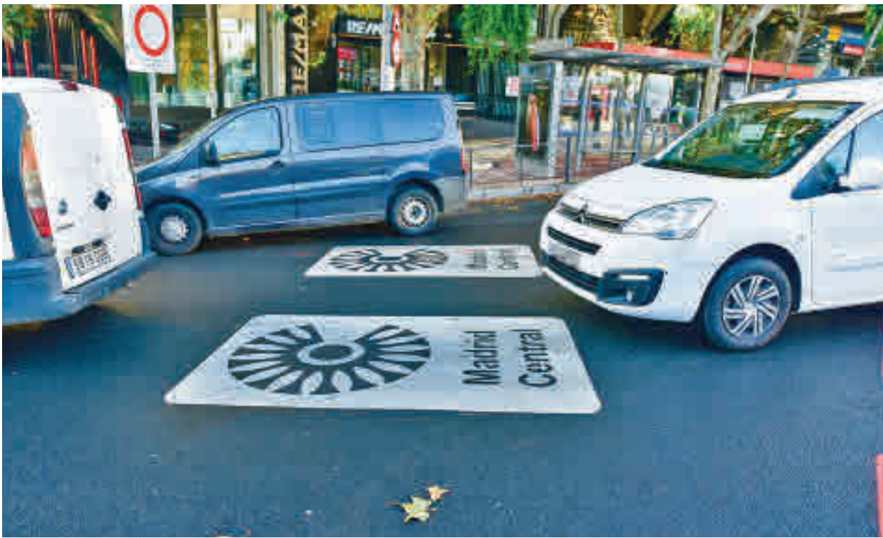
La zona de bajas emisiones Madrid Central