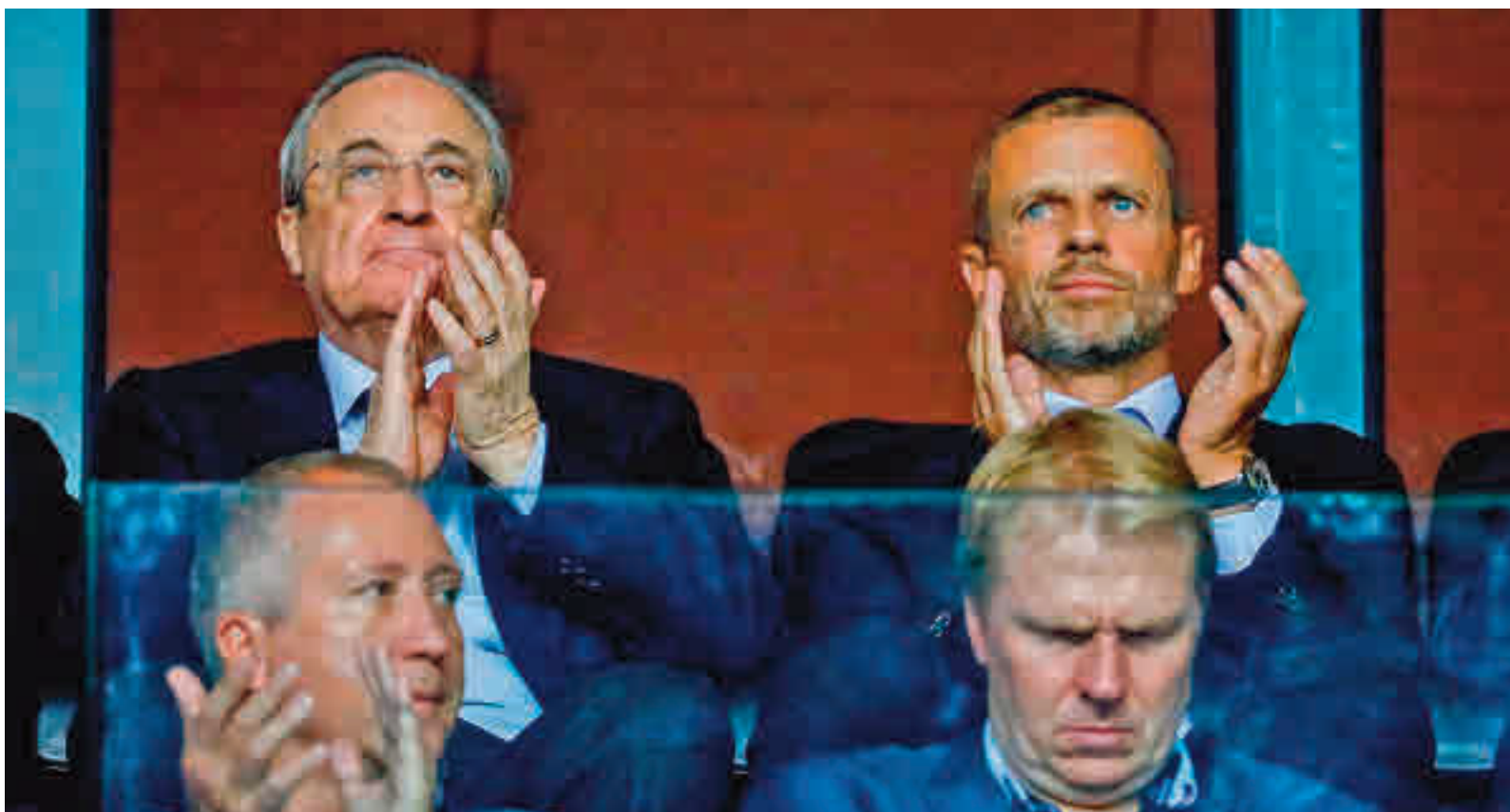
Florentino Pérez, presidente del Real Madrid, junto a su homólogo de la UEFA, Aleksander Ceferin