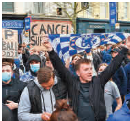
Protestas de los aficionados del Chelsea

EL PERIÓDICO GENTE NO SE RESPONSABILIZA NI SE IDENTIFICA CON LAS OPINIONES QUE SUS LECTORES Y COLABORADORES EXPONGAN EN SUS CARTAS Y ARTÍCULOS