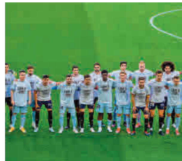
Osasuna y Valencia, con camisetas contrarias a la Superliga

el título ofrece alicientes de sobra como para que de nuevo vuelva a ser protagonista el juego. Sin apenas margen para digerir lo acontecido en la jornada intersemanal, este sábado 24 (21 horas) el Real Madrid será el primero de los candidatos al campeonato en salir a escena, para recibir al Real Betis. Tanto Barça como Atlético tendrán que jugar como visitantes en la sesión del domingo; los azulgranas jugarán en Villarreal (16:15 horas) y los rojiblancos lo harán en Bilbao (21 horas).