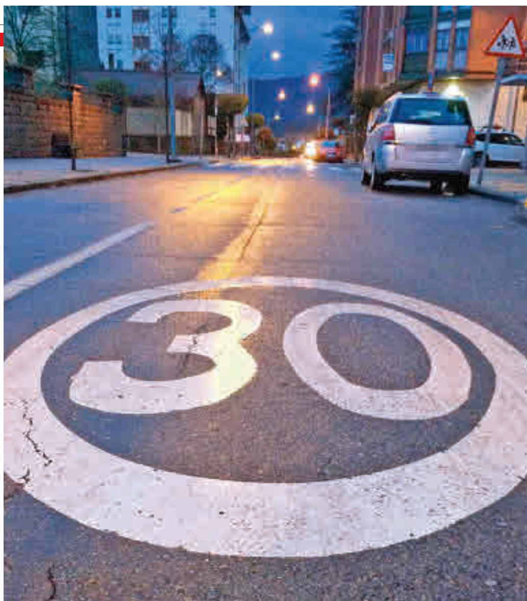
La velocidad se limitará a partir del 11 de mayo

El director general de la DGT, Pere Navarro, indicó que esta modificación se debía a que lo habían solicitado algunos ayuntamientos y la FEMP. “Es un ejemplo, un poco de complicación entre las administraciones que ayuda de alguna manera a abrir las puertas de conseguir los objetivos”, subrayó, al tiempo que añadió que disponían de estudios que sostienen que, en caso de atropello a 50 km/h, fallecen el 90% de las víctimas, mientras que a 30 km/h el porcentaje desciende hasta