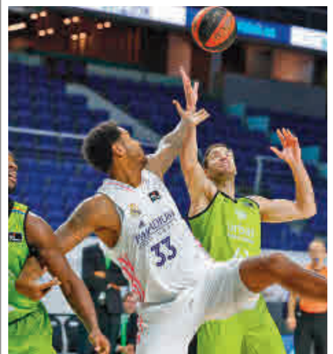
Imagen del partido de la primera vuelta