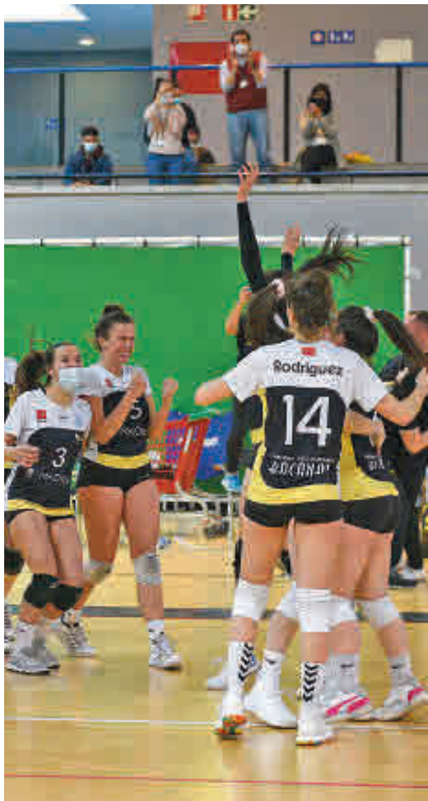
Celebración de las jugadoras del VP Madrid