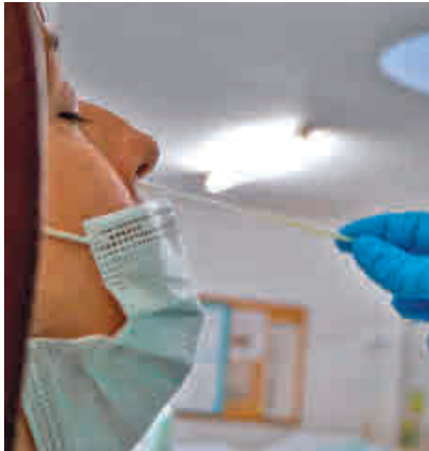
La incidencia sigue al alza en el Sur

En concreto, se trata de La Princesa (721) y Alcalde Bartolomé González (540) en Móstoles; Ramón y Cajal (506), Miguel Servet (408), Doctor Trueta (428), Los Castillos (468) y Doctor Laín Entralgo (410) en Alcorcón; Leganés Norte (484); El Greco (536), Las Ciudades (542), Sánchez Morate (489), Getafe Norte (477) y Perales del Río (474) en Getafe; y Cuzco