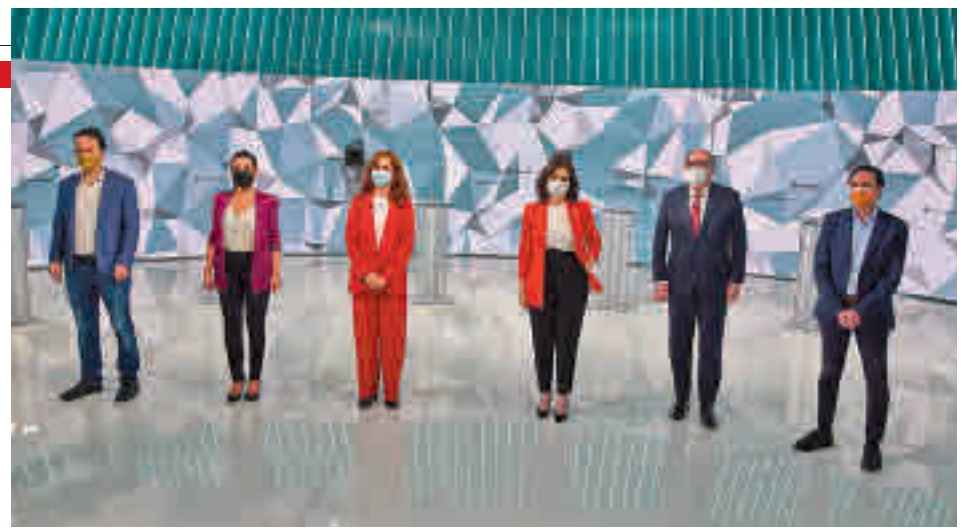
Debate de candidatos en Telemadrid