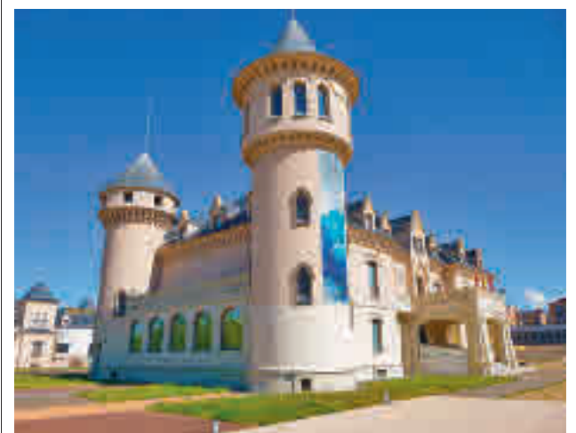
Los Castillos de Alcorcón

La investigación por el fallecimiento de un menor al ser atropellado mientras iba al patinete se encuentra "bajo secreto judicial".