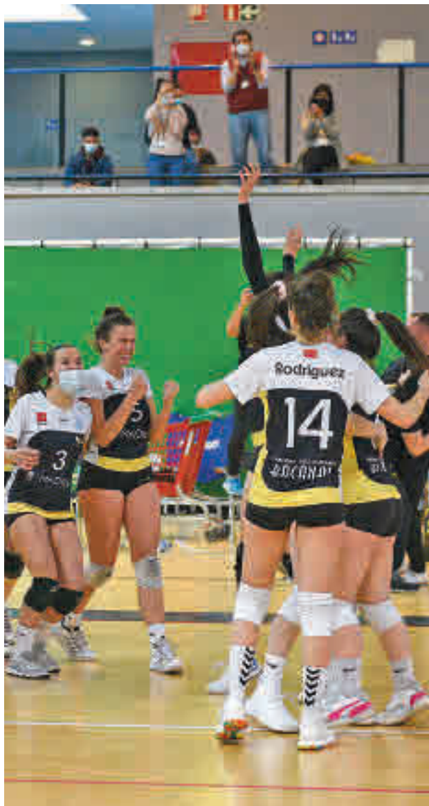
Celebración de las jugadoras del VP Madrid

cía como anfitrión. El conjunto que entrena David González llegaba a este 'play-off' con el aval de haber realizado una gran fase regular, con 49 puntos en 20 jornadas disputadas. Eso le valió el billete para una promoción donde, en primer lugar, tendría que superar al Opportunity CDU Atarfe y al CV Esplugues, compromisos que solventó con sendas victorias por 3-1 y 2-3. Ese liderato del Grupo A le deparó un cruce en semifinales con el CV Cuesta Piedra