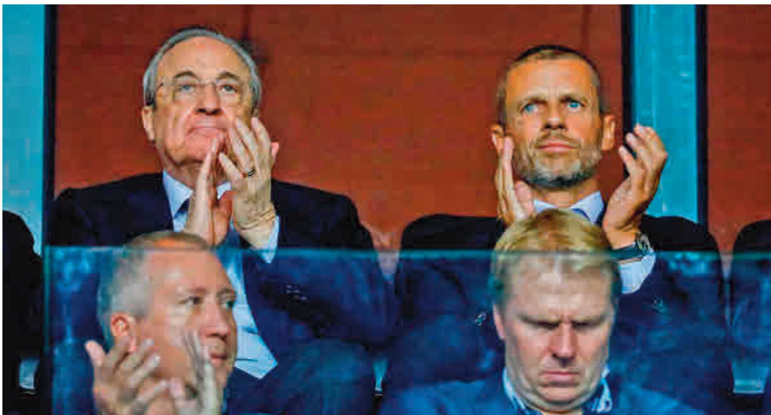
Florentino Pérez, presidente del Real Madrid, junto a su homólogo de la UEFA, Aleksander Ceferin