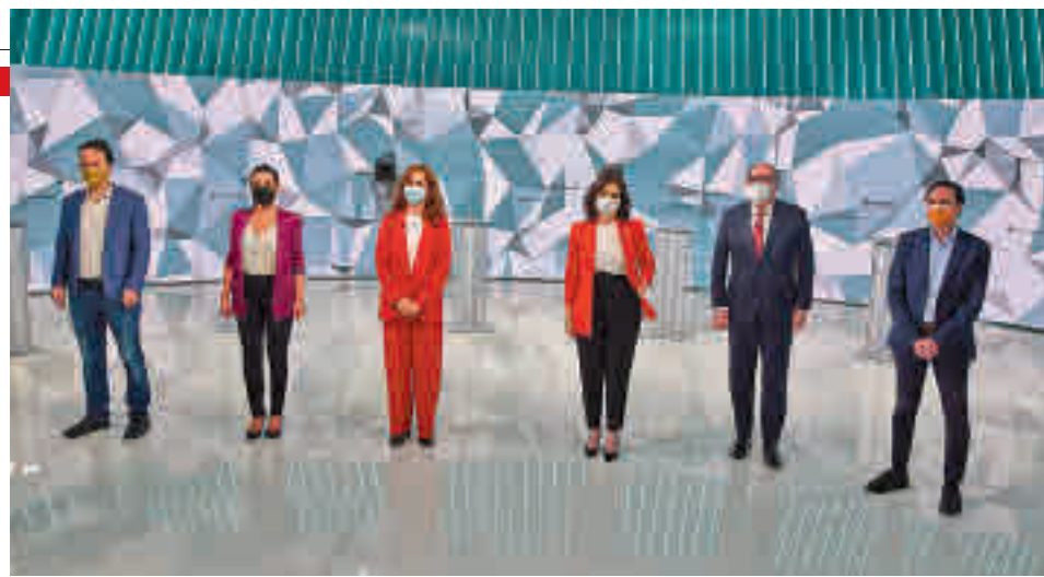
Debate de candidatos en Telemadrid

La posición más difícil fue la de Bal, cuyo partido corre el riesgo de quedarse fuera de la Asamblea. Su estrategia fue la de poner en valor los logros del Gobierno regional y advertir sobre la entrada de Vox en el mismo.