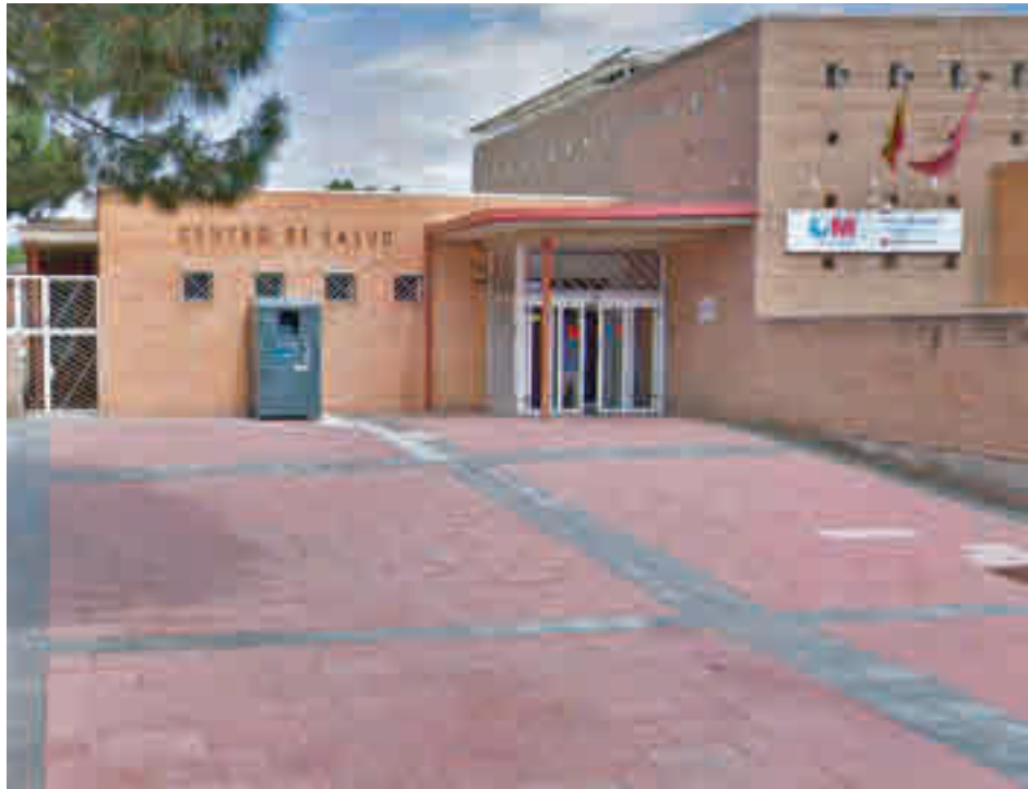
La incidencia sigue al alza en Getafe

Esta medida, que se empezó a aplicar a principios de abril, no está dando los resultados deseados en este barrio, ya que en la última semana los contagios se han incrementado, situándose en los 518 por cada 100.000 habitantes. Pero el problema no acaba ahí, ya que varias de las ZBS que limitan con Las Margaritas han visto cómo sus casos se multiplicaban, lo que cuestiona la efectividad real de la medida del Gobierno regional. Se trata de Las Ciudades (542), El Greco (536), Sánchez Morate (489)