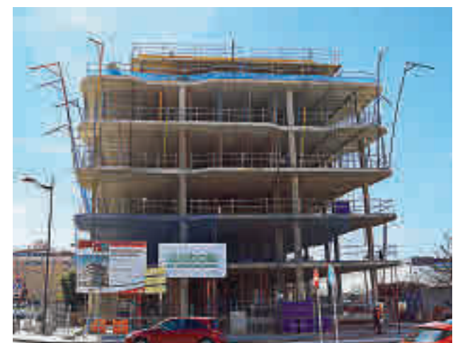
Viviendas de El Rosón

La EMSV tenía previsto finalizar a principios de este año la construcción de 147 viviendas públicas en dos parcelas de El Rosón que llevan seis años de retraso por el abandono de varias empresas constructoras y el hallazgo de suelos contaminados.