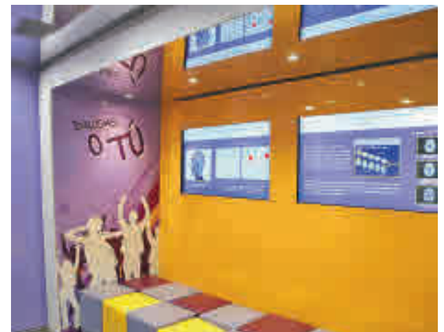
Autobús 'Drogas o tú'

Toda la información sobre este autobús y la iniciativa 'Drogas o tú' se puede consultar en la página web de la Concejalía de Juventud de Boadilla del Monte, Juventudboadilla.org.