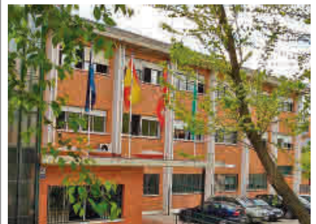
El instituto situado en el número 16 de la avenida del Monte

La actualidad de los municipios del Noroeste en nuestra web