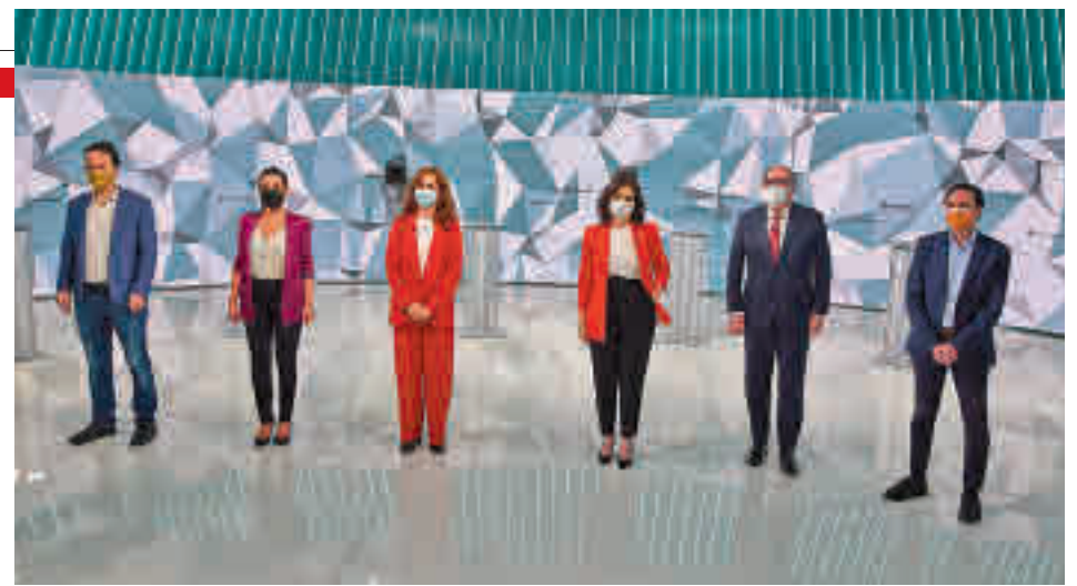
Debate de candidatos en Telemadrid

La posición más difícil fue la de Bal, cuyo partido corre el riesgo de quedarse fuera de la Asamblea. Su estrategia fue la de poner en valor los logros del Gobierno regional y advertir sobre la entrada de Vox en el mismo.