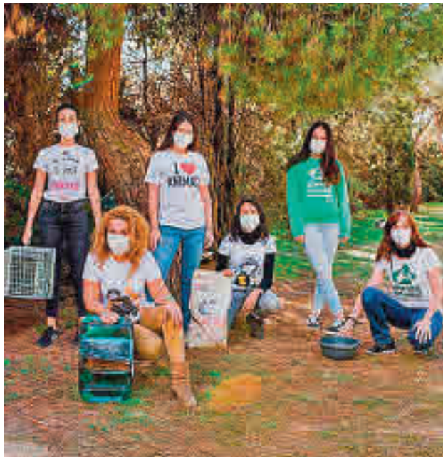
Varios jóvenes voluntarios de la localidad

Según fuentes municipales, los participantes tendrán la posibilidad de recibir información y formación específica sobre el voluntariado, co-