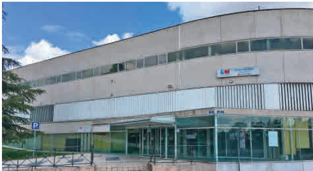
Majadahonda está confinada en su totalidad desde el lunes 19

BOADILLA SE ACERCA A LOS 500 CASOS POR CADA 100.000 VECINOS