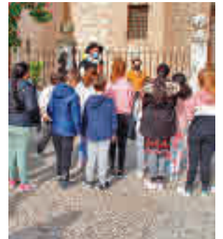
Momento de la actividad