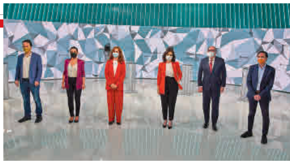
Debate de candidatos en Telemadrid