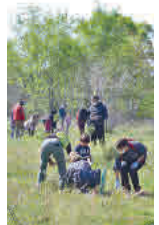
Una jornada abierta a todos

La jornada estuvo promovida por el Ayuntamiento de Rivas Vaciamadrid y contó con la colaboración de la Mancomunidad de Covibar y de las asociaciones de la Cañada Al-Shorok y Amal, así como de las AMPA del CEIP El Parque, CEIP El Olivar y la Escuela Infantil Platero. En este caso, la mayor parte de