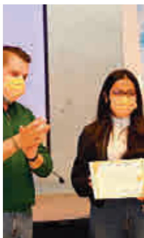
Entrega de diplomas

El proyecto buscaba realizar una campaña para captar donantes y para ello alumnos y alumnas de 4º de ESO realizaron distintas acciones de concienciación, como una exposición, un ‘flashmobe’ o la emisión de cuñas de radio grabadas por ellos mismos, todo acompañado de una campaña en redes sociales.