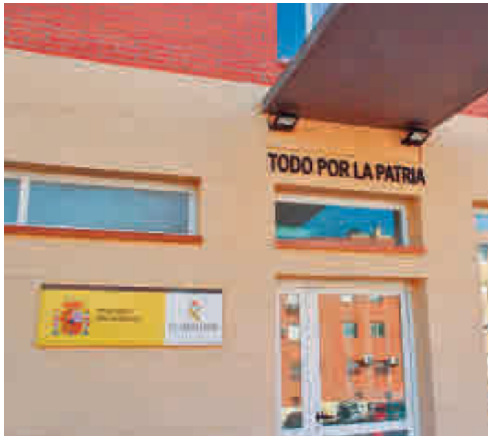
Cuartel de la Guardia Civil

La investigación se inició a finales de septiembre, cuan-