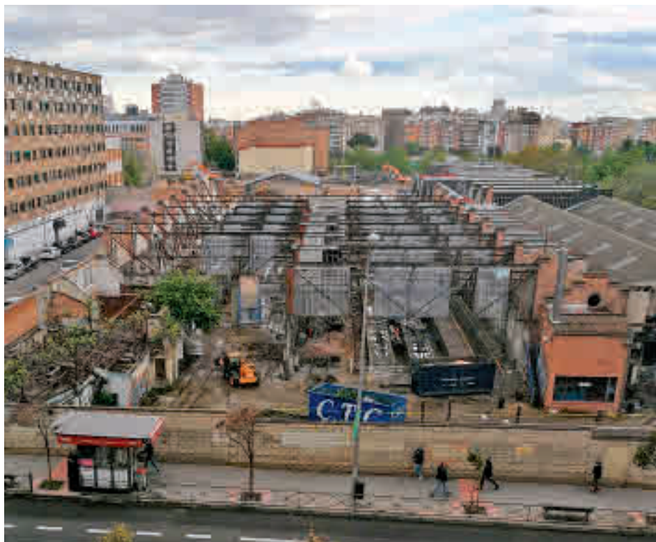
Estado actual de la antiguas cocheras de Metro MADRID CIUDAD Y PATRIMONIO

Madrid Ciudad y Patrimonio, una de las asociaciones denunciantes, considera que la anulación de este plan urbanístico implica que la licencia de demolición debería quedar también anulada por causa sobrevenida, cesando el derribo. "Nos congratulamos de la decisión judicial, pero exigimos un cambio de rumbo para buscar una solución satisfactoria al conflicto", aseguran sus responsables.