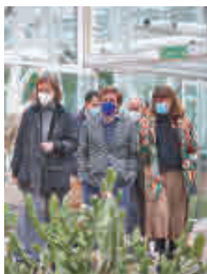
La visita del alcalde del lunes

Los primeros trabajos para recuperar el estado original