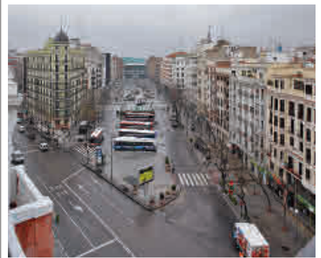
El área intermodal situada en el entorno de Goya

Toda la actualidad de los distritos de Madrid en nuestra web.