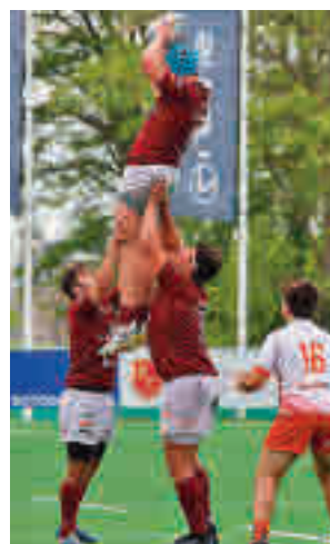
Lexus Alcobendas Rugby

Otro equipo madrileño que tiene marcado en rojo este fin de semana es el Pozuelo Rugby Unión, que disputa una de las semifinales por el ascenso en el campo del Bizkaia Gernika RT.