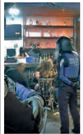
Una intervención policial

gentedigital.es Toda la actualidad de los distritos de Madrid en nuestra web