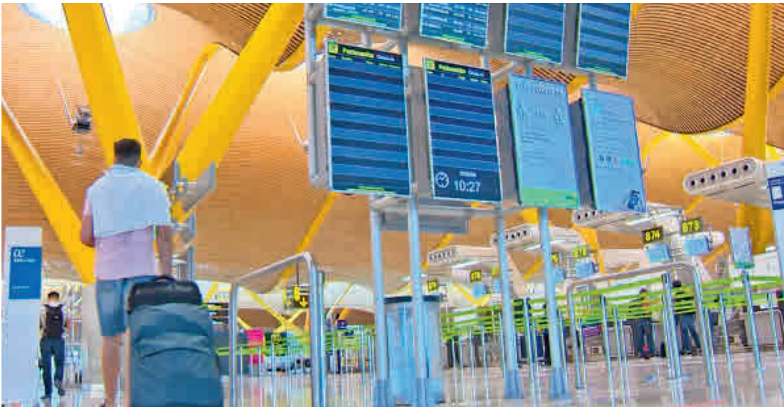
El turismo, a la expectativa