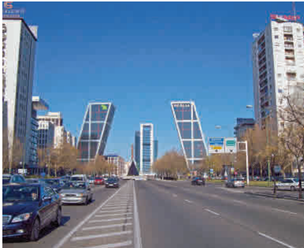
Cibeles pretende que el carril de Castellana sea la columna vertebral de la movilidad ciclista en Madrid

El segundo tramo, entre Raimundo Fernández Villaverde y San Juan de la Cruz será de medio kilómetro y otros 100 metros de sección,