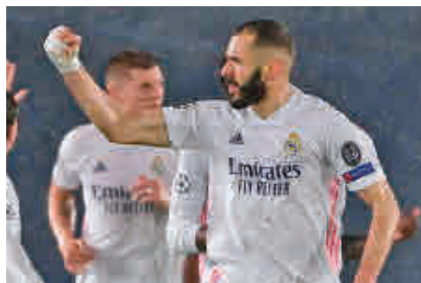
Benzema puso su firma al tanto del empate

El primer asalto de la eliminatoria con el Chelsea se saldó con un empate a uno en Valdebebas que deja todo abierto para la vuelta, pero que obliga a marcar al menos un tanto a los de Zidane