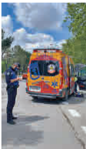
La atención sanitaria