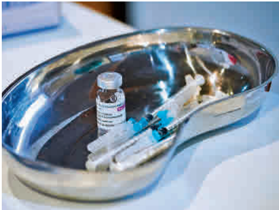
Administración de dosis de AstraZeneca

"Países como Francia o Alemania están poniendo ya una segunda dosis de vacunas ARN mensajero, mientras Irlanda ha ampliado el intervalo a 16 semanas para la mejor toma de decisiones. La EMA ha permitido que sea cada país quien tome esta decisión. En nuestro caso la decisión será el viernes", apuntó Darias. La ministra recordó que se ha iniciado un ensayo clínico, cuya vacunación a los voluntarios finalizaba este jueves, para estudiar si aplicar Pfizer a estas personas menores de 60 años que recibieron una dosis de AstraZeneca. Sus "primeras evidencias" se esperan "a mitad del mes de mayo", precisó.