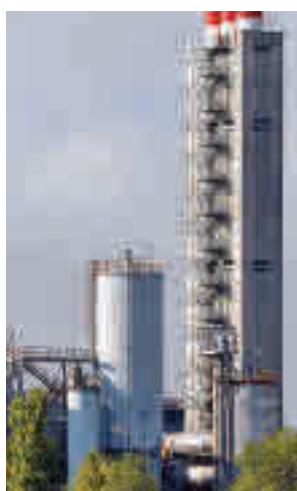
La planta de Las Lomas

Reunidas en torno a la 'Alianza Incineradora de Valdemingómez No', las entidades criticaron la situación en la planta de Las Lomas, que