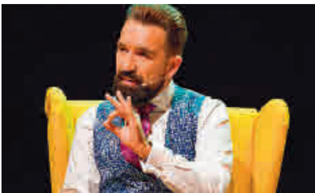
HUMOR PARA SOPLAR LAS VELAS: Para celebrar sus 20 años de carrera, Miguel Lago presenta un show de 'stand Up' con algunas de las mejores rutinas de sus últimos y aclamados shows 'Soy un Miserable' y 'Miguel Lago pone orden'.

COSLADA >> Teatro Municipal | 1 de mayo (19 horas) | Precio: 16-20 euros