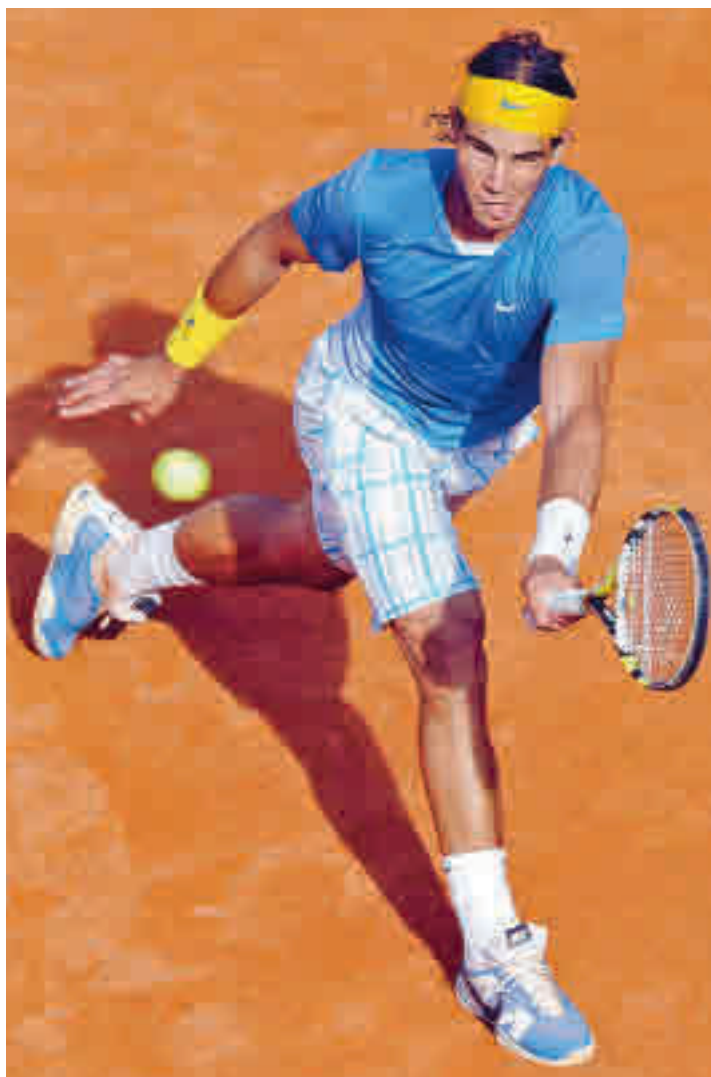
La primera vez que Nadal ganó en la Caja Mágica fue en el 2010

De este modo, Madrid se quedó de una tacada sin esas dos grandes citas, aunque en el regreso de este 2021 hay una buena noticia: el Mutua Madrid Open se extenderá más tiempo del habitual. Este martes 27 daba comienzo la competición con la disputa de varios partidos de la ronda preliminar del cuadro fe-