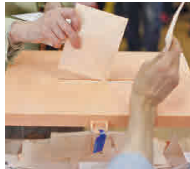
Las votaciones se realizarán con seguridad

A las personas mayores se les recomienda votar entre las 10 y las 12 horas, mientras que los que tengan síntomas deberían hacerlo entre las 19 y las 20 horas.