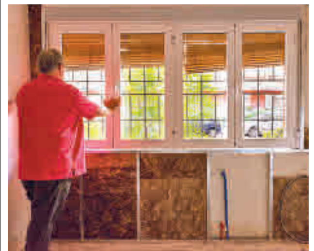
Una de las reformas realizadas

Hay que recordar que más de dos millones de personas menores de 60 años recibieron la primera dosis de AstraZeneca, principalmente trabajadores esenciales como policías, bomberos o profesores. Justo después, Sanidad decidió que estas vacunas solo se administrasen a los mayores de esa edad.