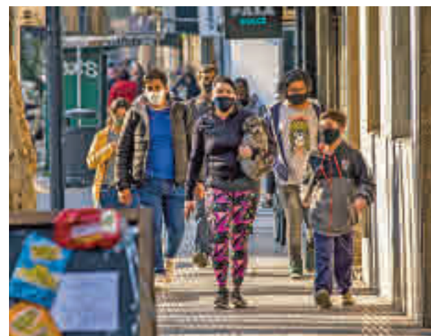
La tasa de Covid en Chamberí alcanzó los 521,25

En cuanto a número de casos, Carabanchel lidera el ranking con 1.002, seguido de Puente de Vallecas (987) y Ciudad Lineal y Fuencarral-El Pardo (928).