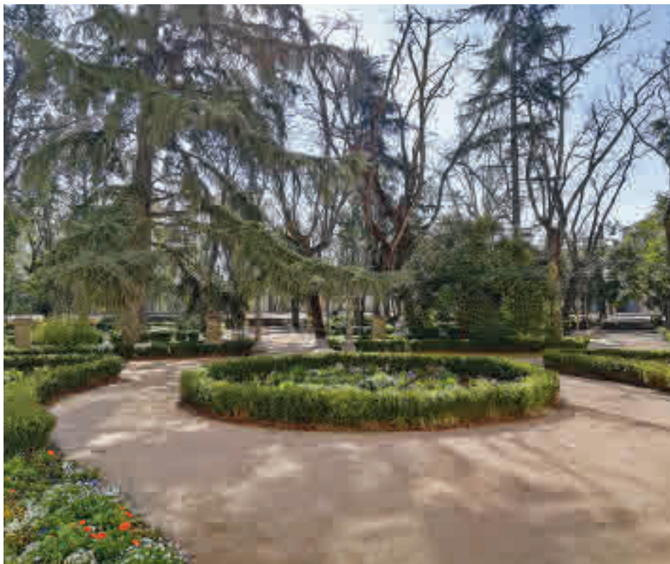
Los jardines que rodean la Plaza de las Estatuas