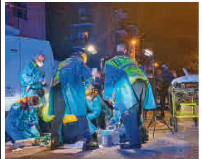
Un momento de la intervención sanitaria

Las primeras investigaciones apuntan a que 8 o 9 jóvenes presuntamente pandilleros abordaron sorpresivamente a los dos heridos. De momento, no hay detenidos. Las pesquisas señalan que podría ser una respuesta a una agresión anterior entre miembros de los Dominican Don't Play y los Trinitarios.