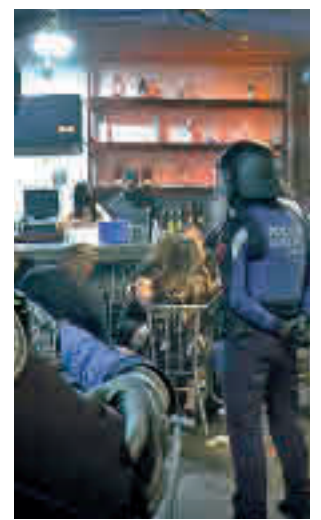
Una intervención policial

Toda la actualidad de los distritos de Madrid en nuestra web