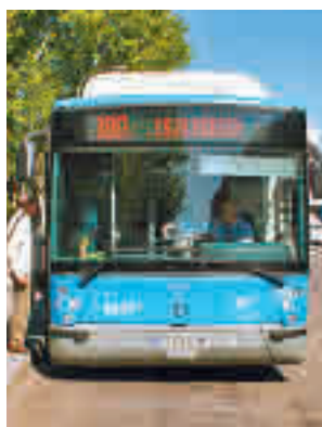
El servicio especial de la EMT

La ruta 180 prestará servicio hasta el 9 de mayo, fecha de finalización de la competición y dejará a los viajeros a