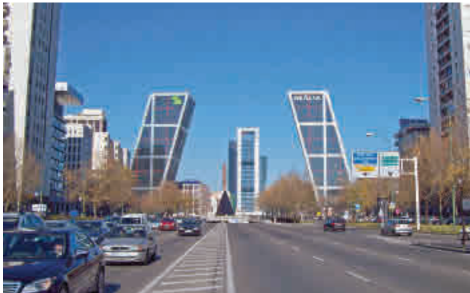
Cibeles pretende que el carril de Castellana sea la columna vertebral de la movilidad ciclista

Las obras del primer tramo, entre Plaza de Castilla y Raimundo Fernández Villaverde de 1,2 kilómetros de longitud, comenzarán a finales de año, durarán 12 meses y tendrán un coste de seis millones de euros. Estos son los primeros datos del proyecto de construcción del anunciado carril bici del Paseo de la Castellana, que dio a conocer el delegado de Medio Ambiente y Movilidad, Borja Carabante, a los grupos de la opo-