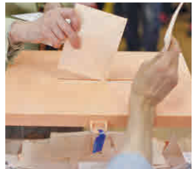
Las votaciones se realizarán con seguridad

A las personas mayores se les recomienda votar entre las 10 y las 12 horas, mientras que los que tengan síntomas deberían hacerlo entre las 19 y las 20 horas.