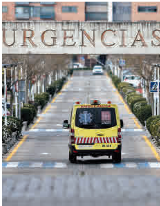
Los casos aumentan en Alcorcón

En cuanto a las dos ciudades con la tasa más elevada, la buena noticia es que han conseguido reducir sus contagios respecto a la semana pasada. La mala es que