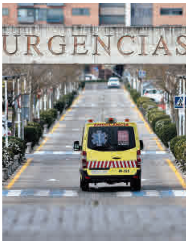
Los casos aumentan en Alcorcón

En cuanto a las dos ciudades con la tasa más elevada, la buena noticia es que han conseguido reducir sus contagios respecto a la semana pasada. La mala es que