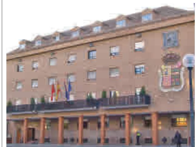
Ayuntamiento de Móstoles

El Ayuntamiento de Valdemoro organiza para el mes de mayo un programa de visitas guiadas para mayores por el casco antiguo.