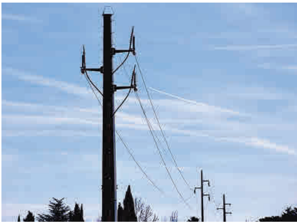
Parte del cableado que sobrevuela el cielo de la localidad roceña