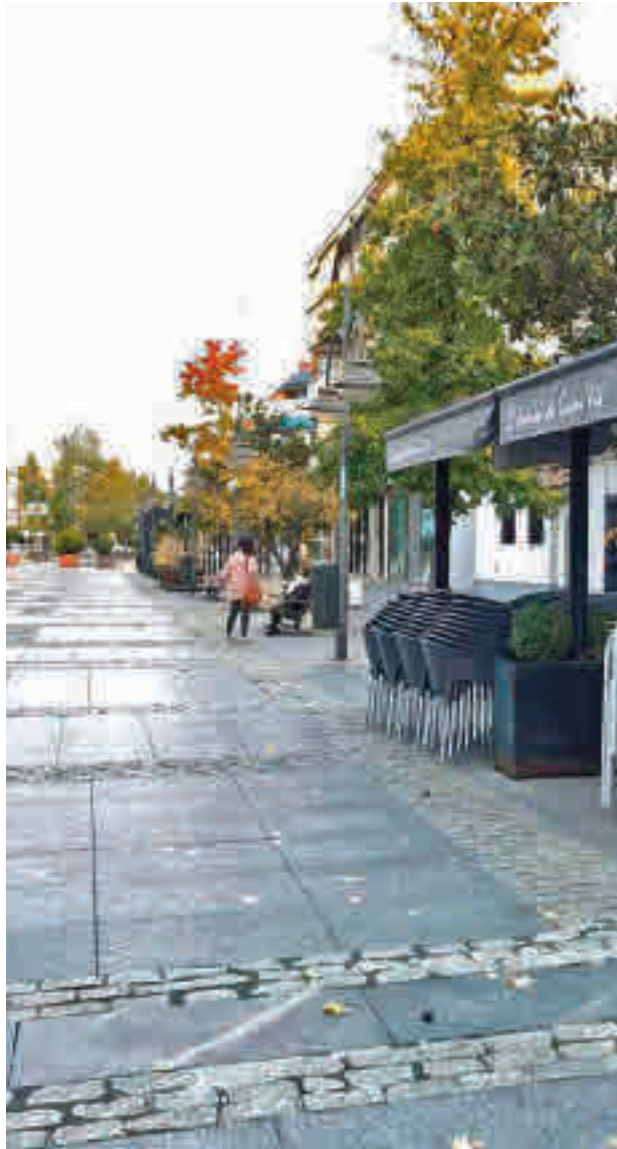
Los contagios siguen al alza en Majadahonda

Más allá de la delicada situación que se vive en Majadahonda, el comportamiento de la pandemia está sien-