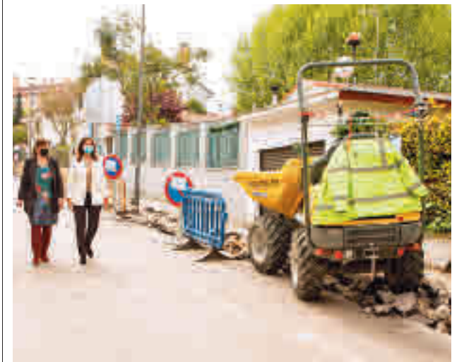
Un momento de la visita de la alcaldesa

La primera edil insistió en la necesidad de estas mejoras para facilitar el paso a los peatones.