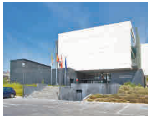
Centro de Empresas Municipal

El objetivo de la convocatoria es incentivar la creación, desarrollo y consolidación de nuevos proyectos empresariales generadores de empleo en el municipio. El Ayuntamiento valorará las ofertas presentadas dando prioridad, como en convocatorias anteriores, a las iniciativas de reciente creación y a las que tengan carácter tecnológico e innovador. Los precios de los 40 despachos profesionales, fijados en el Acuerdo de pre-