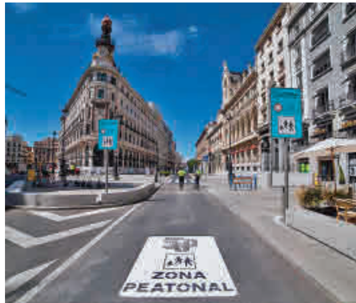
La intersección de la calle de Alcalá con Gran Vía

Según fuentes municipales, la actuación que dará continuidad a la reforma del entorno de Canalejas, también incluye las calles de Marqués de Casa Riera, Barqui-