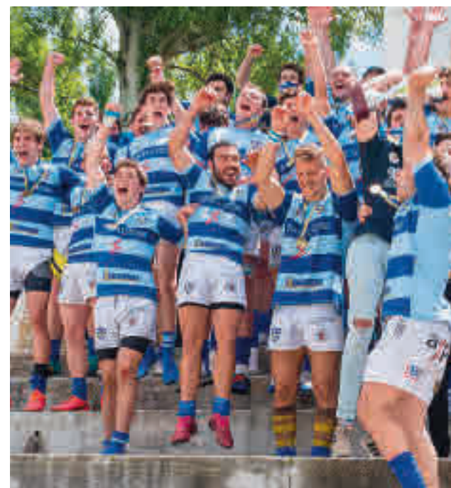
El Complutense recibiendo el trofeo WALTER DE GIROLDO/RFER

El Grupo C de la Primera División femenina de fútbol sala depara este fin de semana un derbi entre el Futsi Navacarrero y el Alcorcón, tras el revés que ambos equipos sufrieron en la Copa.