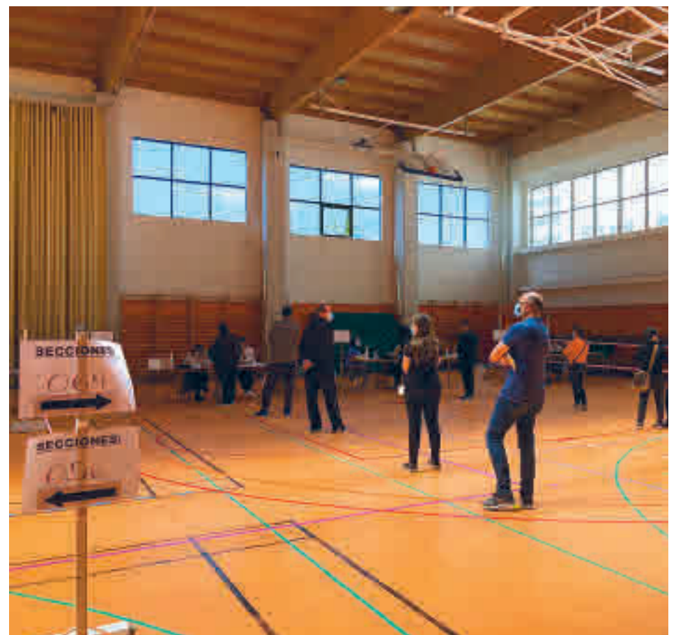
Varios electores esperan para votar en el colegio Gredos San Diego Las Suertes LUCA JIMÉNEZ

En concreto, el PP cosechó 807.189 votos, con una diferencia de casi 500.000 votos con su inmediato perseguidor, Más Madrid (318.437). La tercera fuerza fue el PSOE, que se dejó por el camino 132.774 votos y se quedó en un 16,08%.