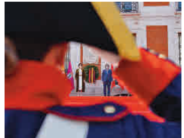
Uno de los momentos del homenaje

A continuación, la Dirección de Acuartelamiento del Ejército interpretó 'La Muerte no es el final' mientras la corona era trasladada hasta situarse delante de la placa conmemorativa a los Héroes del 2 de Mayo. Al finalizar, Ayuso y el alcalde de Madrid colocaron la corona de laurel en la placa a los Héroes del Dos de Mayo.