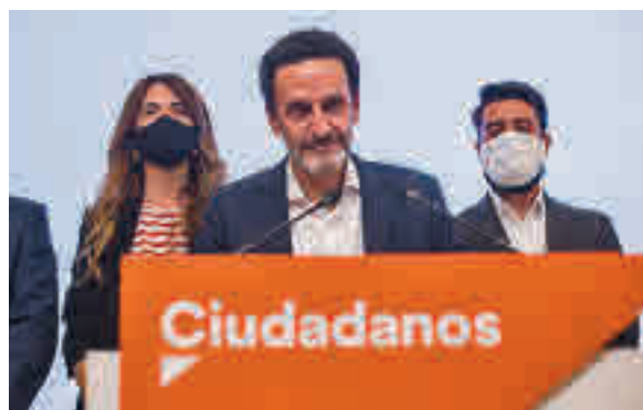
Edmundo Bal comparece tras conocer los resultados

Los más que previsible choques con el Ejecutivo de Pedro Sánchez serán una constante en los próximos meses, pero en el horizonte de la presidenta regional se dibujan varios retos que tendrá que afrontar lo antes posible. El primero de ellos lo citó ella misma en una entrevista realizada con GENTE la pasada semana: la aprobación de los presupuestos. Hay que recordar que la Comunidad se rige por unas cuentas elaboradas por Cristina Cifuentes en 2018. Díaz Ayuso cuenta ahora con el capital político y parlamentario necesario para acabar con esta situación de cara a los próximos dos años.