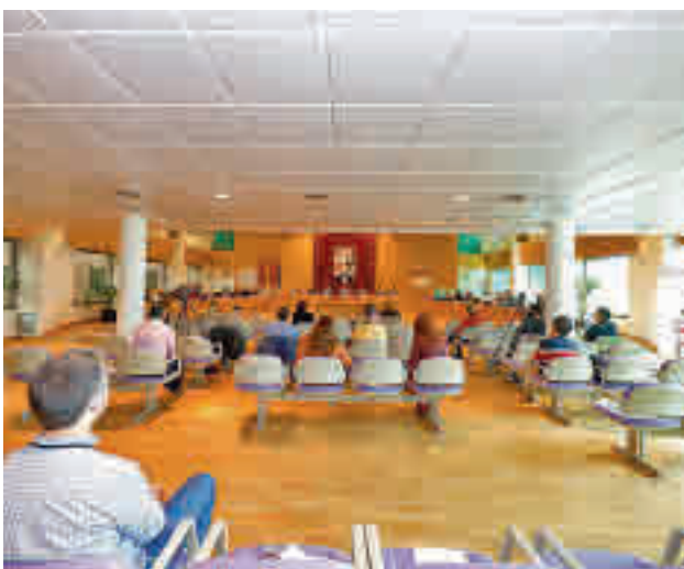
Imagen de la sesión plenaria