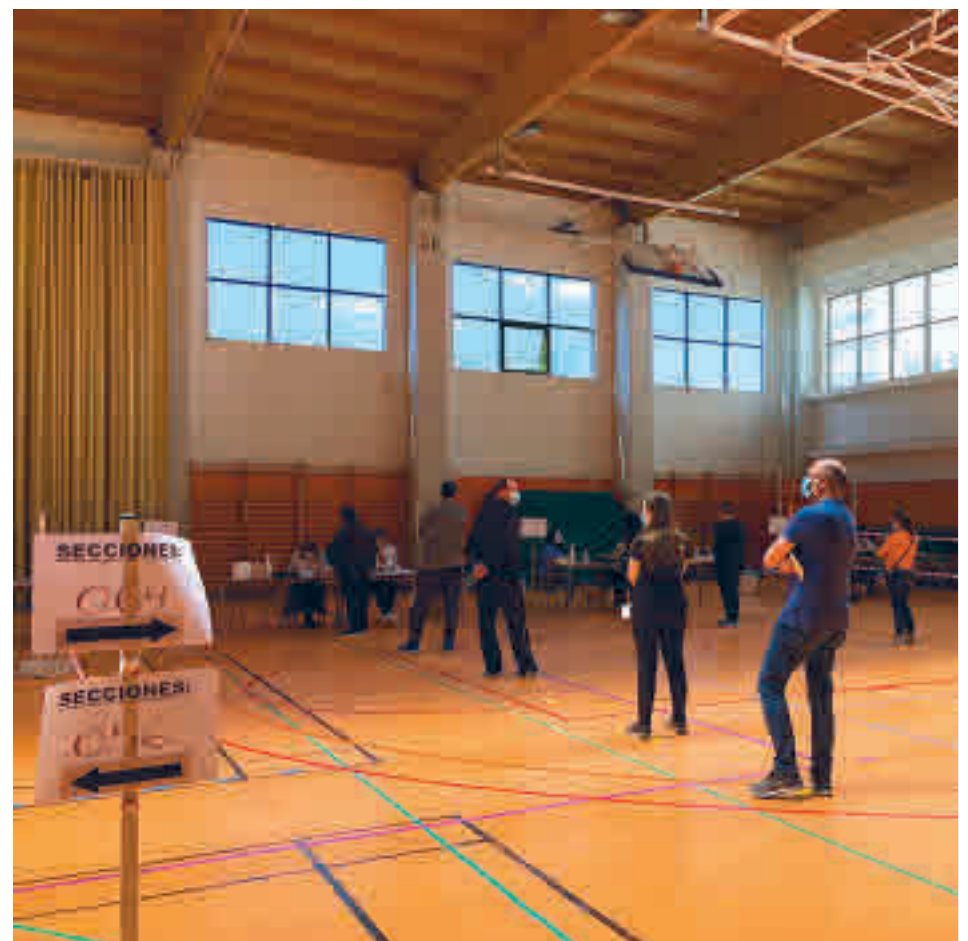
Varios electores esperan para votar en el colegio Gredos San Diego Las Suertes LUCA JIMÉNEZ

En concreto, el PP cosechó 807.189 votos, con una diferencia de casi 500.000 votos con su inmediato perseguidor, Más Madrid (318.437). La tercera fuerza fue el PSOE, que se dejó por el camino 132.774 votos y se quedó en