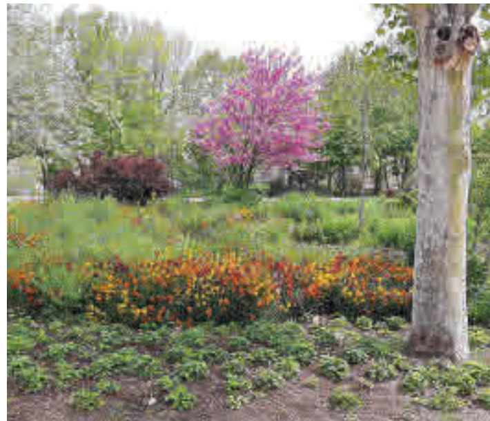
La antigua finca de recreo está situada en el corazón de Carabanchel

Los vecinos de Carabanchel reivindican la apertura libre de la antigua finca de recreo todos los días • Aseguran que no se les ha tenido en cuenta tras más de 30 años de demanda