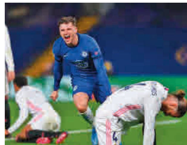
Mason Mount marcó el 2-0 definitivo

vencionista positiva, planteó un once en el que aparecían Sergio Ramos y Hazard, ambos lejos de su mejor momento de forma, lo que desplazó en el dibujo táctico a Eder Militao y Vinicius, dos futbolistas que, sin tener el recorrido del sevillano y el belga, sí que habían sido más determinantes en el pasado más reciente.