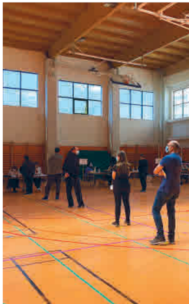
Electores en el colegio Gredos San Diego Las Suertes

Por su parte, el distrito de Salamanca permitió a Vox alzarse con su mejor resultado en la ciudad al situarse en un 10,34% de los votos y ser tercera fuerza, curiosamen-