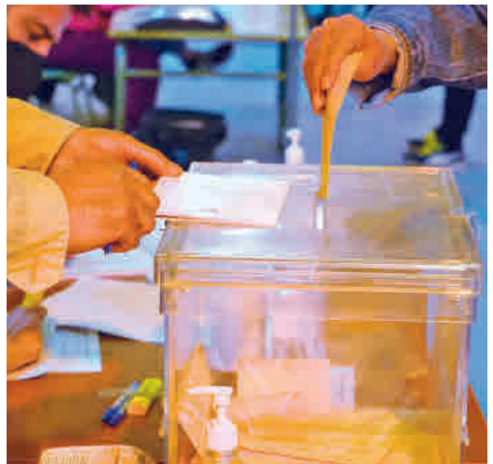
Colegio electoral en Móstoles este 4 de mayo

Pero el vuelco no se queda ahí. Si se analizan los datos por bloques, hace dos años la derecha (PP, Vox y Ciudadanos) solo consiguió más de la mitad de los apoyos en Valdemoro, mientras que en las otras cuatro localidades la suma de la izquierda (PSOE, Más Madrid y Unidas Podemos) se imponía con bastante claridad. Eso también ha cambiado, ya que las formaciones más conservadoras han obtenido más votos que las progresistas en las cinco