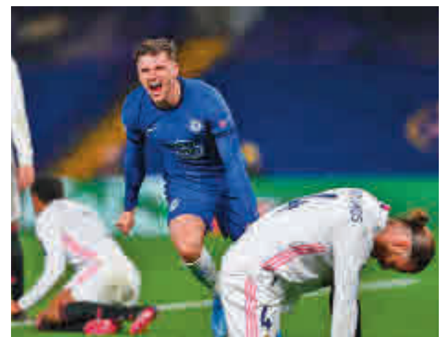
Mason Mount marcó el 2-0 definitivo

vencionista positiva, planteó un once en el que aparecían Sergio Ramos y Hazard, ambos lejos de su mejor momento de forma, lo que desplazó en el dibujo táctico a Eder Militao y Vinicius, dos futbolistas que, sin tener el recorrido del sevillano y el belga, sí que habían sido más determinantes en el pasado más reciente.