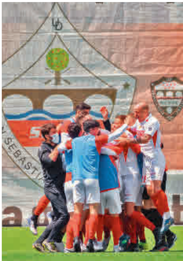
El Sanse ya está en el 'play-off'

EL UNIÓN ADARVE TAMBIÉN FESTEJÓ OTRO HITO: EL ASCENSO A LA SEGUNDA RFEF