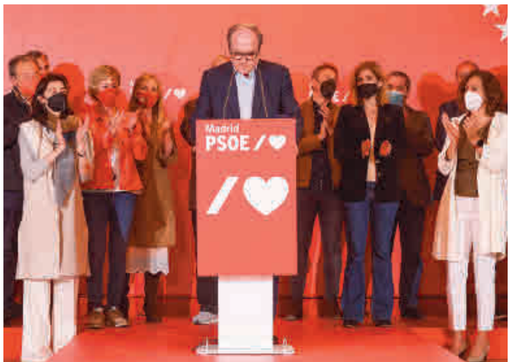
Ángel Gabilondo, tras su derrota electoral

El portavoz socialista tiene ahora dos opciones: quedarse en el grupo parlamentario sabiendo que no repetirá como candidato por cuarta vez o salir de la política regional. Hombre de partido, espera órdenes de Ferraz.