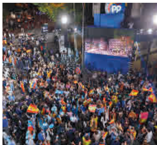
Fiesta del PP en Génova

EL PERIÓDICO GENTE NO SE RESPONSABILIZA NI SE IDENTIFICA CON LAS OPINIONES QUE SUS LECTORES Y COLABORADORES EXPONGAN EN SUS CARTAS Y ARTÍCULOS