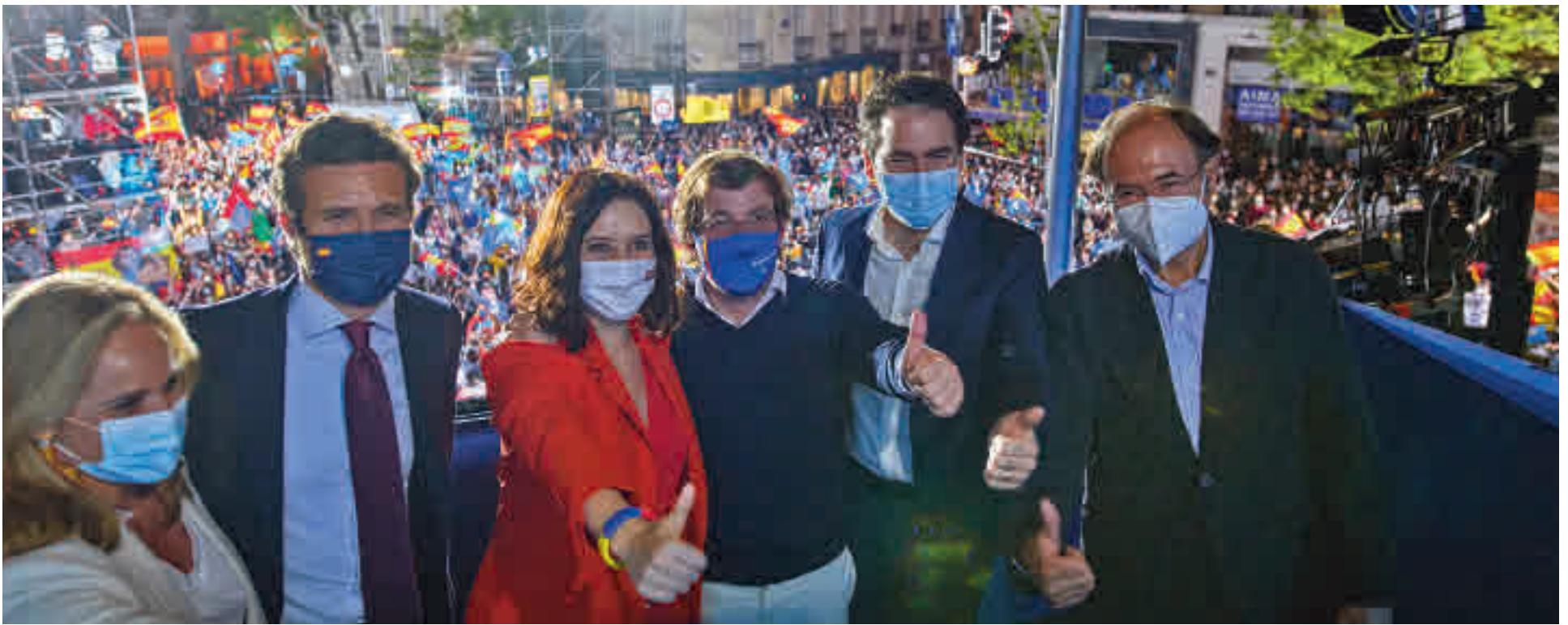
Isabel Díaz Ayuso celebra su victoria electoral