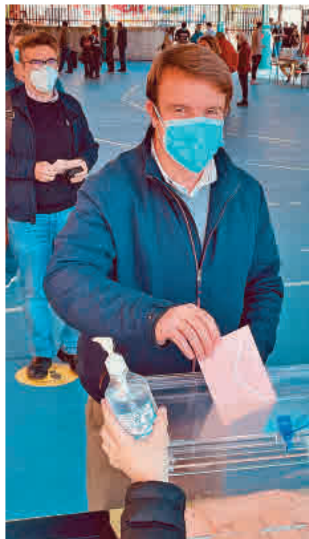
El alcalde de Tres Cantos, durante la votación

EL PSOE PASÓ DE SER LA PRIMERA FUERZA A CAER HASTA EL TERCER LUGAR