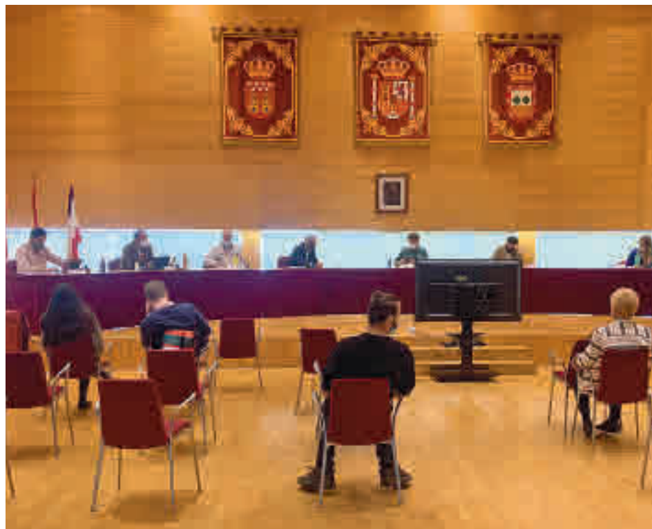
Imagen de la última sesión plenaria

gentedigital.es La actualidad de Tres Cantos y Colmenar Viejo, en la web.