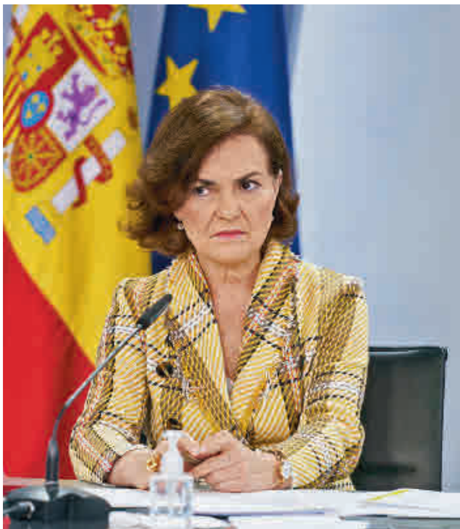
Carmen Calvo, tras el Consejo de Ministros

El Gobierno quiere evitar la situación que se dio el verano pasado cuando, tras el fin del estado de alarma, los tribunales no avalaron en algunos casos las restricciones aprobadas por los gobiernos autonómicos, produciéndose contradicciones entre terri-