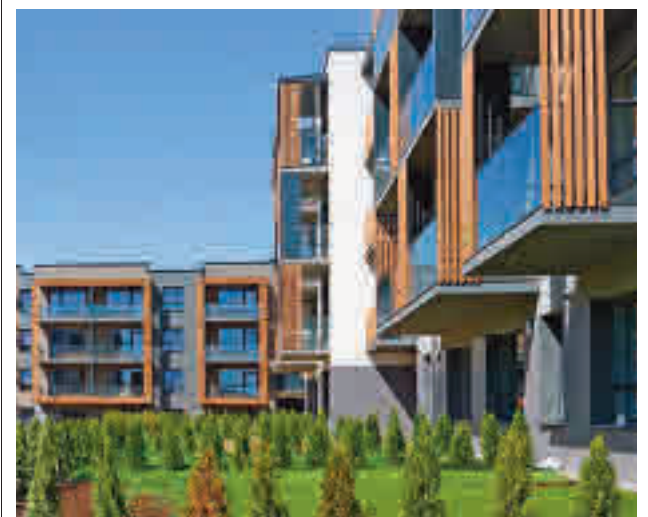
El sector inmobiliario experimenta cambios GENTE

Al margen de la sentencia de El Tagarral, una de las noticias que ha marcado la actualidad de Tres Cantos en los últimos tiempos ha sido el escándalo de Vivotecnia, un laboratorio que está acusado de maltrato animal. El grupo municipal socialista presentó una moción que solicitaba, entre otras cosas, declarar a Vivotecnia como ‘empresa non grata’ y revocar el reconocimiento a todas aquellas o personas relacionadas con el maltrato animal. La iniciativa, con algunas modificaciones introducidas por el grupo municipal popular, salió adelante con los votos de C’s, PSOE, Ganemos y PP y la abstención de Podemos.