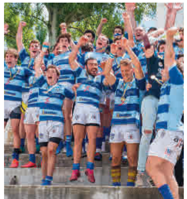
El Complutense recibiendo el trofeo WALTER DE GIROLDO/RFER

El Grupo C de la Primera División femenina de fútbol sala depara este fin de semana un derbi entre el Futsi Navacarrero y el Alcorcón, tras el revés que ambos equipos sufrieron en la Copa.