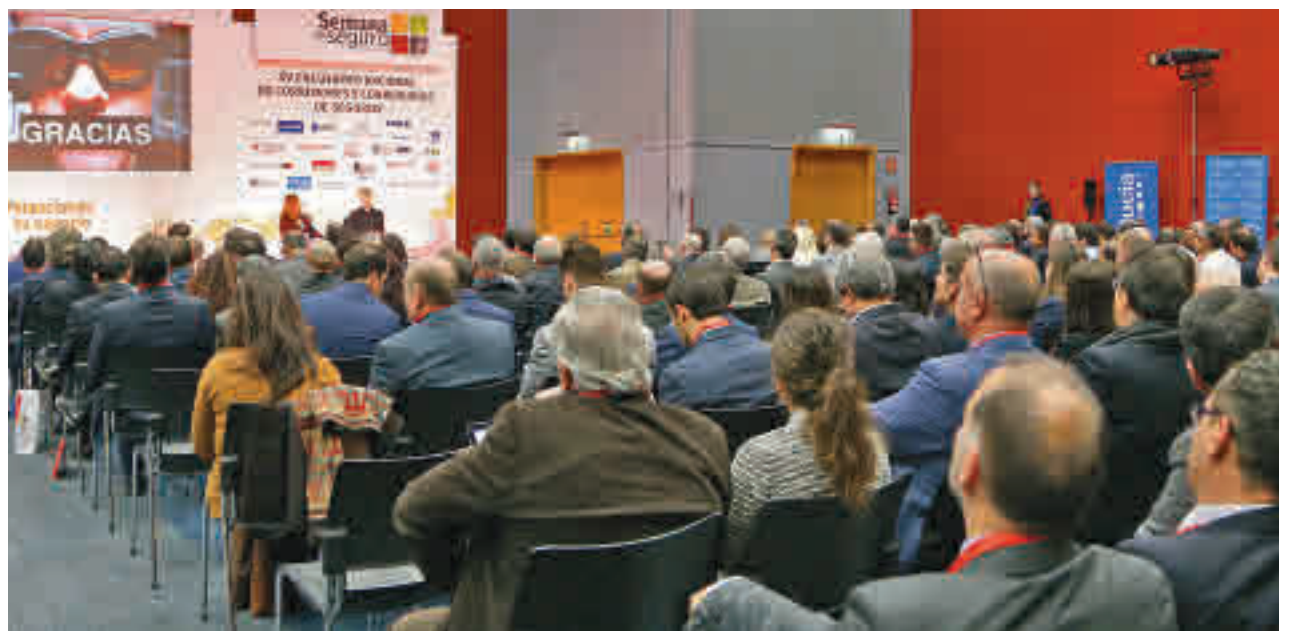
Una de las pasadas ediciones de la Semana del Seguro

Tres son las principales novedades de esta edición de la Semana del Seguro, que se celebra bajo el lema 'Recalcando la Ruta'. La primera es el cambio de fechas respecto a la habitual celebración durante el mes de febrero. La segunda, la ampliación a la tarde del jueves de la programación de jornadas. Y la tercera, la celebración, por pri-