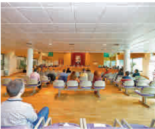
Imagen de la sesión plenaria