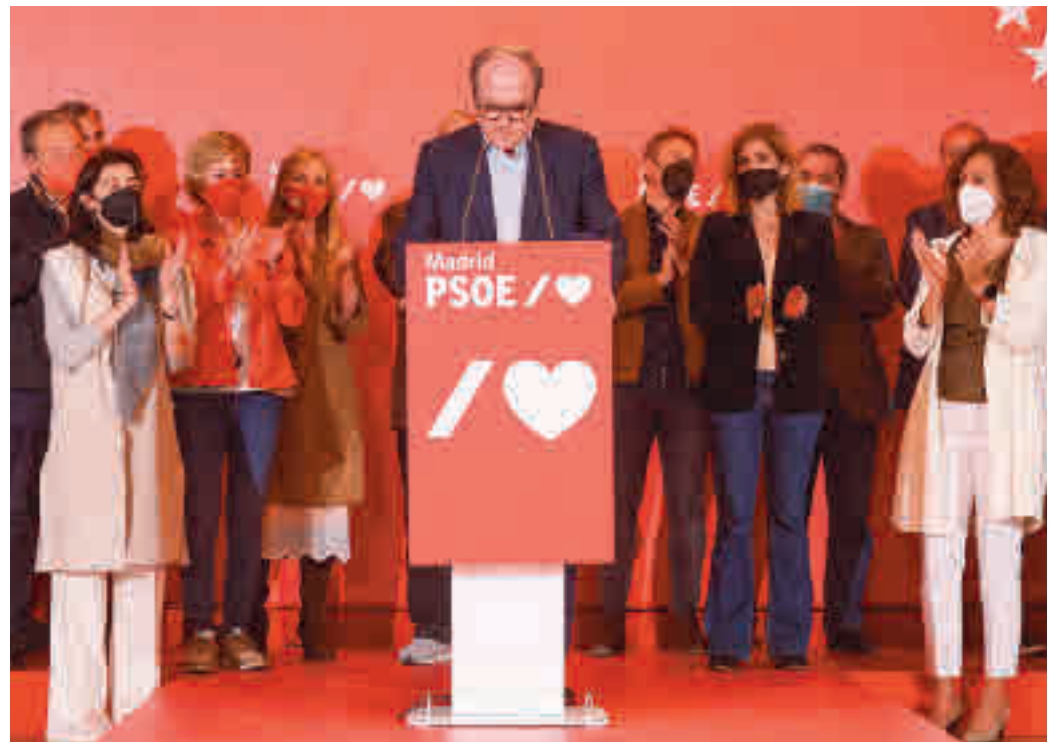
Ángel Gabilondo, tras su derrota electoral

El portavoz socialista tiene ahora dos opciones: quedarse en el grupo parlamentario sabiendo que no repetirá como candidato por cuarta vez o salir de la política regional. Hombre de partido, espera órdenes de Ferraz.