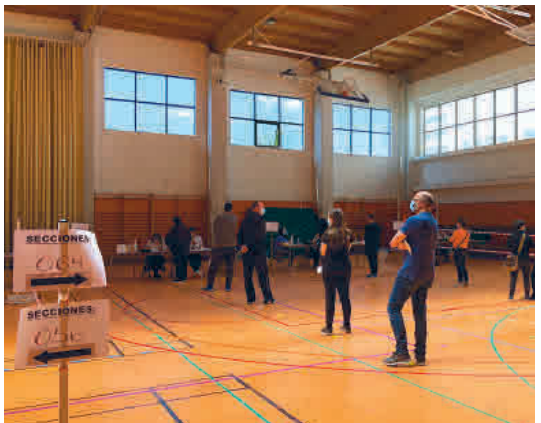
Varios electores esperan para votar en el colegio Gredos San Diego Las Suertes LUCA JIMÉNEZ

Tanto Puente como Villa de Vallecas, distritos trabajadores del Este, votaron de forma mayoritaria al PP, que en ambas zonas logró ser primera fuerza. Pese a ser feudo de Unidas Podemos (UP), el partido de izquierdas más votado fue Más Madrid, que en Puente de Vallecas cosechó un 27,52%, mientras que