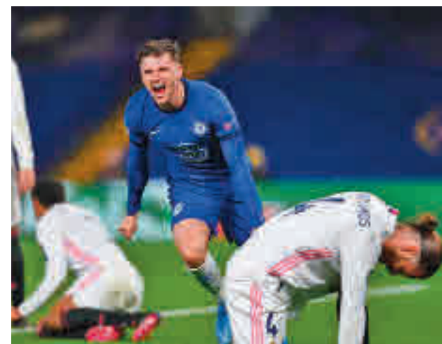
Mason Mount marcó el 2-0 definitivo

vencionista positiva, planteó un once en el que aparecían Sergio Ramos y Hazard, ambos lejos de su mejor momento de forma, lo que desplazó en el dibujo táctico a Eder Militao y Vinicius, dos futbolistas que, sin tener el recorrido del sevillano y el belga, sí que habían sido más determinantes en el pasado más reciente.