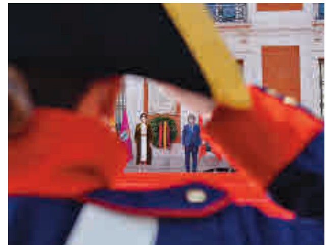
Uno de los momentos del homenaje

A continuación, la Dirección de Acuartelamiento del Ejército interpretó 'La Muerte no es el final' mientras la corona era trasladada hasta situarse delante de la placa conmemorativa a los Héroes del 2 de Mayo. Al finalizar, Ayuso y el alcalde de Madrid colocaron la corona de laurel en la placa a los Héroes del Dos de Mayo.