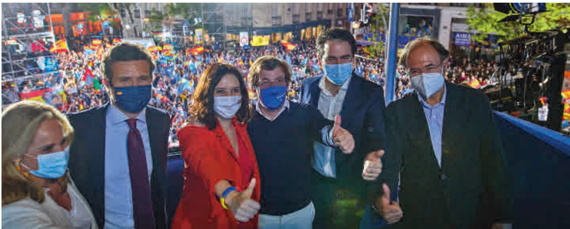
Isabel Díaz Ayuso celebra su victoria electoral