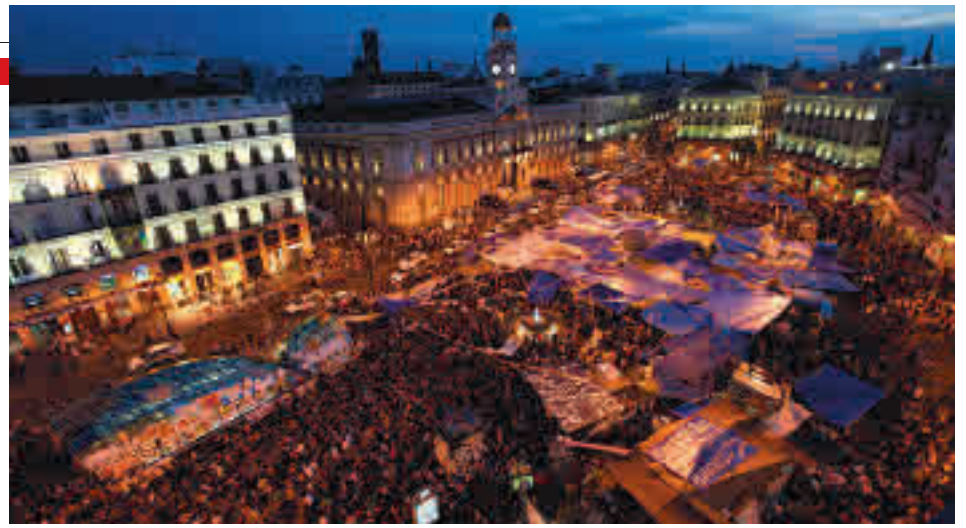
Campamento del 15M en la Puerta del Sol GENTE

jóvenes pensaban, pero es innegable que aquel movimiento, inicialmente desligado de opción política alguna, ha condicionado gran parte de lo que ha sucedido en nuestro país en la última década.