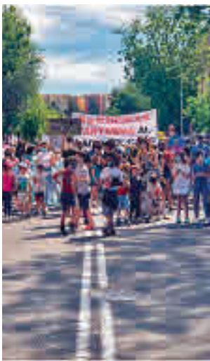
Un momento de la protesta