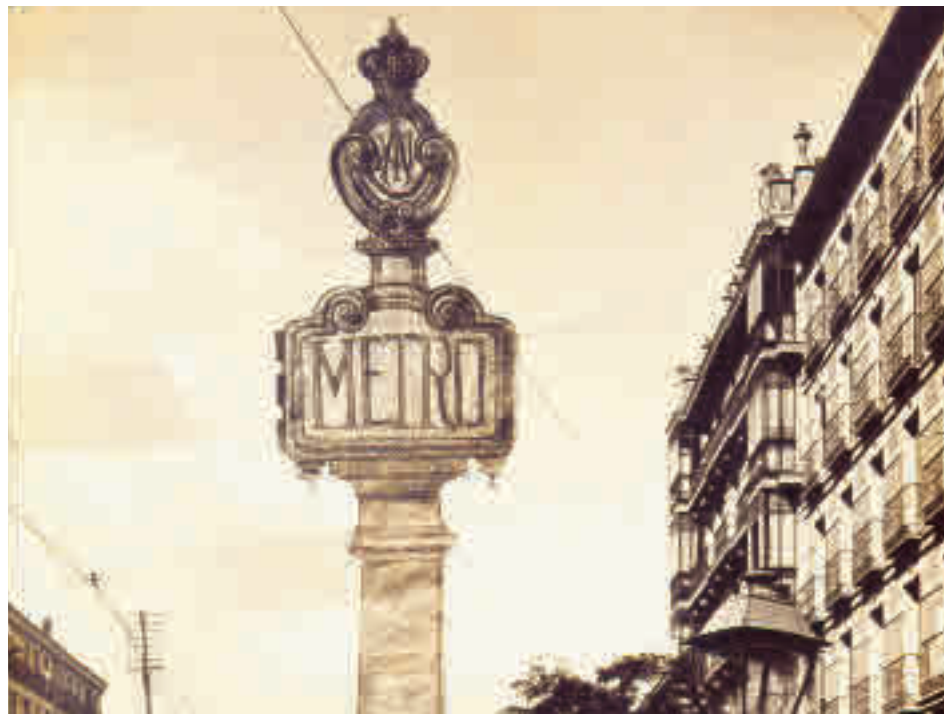
El tótem de Cuatro Caminos, en una imagen de archivo

La tematización que va a llevar a cabo Metro de Madrid incluye, entre otras acciones, rediseñar y recrear el elemento ornamental que se colocaba originalmente en los accesos, con el que se pretendía señalar desde lejos la ubicación de las bocas de entrada del suburbano. Esta actuación también prevé combinar las paredes con acabados en azulejo viselado blan-