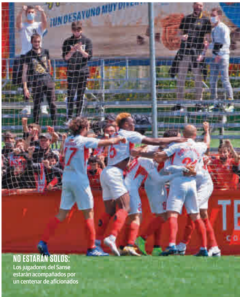
NO ESTARÁN SOLOS: Los jugadores del Sanse estarán acompañados por un centenar de aficionados

La otra opción madrileña la representa el Real Madrid Castilla, que de la mano de