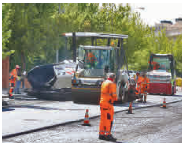
Trabajadores extienden el nuevo firme en Moncloa-Aravaca

'Operación Asfalto' de 2021. Moncloa-Aravaca será el distrito más beneficiado de esta zona al ver incluidos 74 viarios en esta campaña seguido muy de lejos de Centro (49) y Chamberí (46). Además, habrá obras en 37 vías de Sala-