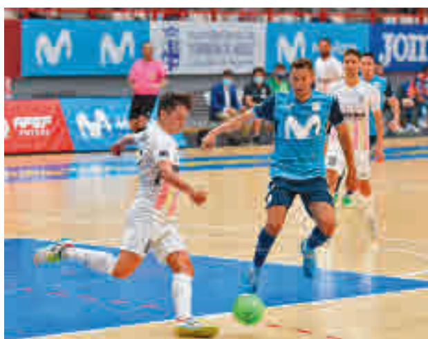
Su rival en semifinales será Industrias Santa Coloma

Primera División. A pesar de ello, el cuadro de Tino Pérez tratará de cambiar la dinámica en la 'Final Four' de la Copa del Rey. Este sábado 15 (21 horas) jugará la semifinal con el anfitrión, el Industrias Santa Coloma. En caso de ganar, jugará la final el domingo con Levante o ElPozo.